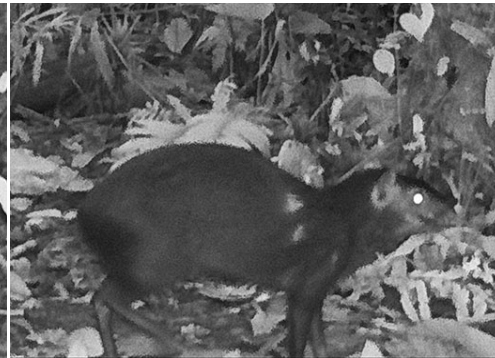
5 Dasyprocta fuliginosa DASYPROCTIDAE Agutí negro Black Agouti