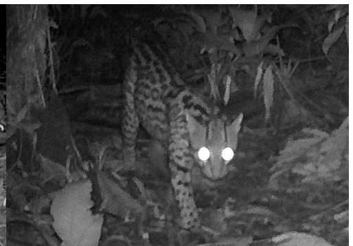
18 Leopardus pardalis FELIDAE Ocelote Ocelot