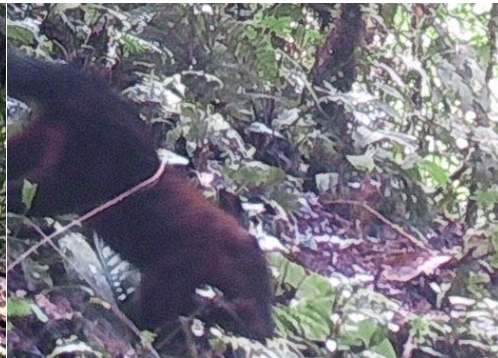
14 Nasua nasua PROCYONIDAE Coatí Sudamericano South American Coati