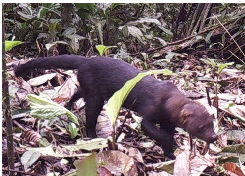
16 Eira barbara MUSTELIDAE Taira Tayra