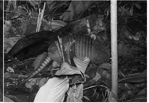
3 Dasypus novemcinctus DASYPODIDAE Armadillo de Nueve Bandas Nine-banded Armadillo