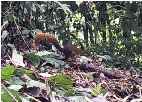
13 Hadrosciurus spadiceus SCIURIDAE Ardilla roja sur amazónica Southern Amazon Red Squirrel