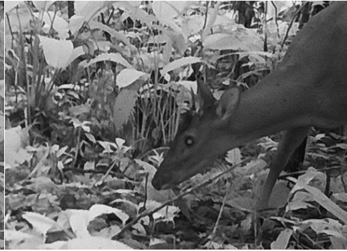
11 Mazama zamora CERVIDAE Corzuela roja de Zamora Zamora Red Brocket