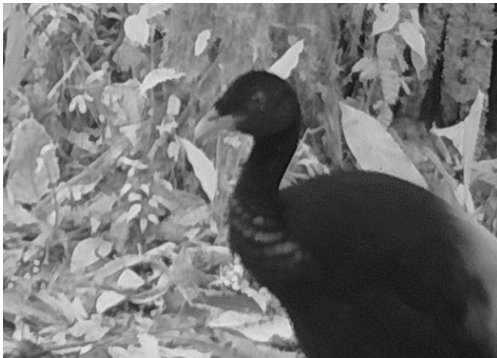
22 Psophia crepitans PSOPHIIDAE Trompetero Aligrís Gray-winged Trumpeter