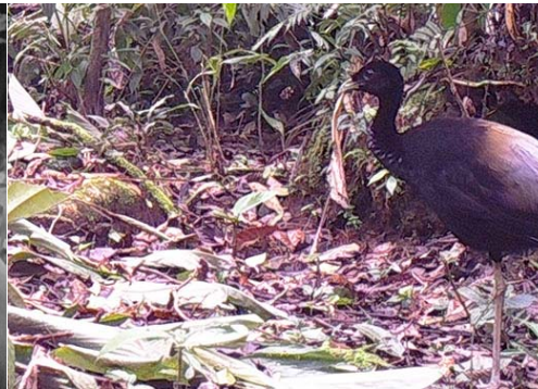
23 Psophia crepitans PSOPHIIDAE Trompetero Aligrís Gray-winged Trumpeter