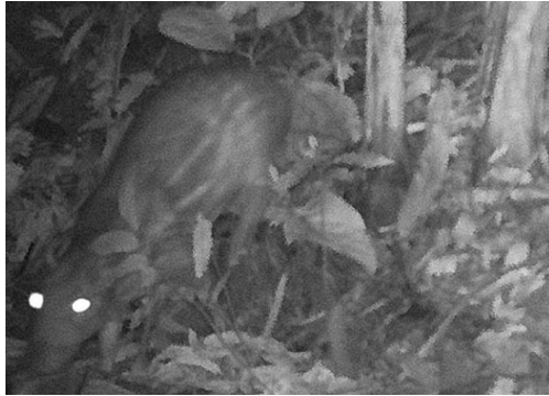
1 Cuniculus paca CUNICULIDAE Paca de Tierras Bajas Lowland Paca