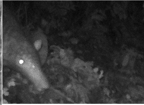
2 Priodontes maximus DASYPODIDAE Armadillo gigante Giant Armadillo