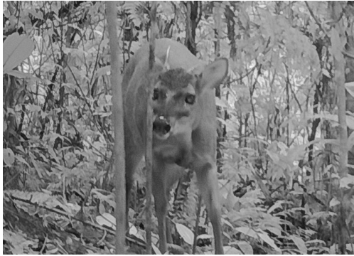
10 Mazama zamora CERVIDAE Corzuela roja de Zamora Zamora Red Brocket