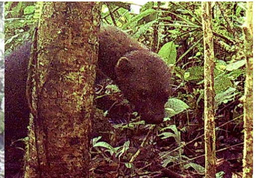
15 Eira barbara MUSTELIDAE Taira Tayra