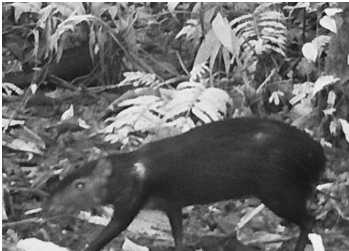
4 Dasyprocta fuliginosa DASYPROCTIDAE Agutí negro Black Agouti