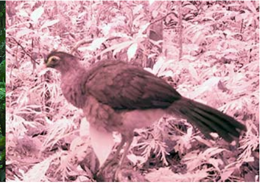
21 Nothocrax urumutum CRACIDAE Pavón Nocturno Nocturnal Curassow