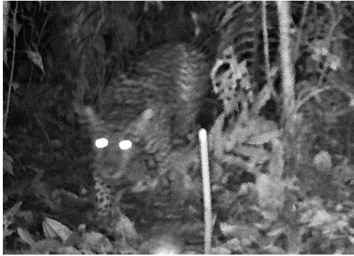
19 Panthera onca FELIDAE Jaguar Jaguar