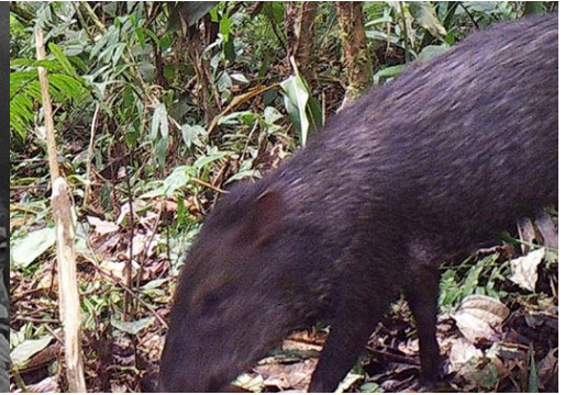
12 Pecari tajacu TAYASSUIDAE Pecarí de Collar Collared Peccary