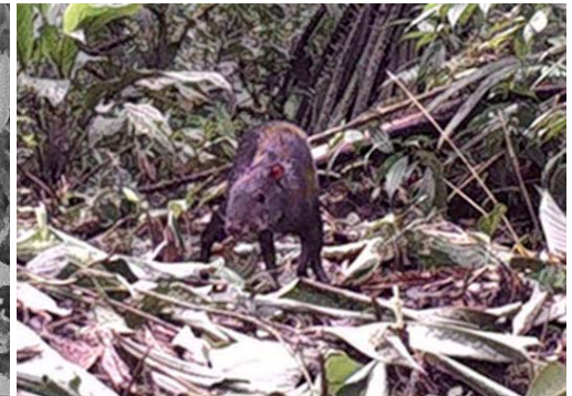
6 Dasyprocta fuliginosa DASYPROCTIDAE Agutí negro Black Agouti