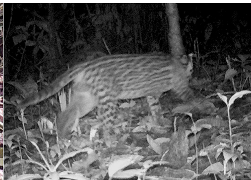
17 Leopardus pardalis FELIDAE Ocelote Ocelot