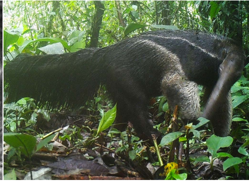
20 Myrmecophaga tridactyla TAYASSUIDAE Oso hormiguero gigante Giant Anteater