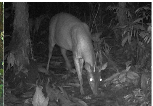
9 Mazama zamora CERVIDAE Corzuela roja de Zamora Zamora Red Brocket