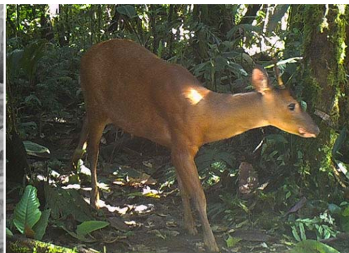
8 Mazama zamora CERVIDAE Corzuela roja de Zamora Zamora Red Brocket