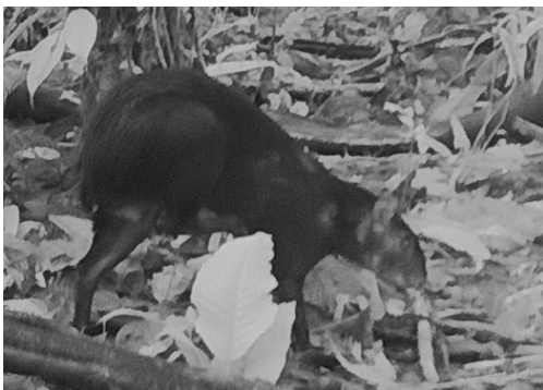
7 Dasyprocta fuliginosa DASYPROCTIDAE Agutí negro Black Agouti