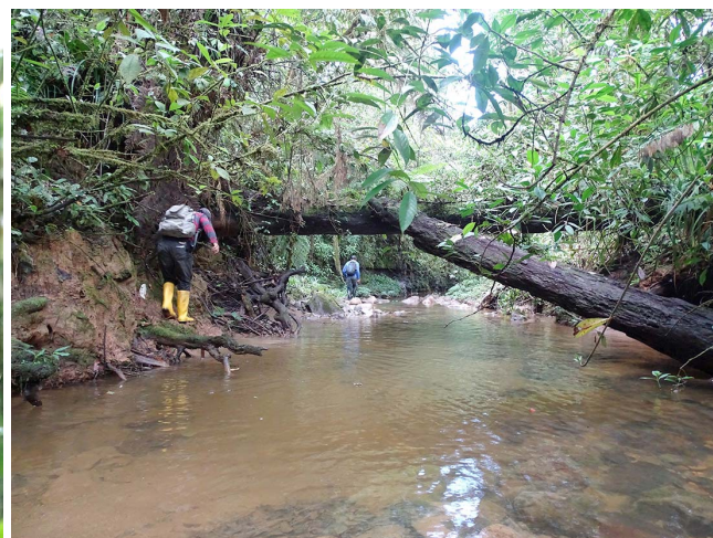
Paisaje típico en territorio comunitario Cofán Sinangoe, al interior del Parque Nacional Cayambe Coca