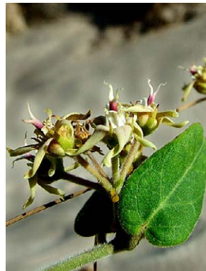
73 O. tomentosum