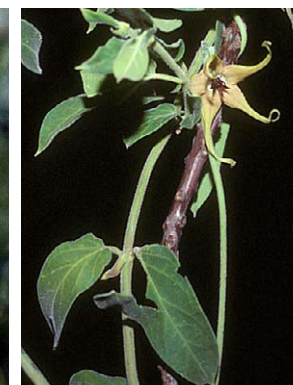
60 O. polyanthum