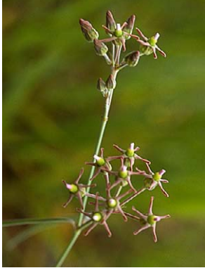
1 O. aequaliflorum

© Environmental & Conservation Programs, The Field Museum, Chicago, IL 60605 USA. [RRC@fmnh.org] [www.fmnh.org/plantguides/] Rapid Color Guide # 212 versão 1 8/2007