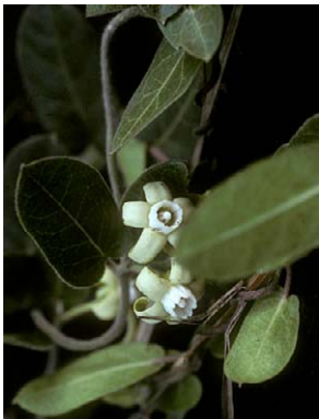
71 O. sublanatum