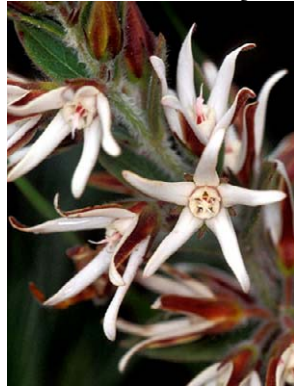
22 O. erectum