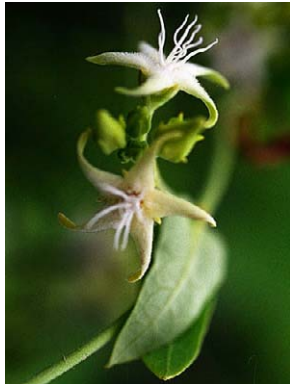
67 O. silvestris