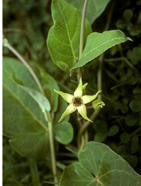
62 O. regnellii