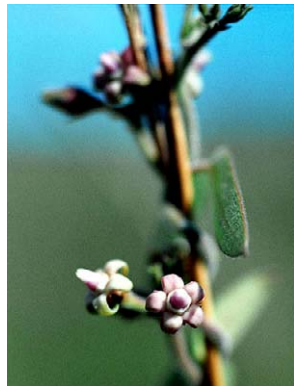
32 O. habrogynum