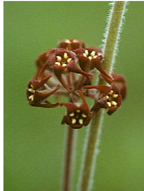
8 O. arnottianum