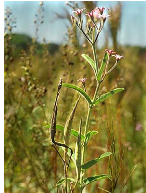
68 O. solanoides