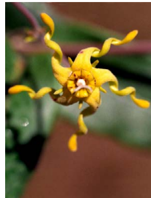
34 O. helios