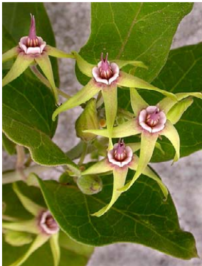
11 O. banksii