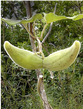
6 O. appendiculatum