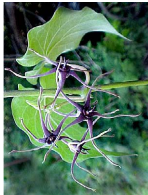
18 O. cordifolium