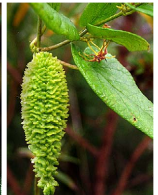
80 O. wightianum