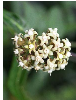
74 O. tubatum