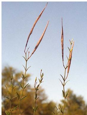
36 O. humile