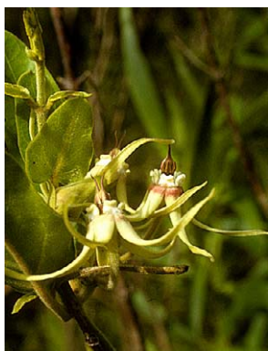
57 O. pannosum