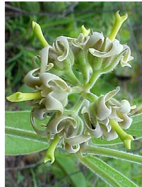
14 O. capitatum