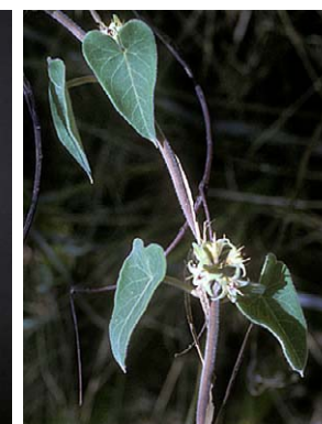
55 O. pachygynum