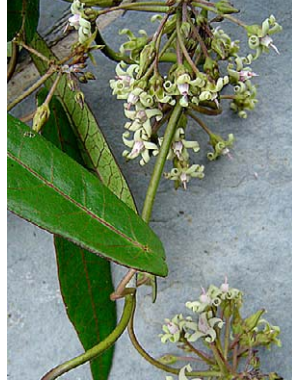
3 O. alpinum