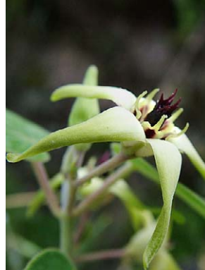
63 O. regnellii