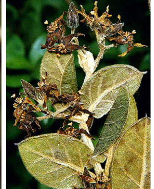
65 O. rusticum