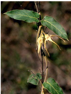
76 O. warmingii