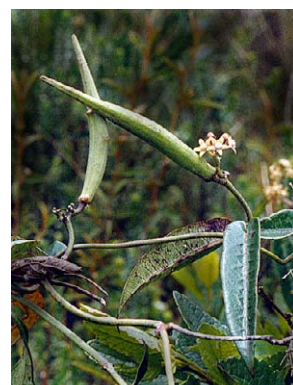
53 O. pachyglossum