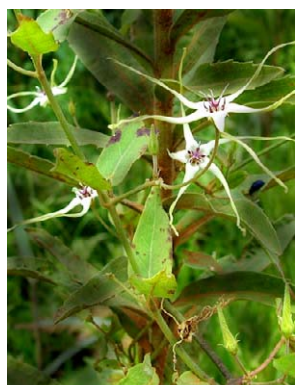
51 O. mosenii