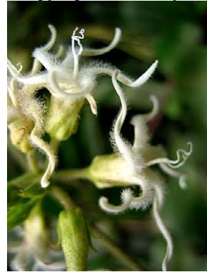
24 O. erianthum