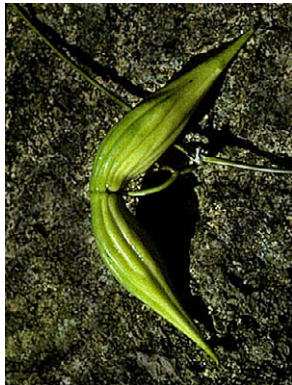
12 O. banksii