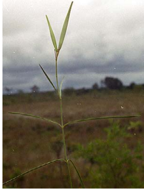
2 O. aequaliflorum