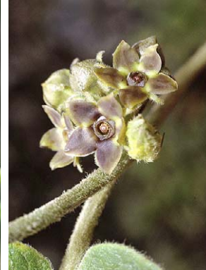
64 O. retusum