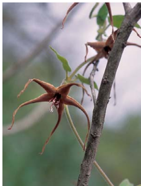
77 O. warmingii