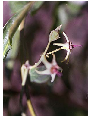
9 O. balansae