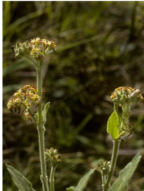
7 O. arnottianum