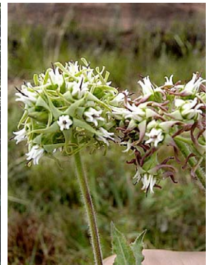
20 O. crispum