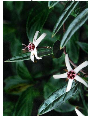
43 O. leonii