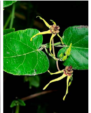
10 O. banksii