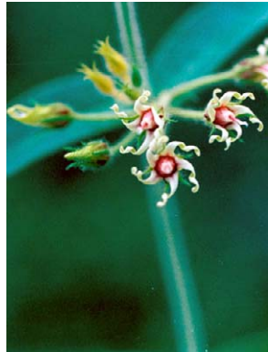
27 O. foliosum