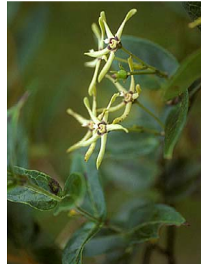
29 O. glabrum