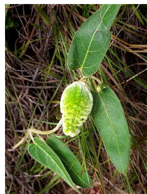
58 O. pannosum