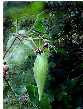
19 O. cordifolium