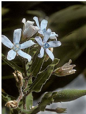
17 O. coeruleum