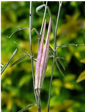
16 O. chodatianum