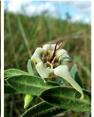
70 O. strictum