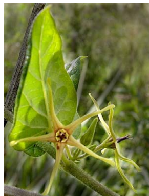
78 O. wightianum