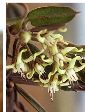
50 O. montanum