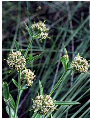
13 O. capitatum