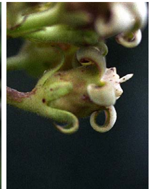
75 O. tubatum