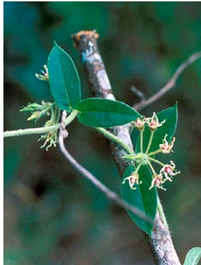
26 O. foliosum (volúvel)