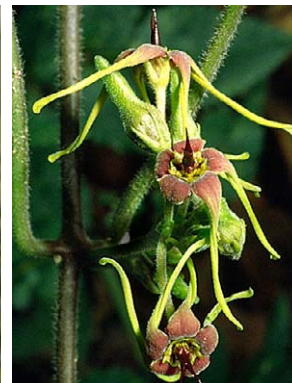
79 O. wightianum