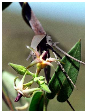
56 O. pachygynum