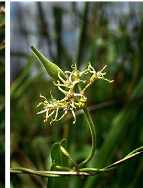
45 O. macrolepis