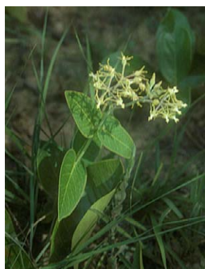
46 O. marginatum