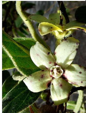
41 O. lanatum

Fotos: M.A. Farinaccio, exceto onde indicado. Produzido por R. B. Foster, M.A. Farinaccio e T. Wachter, com apoio de Ellen Hyndman fund. © M. A. Farinaccio [mafarinaccio@hotmail.com] & R. Mello-Silva, Instituto de Biociências, Universidade de São Paulo, Brasil. Apoio da Fundação de Amparo à Pesquisa do Estado de São Paulo. © Environmental & Conservation Programs, The Field Museum, Chicago, IL 60605 USA. [RRC@fmnh.org] [www.fmnh.org/plantguides/] Rapid Color Guide # 212 versão 1 8/2007