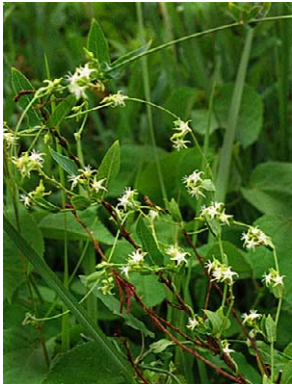
66 O. silvestris