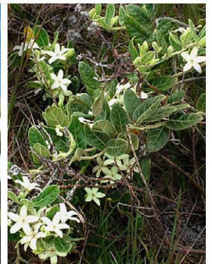
40 O. lanatum