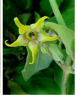
5 O. appendiculatum