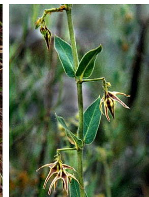
59 O. polyanthum