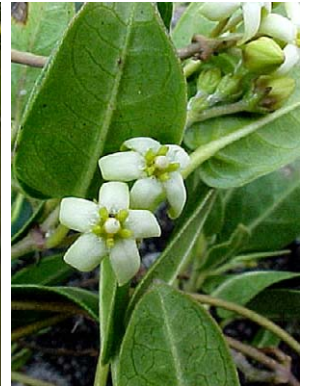
30 O. glaziovii