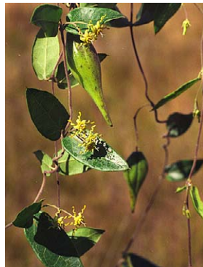
33 O. helios