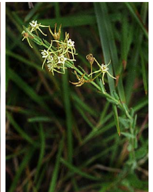
35 O. humile