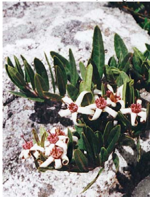
42 O. leonii