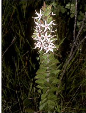
21 O. erectum

© M. A. Farinaccio [mafarinaccio@hotmail.com] &amp; R. Mello-Silva, Instituto de Biociências, Universidade de São Paulo, Brasil. Apoio da Fundação de Amparo à Pesquisa do Estado de São Paulo © Environmental &amp; Conservation Programs, The Field Museum, Chicago, IL 60605 USA. [RRC@fmnh.org] [www.fmnh.org/plantguides/] Rapid Color Guide # 212 version 1 8/2007