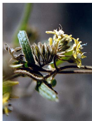
48 O. minarum