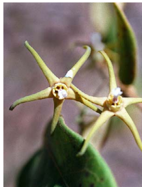
38 O. insigne