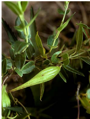
31 O. glaziovii