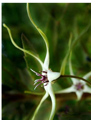
52 O. mosenii