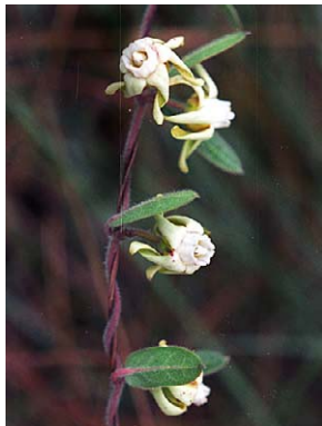
72 O. sublanatum