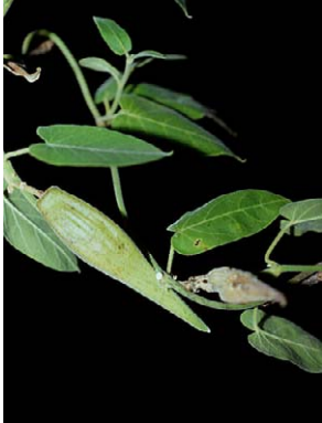
61 O. polyanthum

© M. A. Farinaccio [mfarinaccio@hotmail.com] &amp; R. Mello-Silva, Instituto de Biociências, Universidade de São Paulo, Brasil. Apoio da Fundação de Amparo à Pesquisa do Estado de São Paulo © Environmental &amp; Conservation Programs, The Field Museum, Chicago, IL 60605 USA. [RRC@fmnh.org] [www.fmnh.org/plantguides/] Rapid Color Guide # 212 version 1 8/2007