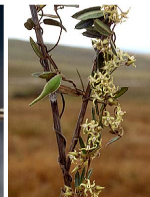
49 O. montanum