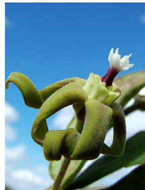
39 O. insigne