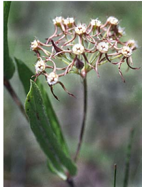
28 O. fontellae