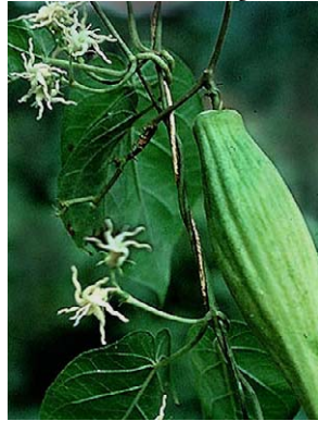
23 O. erianthum