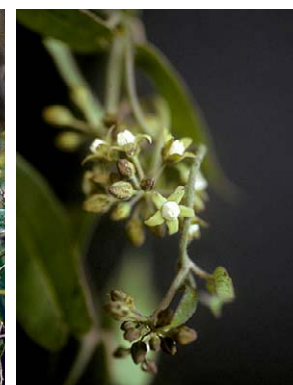
54 O. pachyglossum