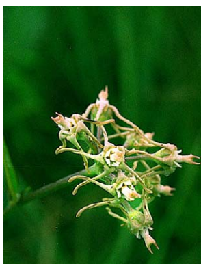
47 O. marginatum