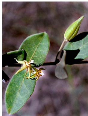
37 O. insigne