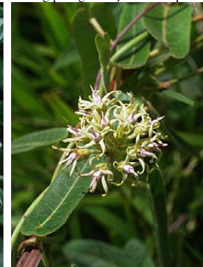
44 O. macrolepis