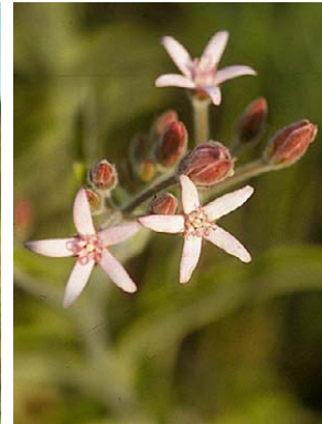
69 O. solanoides