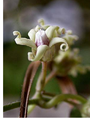
4 O. alpinum