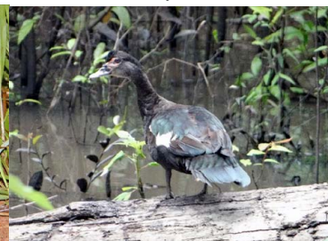
7 PATO NEGRO Cairina moschata – ANATIDAE Carne y huevos