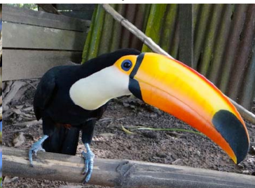
38 TUCÁN TOCO Ramphastos toco – RAMPHASTIDAE Carne y mascota