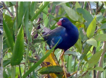
15 GALLARETA AZUL Porphyrio martinica – RALLIDAE Carne