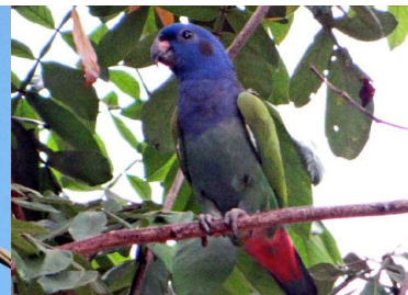
31 TUI Pionus menstruus – PSITTACIDAE Carne y mascota