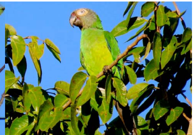
28 TARECHI CABEZA PLOMA Aratinga weddellii – PSITTACIDAE Carne y mascota