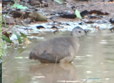
2 PERDIZ WIRIRI Crypturellus soui – TINAMIDAE Carne y huevos