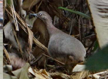
3 PERDIZ SAN JUAN Crypturellus undulatus – TINAMIDAE Carne y huevos