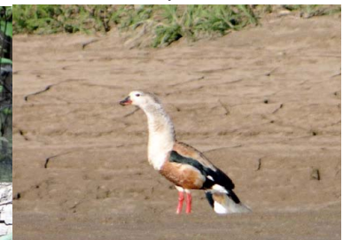
8 PATO RONCADOR Neochen jubata – ANATIDAE Carne y huevos