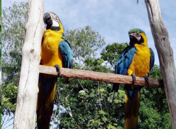
22 PARABA AMARILLA Ara ararauna – PSITTACIDAE Carne y mascota