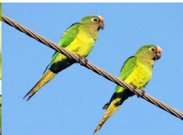
30 TARECHI PAMPEÑO Eupsittula aurea – PSITTACIDAE Carne y mascota