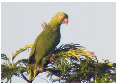
33 LORO MOLINERO Amazona farinosa – PSITTACIDAE Carne y mascota