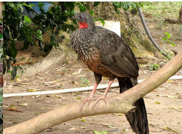
10 PAVA  Penelope jacquacu – CRACIDAE Carne y huevos, mascota