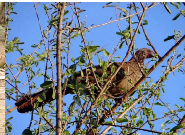
11 GUARACACHI Ortalis guttata – CRACIDAE Carne y huevos, mascota