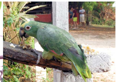
32 LORO FRENTE AMARILLA Amazona ochrocephala – PSITTACIDAE Carne y mascota