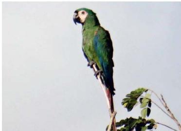
25 PARABACHI Ara severus – PSITTACIDAE Carne y mascota