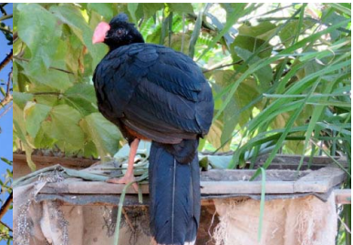
12 MUTUN Mitu tuberosum – CRACIDAE Carne y huevos, mascota