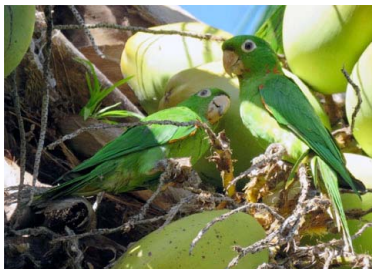
29 TARECHI OJO BLANCO Psittacara leucophthalmus – PSITTACIDAE Carne y mascota