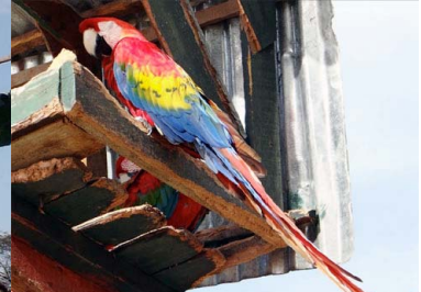
24 PARABA SIETE COLORES Ara macao – PSITTACIDAE Carne y mascota