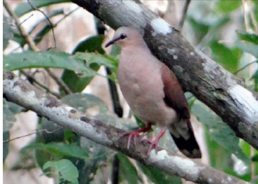
21 CUQUISA Leptotila verreauxi – COLUMBIDAE Carne