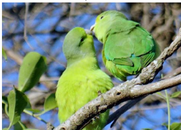
37 PERIQUITO Forpus xanthopterygius – PSITTACIDAE Mascota