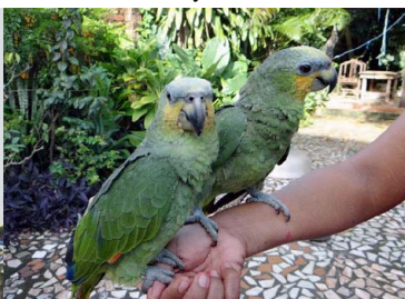
34 LORO HABLADOR Amazona amazonica – PSITTACIDAE Carne y mascota