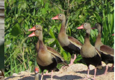
4 PUTIRÍ Dendrocygna autumnalis – ANATIDAE Carne y huevos