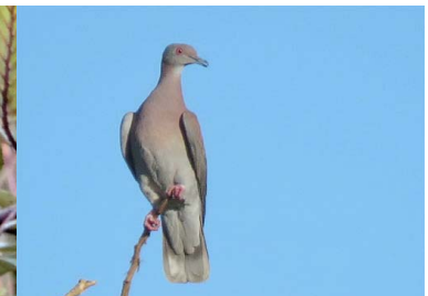
20 TORCAZA DE BAJÍO Patagioenas subvinacea – COLUMBIDAE Carne

La Ley General para la Protección de los Animales 'Juan Evo Morales Ayma' (Ley N° 700) sanciona la tenencia, manejo y tráfico ilegal, además de la violencia hacia los animales. De acuerdo a esta ley la tenencia, manejo y tráfico ilegal serán sancionados con la reclusión de 3 años y en caso de ser una especie silvestre vedada la sanción se amplía hasta 6 años, en función a su categoría de amenaza y a la cantidad de especímenes implicados.