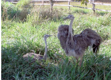
1 PIYO Rhea americana – RHEIDAE Plumas para plumeros, carne y huevos