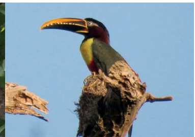
40 TUCANCILLO Pteroglossus castaneotis – RAMPHASTIDAE Carne y mascota

La Ley General para la Protección de los Animales 'Juan Evo Morales Ayma' (Ley N° 700) sanciona la tenencia, manejo y tráfico ilegal, además de la violencia hacia los animales. De acuerdo a esta ley la tenencia, manejo y tráfico ilegal serán sancionados con la reclusión de 3 años y en caso de ser una especie silvestre vedada la sanción se amplía hasta 6 años, en función a su categoría de amenaza y a la cantidad de especímenes implicados.