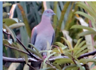
19 TORCAZA AZULADA Patagioenas cayennensis – COLUMBIDAE Carne