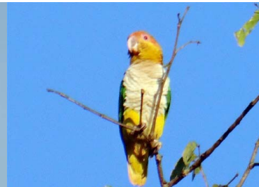
27 PACULA Pionites leucogaster – PSITTACIDAE Carne y mascota