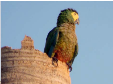
26 PARABACHI Orthopsittaca manilatus – PSITTACIDAE Carne y mascota