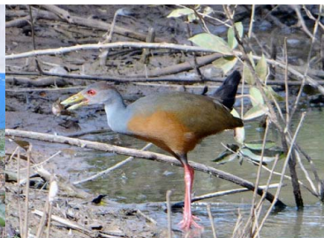
14 TARACOÉ Aramides cajanea – RALLIDAE Carne