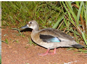
6 BICHICHI GUATOCHO Amazonetta brasiliensis – ANATIDAE Carne y huevos