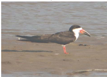
17 RAYADOR Rynchops niger – RYNCHOPIDAE Huevos