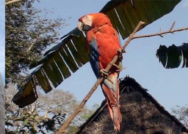
23 PARABA ROJA Ara chloropterus – PSITTACIDAE Carne y mascota