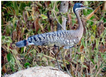
9 LIRA Eurypyga helias – EURYPYGIDAE Huesos usados en medicina natural