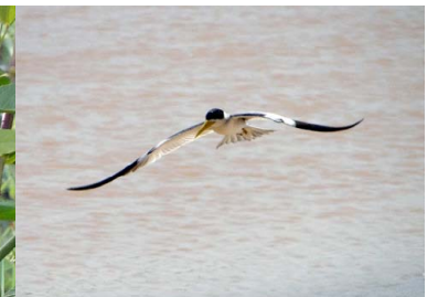
16 GAVIOTA Phaetusa simplex – LARIDAE Huevos