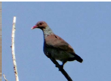
18 TORCAZA ESCAMADA Patagioenas speciosa – COLUMBIDAE Carne