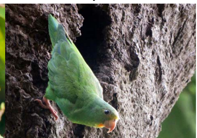
36 LORITO ALA AZUL Brotogeris cyanoptera – PSITTACIDAE Mascota