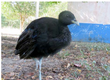
13 YACAMÍ Psophia leucoptera – PSOPHIIDAE Carne y mascota