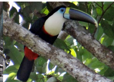
39 TUCÁN AMAZÓNICO Ramphastos tucanus – RAMPHASTIDAE Carne y mascota