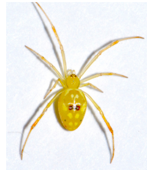
9 Araña de tela irregular Spintharus sp. THERIDIIDAE