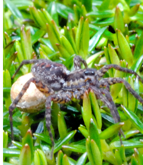
2 Araña lobo LYCOSIDAE