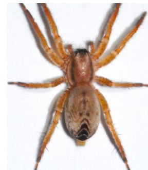
5 Araña de bolsa CLUBIONIDAE