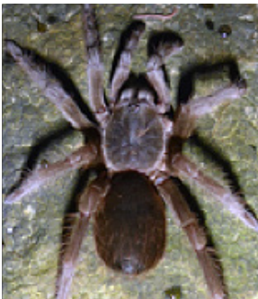
7 Tarántula MYGALOMORPHAE