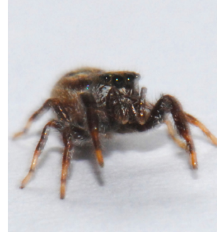
3 Araña saltarina SALTICIDAE 2 morfo-especies