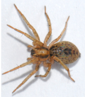
1 Araña de bolsa CLUBIONIDAE