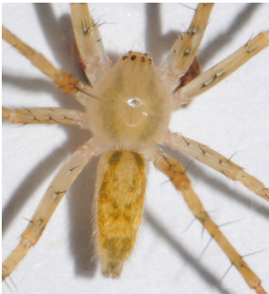
4 Araña fantasma ANYPHAENIDAE 2 morfo-species