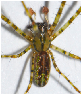
8 Araña de mandíbula larga TETRAGNATHIDAE