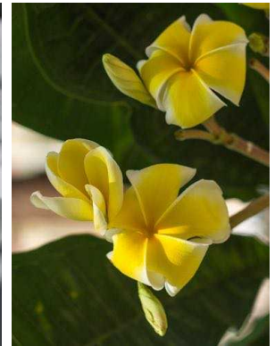
22 Plumeria rubra APOCYNACEAE