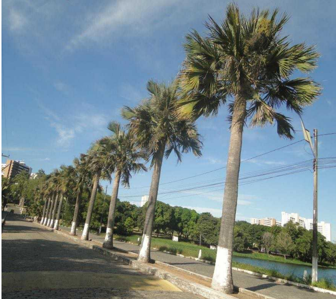
Avenida principal do Campus Main avenue of the Campus