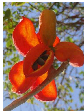
97 Sterculia striata MALVACEAE