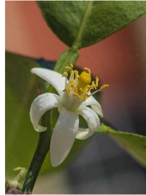
126 Citrus x limon RUTACEAE