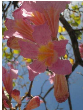
40 Handroanthus impetiginosus BIGNONIACEAE