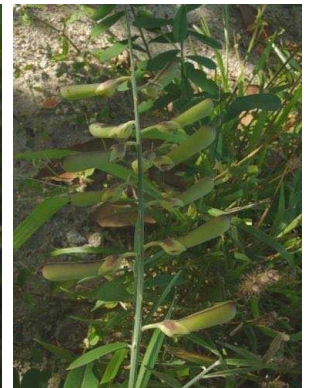
72 Crotalaria retusa FABACEAE