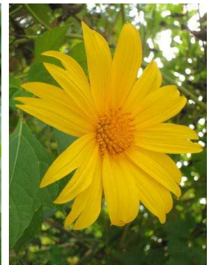
37 Tithonia diversifolia ASTERACEAE