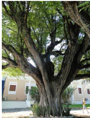
83 Tamarindus indica FABACEAE