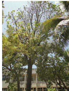
91 Ceiba pentandra MALVACEAE