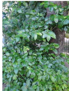
111 Piper arboreum PIPERACEAE