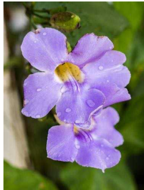
4 Thunbergia grandiflora ACANTHACEAE