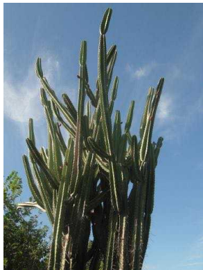
49 Cereus jamacaru CACTACEAE