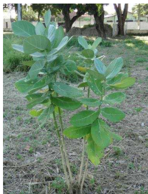
13 Calotropis procera APOCYNACEAE