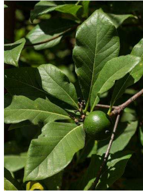
125 Tocoyena sellowiana RUBIACEAE