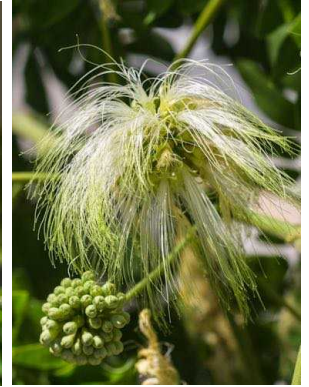
67 Albizia lebbek FABACEAE