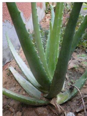
135 Aloe vera XANTHORRHOEACEAE