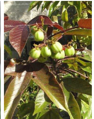
62 Jatropha gossypifolia EUPHORBIACEAE