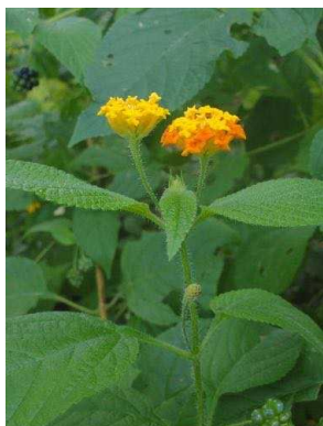
133 Lantana camara VERBENACEAE