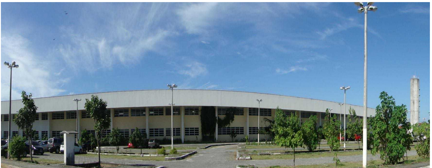
Vista do Instituto de Cultura e Arte (ICA) da UFC View of the Institute of Culture and Art (ICA) of UFC