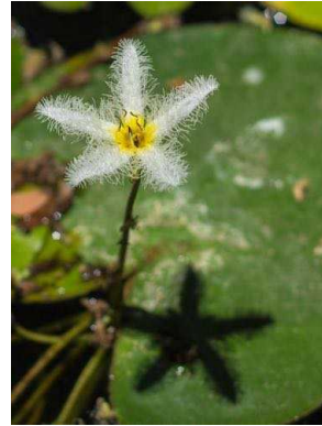
106 Nymphoides humboldtiana MENYANTHACEAE