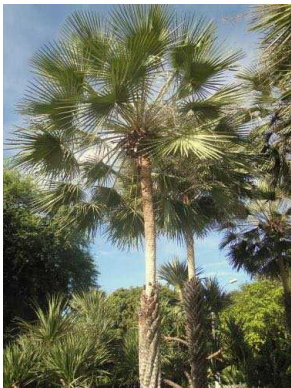
28 Copernicia prunifera ARECACEAE