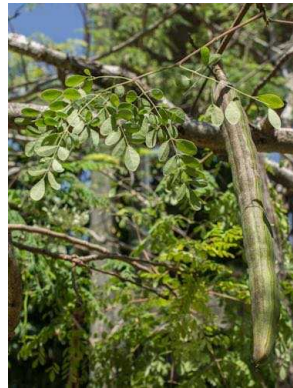
100 Moringa oleifera MORINGACEAE