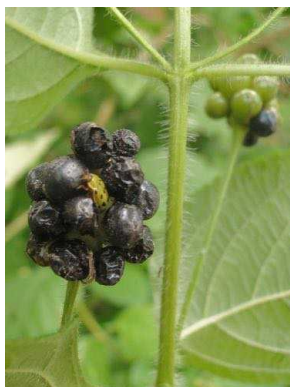
134 Lantana camara VERBENACEAE