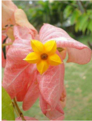
123 Mussaenda erythrophylla RUBIACEAE