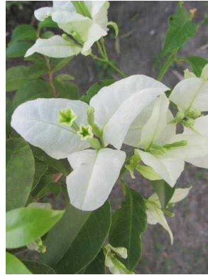
105 Bougainvillea spectabilis NYCTAGINACEAE