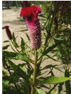
6 Celosia argentea AMARANTHACEAE