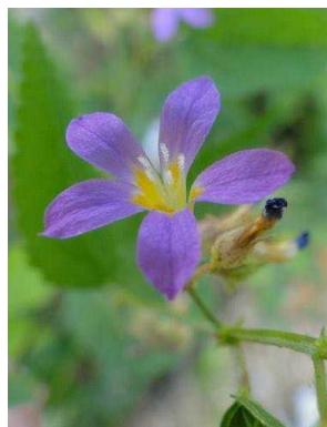
94 Melochia pyramidata MALVACEAE