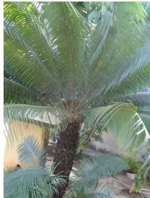
59 Cycas sp. CYCADACEAE