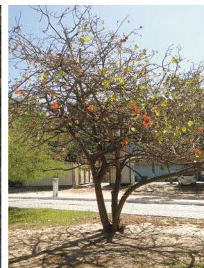
76 Erythrina velutina FABACEAE