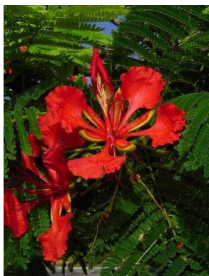
73 Delonix regia FABACEAE