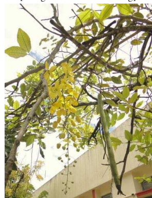
81 Cassia fistula FABACEAE