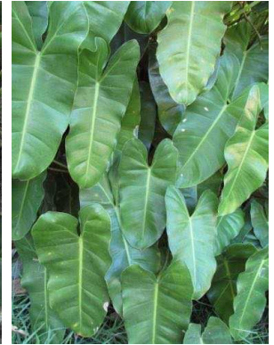
27 Philodendron imbe ARACEAE