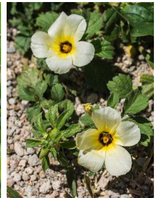
132 Turnera subulata TURNERACEAE