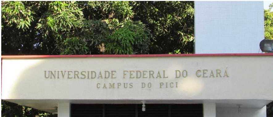
Fachada do Campus do Pici Prof. Prisco Bezerra (UFC) Entrance of the Pici Prof. Prisco Bezerra Campus (UFC)