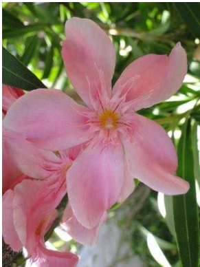
18 Nerium oleander APOCYNACEAE