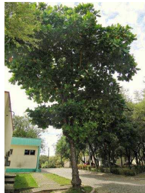
51 Terminalia catappa COMBRETACEAE