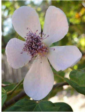
44 Bixa orellana BIXACEAE