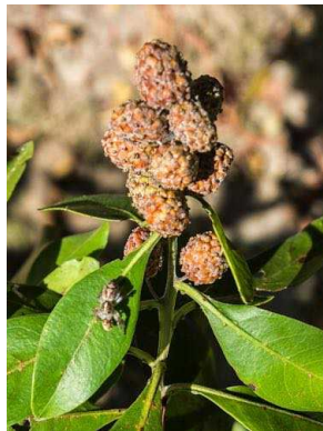
50 Conocarpus erectus COMBRETACEAE