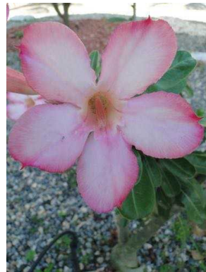
11 Adenium obesum APOCYNACEAE