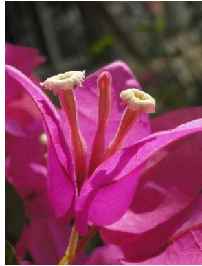
104 Bougainvillea spectabilis NYCTAGINACEAE