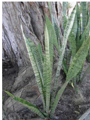
34 Sansevieria trifasciata ASPARAGACEAE