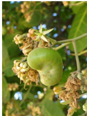
9 Anacardium occidentale ANACARDIACEAE