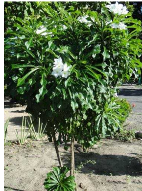
20 Plumeria pudica APOCYNACEAE