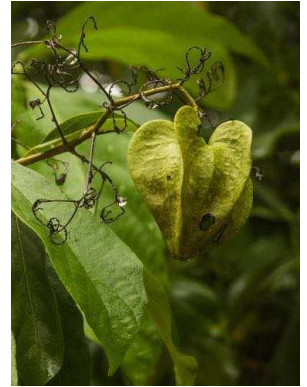
47 Cordia oncocalyx BORAGINACEAE