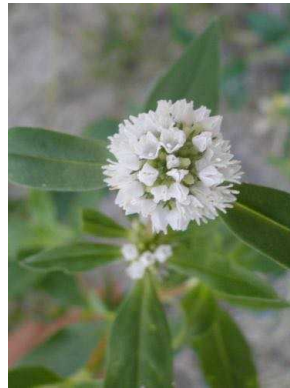
120 Spermacoce verticillata RUBIACEAE