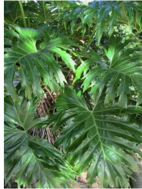
25 Philodendron bipinnatifidum ARACEAE