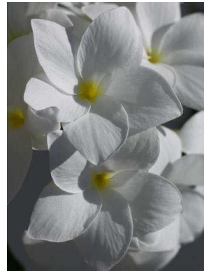
21 Plumeria pudica APOCYNACEAE