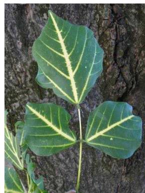
75 Erythrina variegata FABACEAE