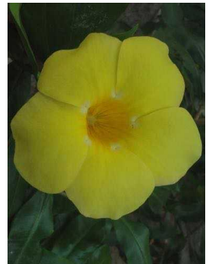
12 Allamanda cathartica APOCYNACEAE