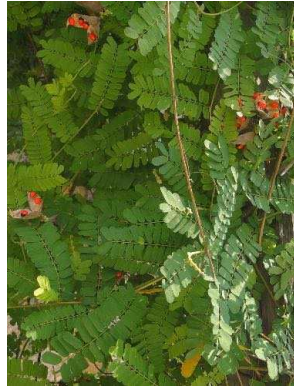
64 Abrus precatorius FABACEAE