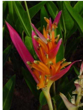
87 Heliconia psittacorum HELICONIACEAE