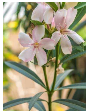
17 Nerium oleander APOCYNACEAE