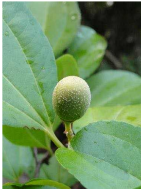
119 Ziziphus joazeiro RHAMNACEAE