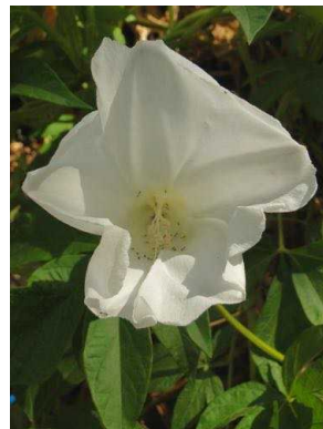
56 Operculina macrocarpa CONVOLVULACEAE