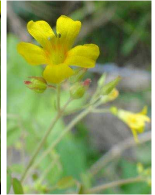
107 Oxalis divaricata OXALIDACEAE