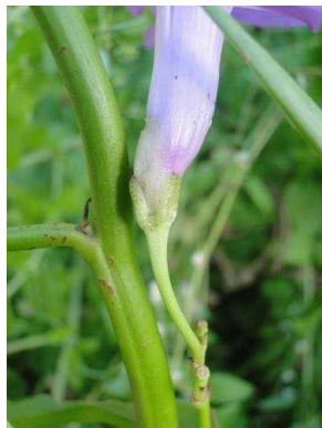
55 Ipomoea asarifolia CONVOLVULACEAE