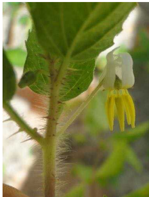
128 Solanum fernandesii SOLANACEAE