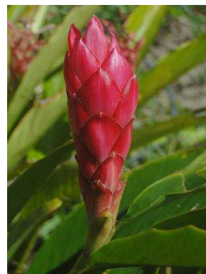
136 Alpinia purpurata ZINGIBERACEAE