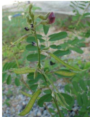
84 Tephrosia purpurea FABACEAE