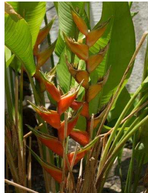
86 Heliconia bihai HELICONIACEAE