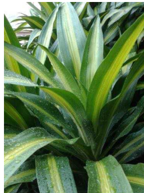
30 Dracaena fragrans ASPARAGACEAE