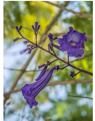
42 Jacaranda brasiliana BIGNONIACEAE