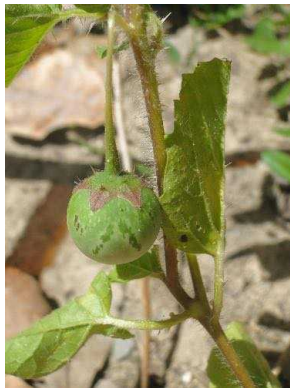
129 Solanum fernandesii SOLANACEAE