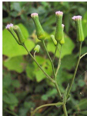
35 Emilia sp. ASTERACEAE