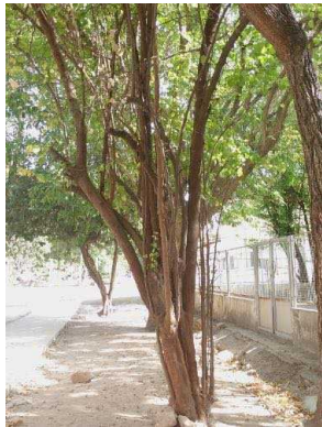
118 Ziziphus joazeiro RHAMNACEAE