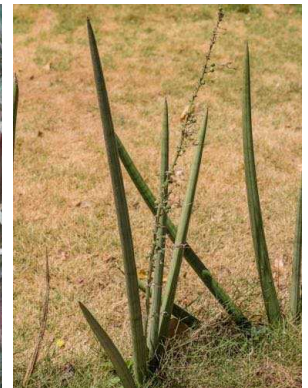
32 Sansevieria cylindrica ASPARAGACEAE