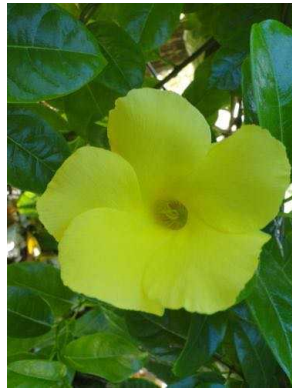
19 Pentalinon luteum APOCYNACEAE