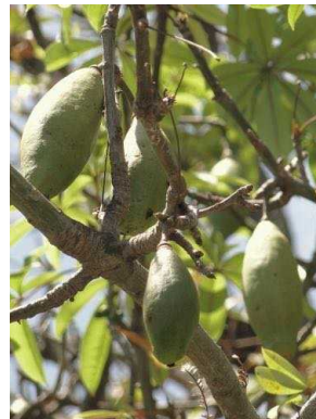
92 Ceiba pentandra MALVACEAE