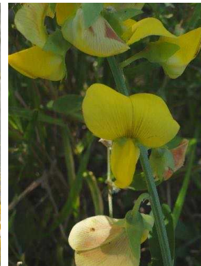
71 Crotalaria retusa FABACEAE