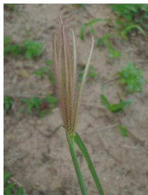
114 Chloris sp. POACEAE