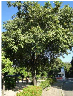
8 Anacardium occidentale ANACARDIACEAE