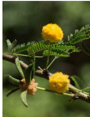
85 Vachellia farnesiana FABACEAE