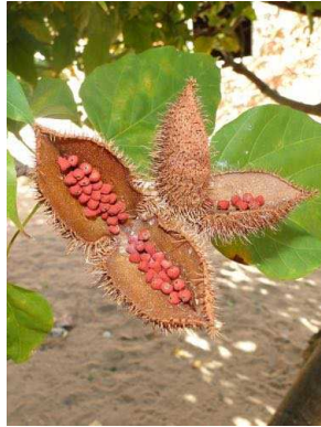
45 Bixa orellana BIXACEAE