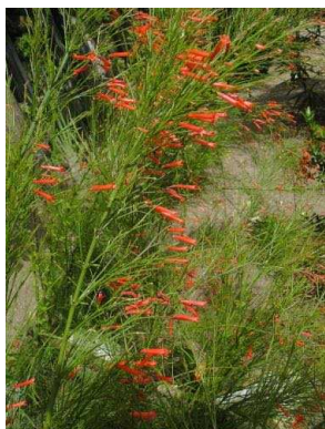
113 Russelia equisetiformis PLANTAGINACEAE