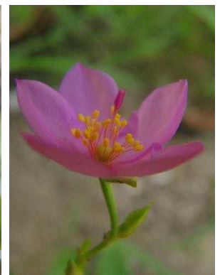
117 Talinum sp. PORTULACEAE