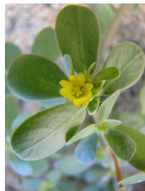
116 Portulaca oleracea PORTULACEAE