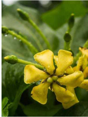
124 Tocoyena sellowiana RUBIACEAE