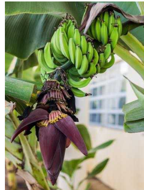
101 Musa paradisiaca MUSACEAE