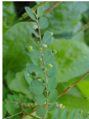
110 Phyllanthus tenellus PHYLLANTHACEAE