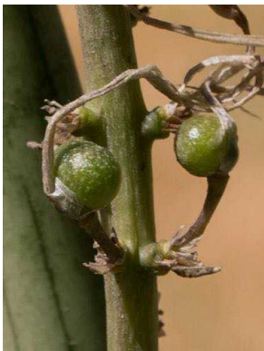
33 Sansevieria cylindrica ASPARAGACEAE