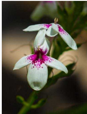
3 Pseuderanthemum carruthersii ACANTHACEAE