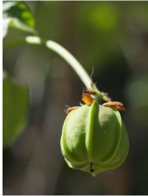
63 Jatropha mollissima EUPHORBIACEAE