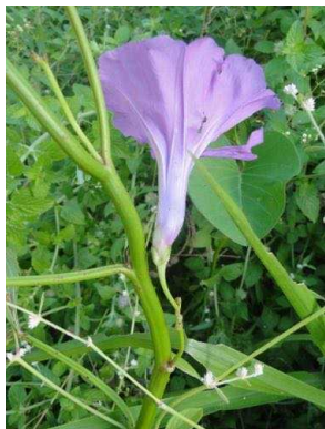
54 Ipomoea asarifolia CONVOLVULACEAE