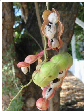
80 Pithecellobium dulce FABACEAE