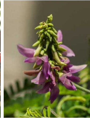
66 Abrus precatorius FABACEAE