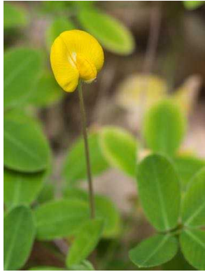
68 Arachis sp. FABACEAE