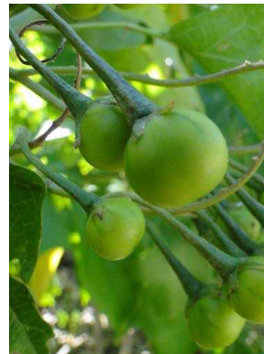
131 Solanum paniculatum SOLANACEAE