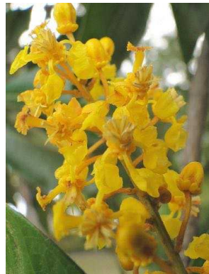
90 Byrsonima sp. MALPIGHIACEAE