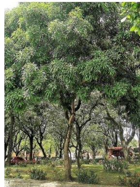
10 Mangifera indica ANACARDIACEAE