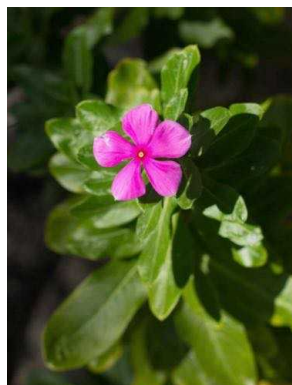
14 Catharanthus roseus APOCYNACEAE