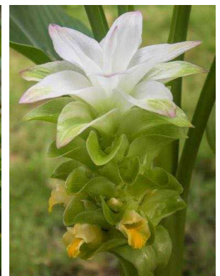
137 Curcuma alismatifolia ZINGIBERACEAE