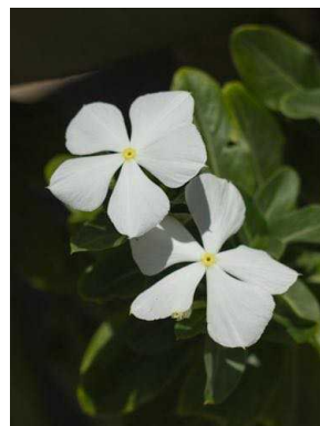
15 Catharanthus roseus APOCYNACEAE