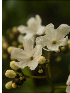
46 Cordia oncocalyx BORAGINACEAE