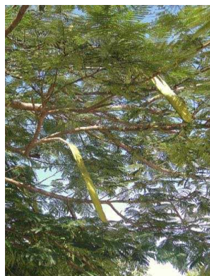
74 Delonix regia FABACEAE