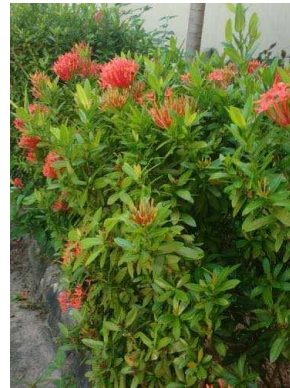
121 Ixora coccinea RUBIACEAE