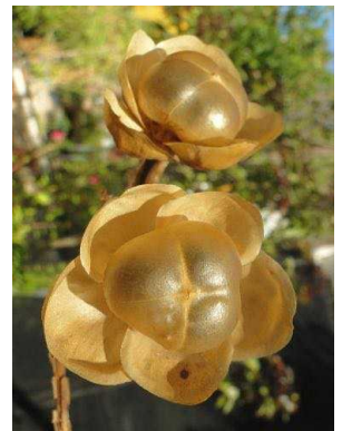
57 Operculina macrocarpa CONVOLVULACEAE