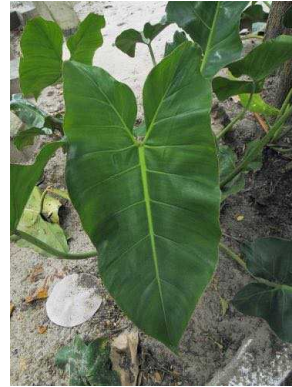
26 Philodendron cordatum ARACEAE