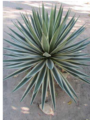
5 Agave angustifolia AGAVACEAE