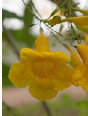
43 Tecoma stans BIGNONIACEAE