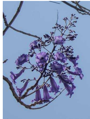
41 Jacaranda brasiliana BIGNONIACEAE