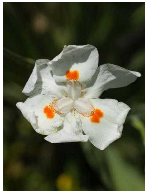
88 Dietes sp. IRIDACEAE