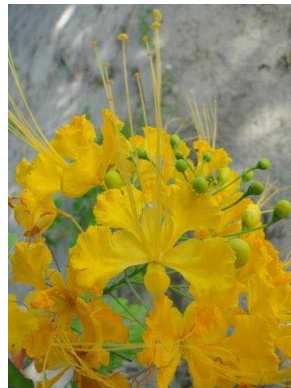
70 Caesalpinia pulcherrima FABACEAE