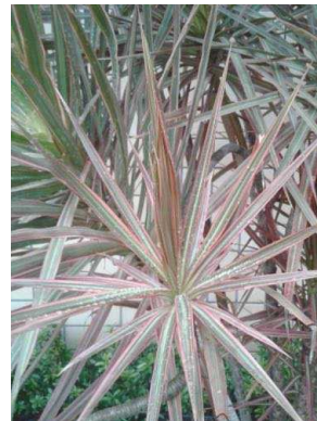
31 Dracaena marginata ASPARAGACEAE