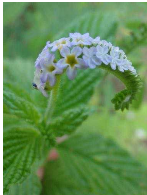
48 Heliotropium indicum BORAGINACEAE