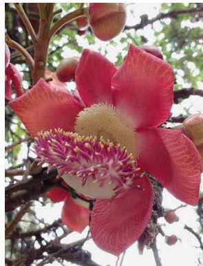
89 Couroupita guianensis LECYTHIDACEAE