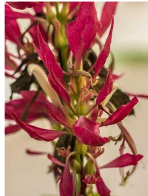
1 Megaskepasma erythrochlamys ACANTHACEAE