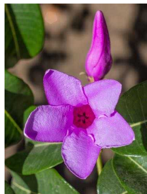
16 Cryptostegia sp. APOCYNACEAE