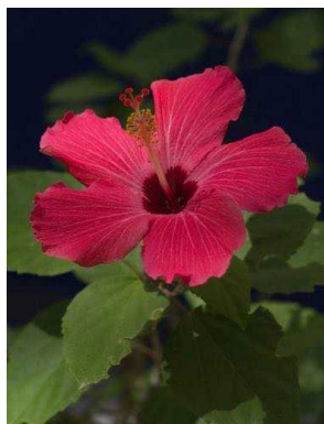
93 Hibiscus rosa-sinensis MALVACEAE