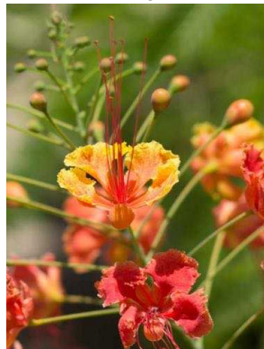
69 Caesalpinia pulcherrima FABACEAE