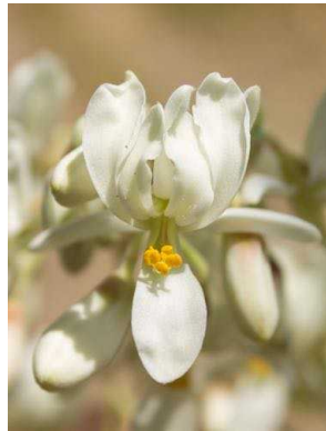
99 Moringa oleifera MORINGACEAE