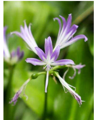
7 Griffinia paubrasilica AMARYLLIDACEAE