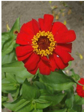
38 Zinnia peruviana ASTERACEAE