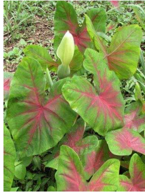
24 Caladium bicolor ARACEAE