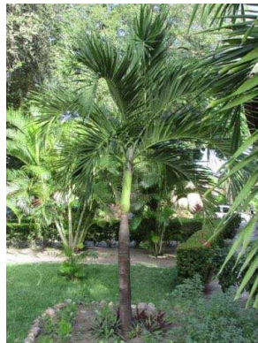
29 Adonidia merrillii ARECACEAE