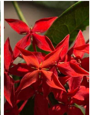
122 Ixora coccinea RUBIACEAE