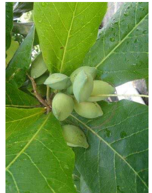
52 Terminalia catappa COMBRETACEAE