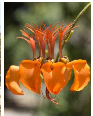
77 Erythrina velutina FABACEAE