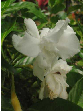
23 Tabernaemontana divaricata APOCYNACEAE