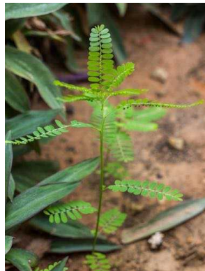
109 Phyllanthus amarus PHYLLANTHACEAE