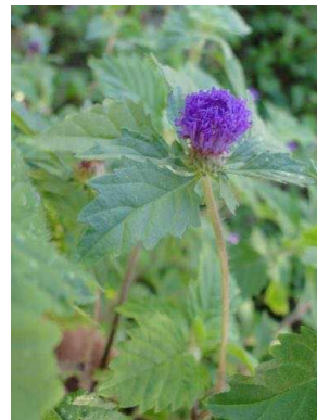
36 Centratherum punctatum ASTERACEAE