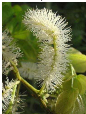
78 Mimosa caesalpinifolia FABACEAE