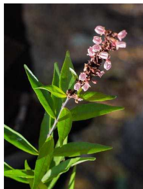
115 Asemeia violacea POLYGALACEAE