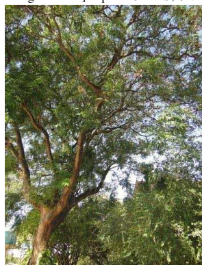
79 Pithecellobium dulce FABACEAE