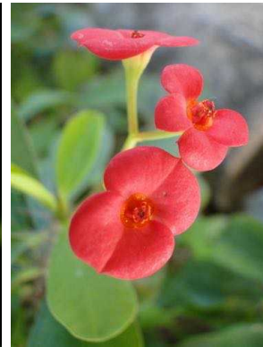
61 Euphorbia milii var. hislopii EUPHORBIACEAE