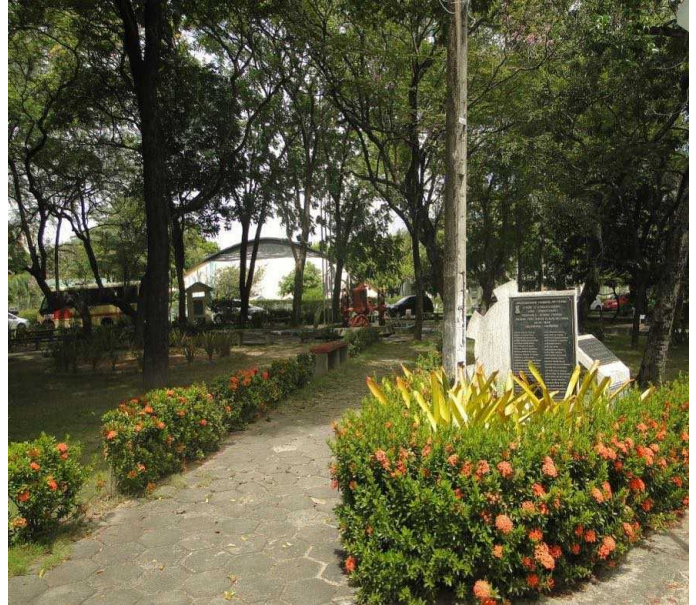
Praça do trator, Centro de Ciências Agrárias (UFC) Tractor Square, Agricultural Sciences Center (UFC)