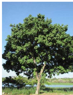
95 Pachira aquatica MALVACEAE