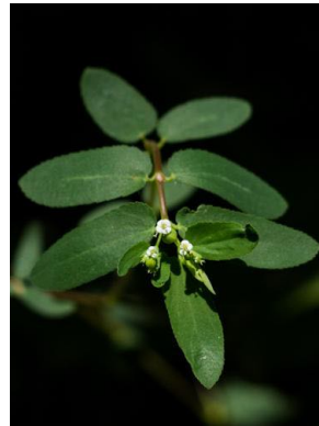
60 Euphorbia hyssopifolia EUPHORBIACEAE