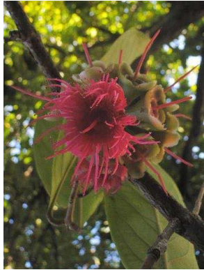
103 Syzygium malaccense MYRTACEAE