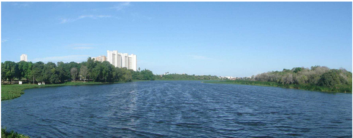
Vista do açude Santo Anastácio View of the Santo Anastácio reservoir