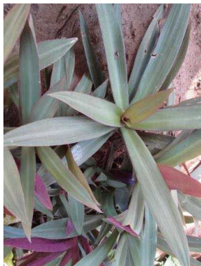
53 Tradescantia spathacea COMMELINACEAE