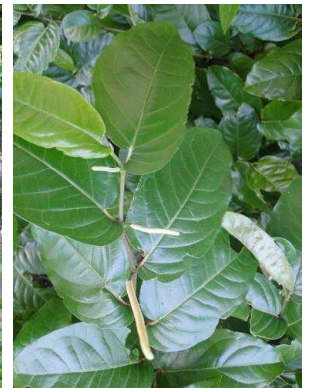
112 Piper arboreum PIPERACEAE