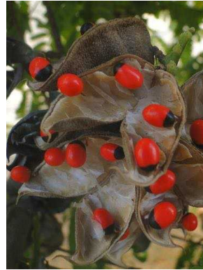
65 Abrus precatorius FABACEAE