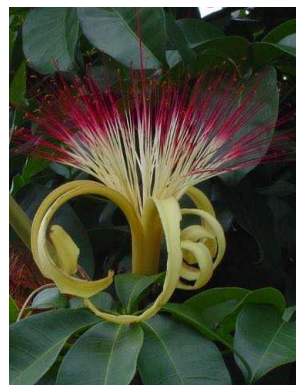
96 Pachira aquatica MALVACEAE