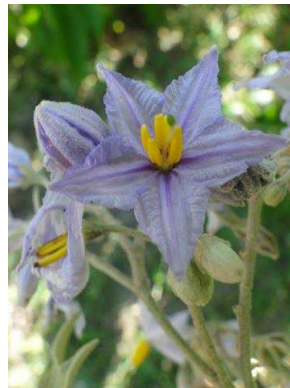
130 Solanum paniculatum SOLANACEAE