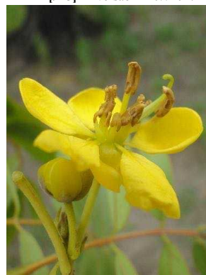
82 Cassia fistula FABACEAE