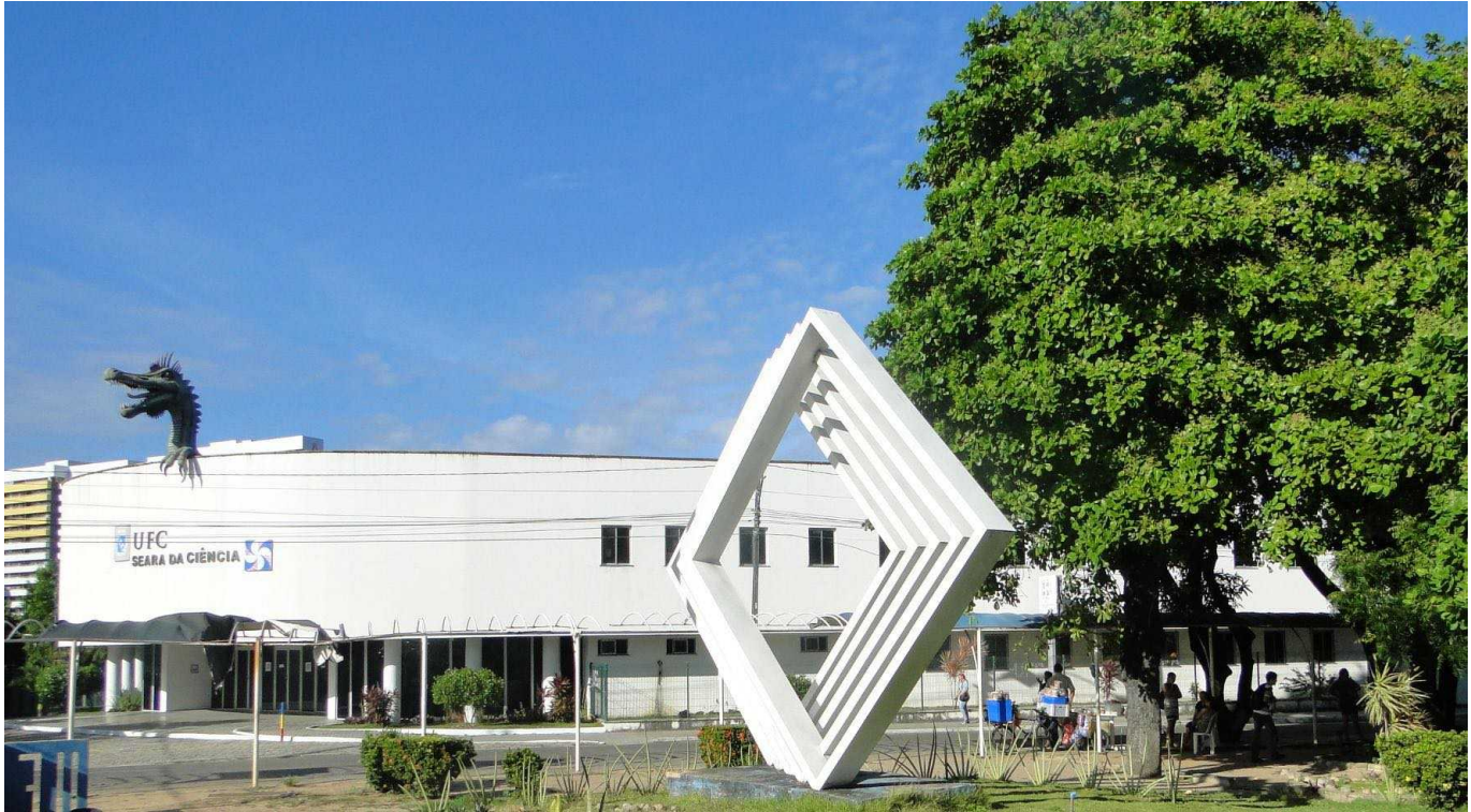
Entrada principal do Campus do Pici Prof. Prisco Bezerra (UFC) em Fortaleza, CE Main gateway to the Prof. Prisco Bezerra Campus (UFC) in Fortaleza, CE