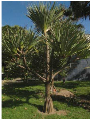
108 Pandanus sp. PANDANACEAE