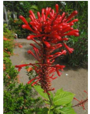
2 Odontonema tubaeforme ACANTHACEAE