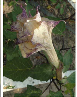
127 Datura metel SOLANACEAE