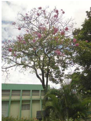
39 Handroanthus impetiginosus BIGNONIACEAE