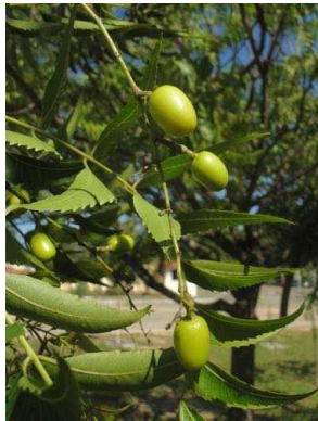
98 Azadirachta indica MELIACEAE