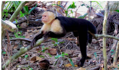
5 Cebus capucinus CEBIDAE