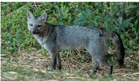
13 Cerdocyon thous CANIDAE