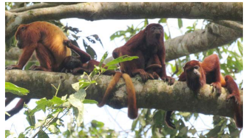
6 Alouatta seniculus ATELIDAE (foto JA)