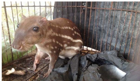
10 Cuniculus paca CUNICULIDAE