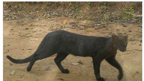
12 Herpailurus yagouaroundi FELIDAE