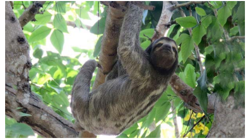
3 Bradypus variegatus BRADYPODIDAE (foto JA)