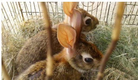
11 Sylvilagus floridanus LEPORIDAE