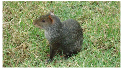
9 Dasyprocta punctata DASYPROCTIDAE