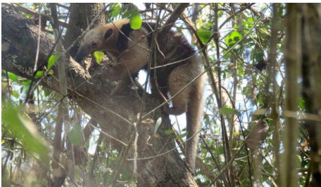
4 Tamandua mexicana MYRMECOPHAGIDAE