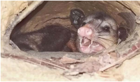
1 Didelphis marsupialis DIDELPHIDAE (foto FFS)

Fotos: Jorge Alcalá (JA), Camilo Botero (CB), José F. González-Maya (JGM), ProCAT Colombia/Internacional (PCI) y Fundación Fauna Silvestre (FFS). © Jardín Botánico de Cartagena “Guillermo Piñeres” & Fundación Fauna Silvestre [direccion@jbgp.org.co] [fieldguides.fieldmuseum.org] [1105] versión 1 3/2019