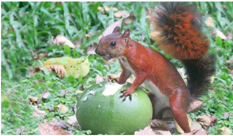
7 Notosciurus granatensis SCIURIDAE