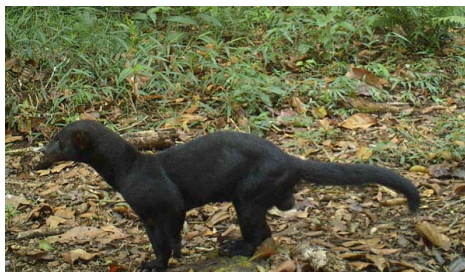
14 Eira barbara MUSTELIDAE