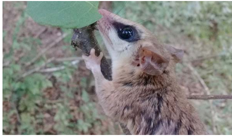
2 Marmosa robinsoni DIDELPHIDAE