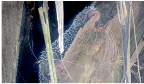
8 Coendou prehensilis ERETHIZONTIDAE (foto JA)