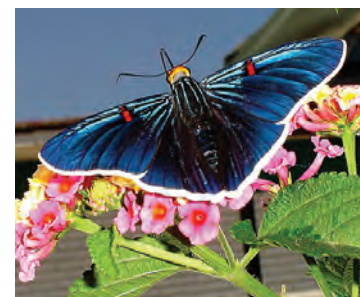
4 Phocides polybius lilea (Reakirt, 1867)