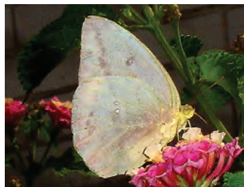
14 Phoebis agarithe (Boisduval, 1836) Pieridae