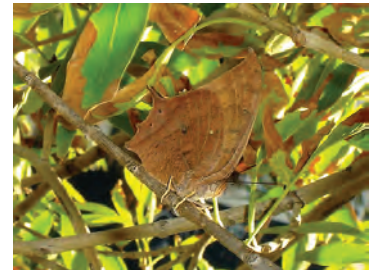
6 Anaea aidea (Guérin-Ménéville, 1844) Nymphalidae