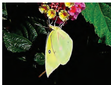
16 Zerene cesonia cesonia (Stoll, 1790) Pieridae