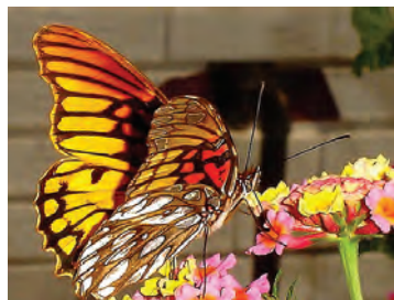
8 Dione moneta poeyii (A. Butler, 1873) Nymphalidae