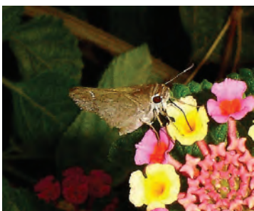
3 Lerema liris (Evans, 1955)