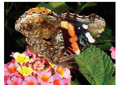
10 Vanessa atalanta rubria (Fruhstorfer, 1909) Nymphalidae