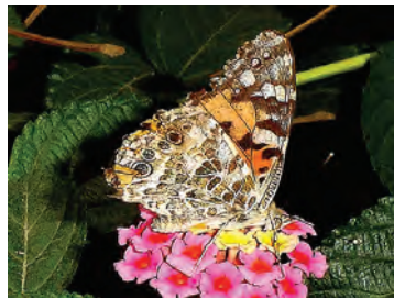
11 Vanessa cardui (Linnaeus, 1758) Nymphalidae