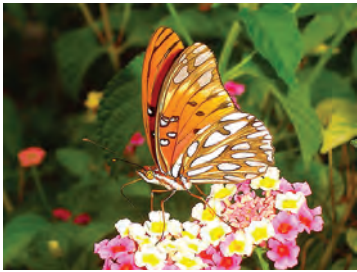
5 Agraulis vanillae incarnata (N. Riley, 1926) Nymphalidae

[fieldguides.fieldmuseum.org] [1167] version 1 6/2019