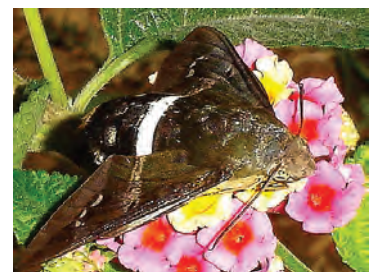
17 Aellopos clavipes (Rothschild & Jordan, 1903) Sphingidae