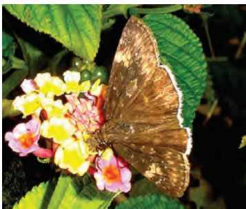
1 Erynnis funeralis (Scudder&Burgess,1870)

The objective of this illustrated guide is to provide information about the diversity of butterflies that can be seen in the urban gardens of this area. Supporting butterflies and other pollinators is one of the ecological benefits that green areas have in large cities.