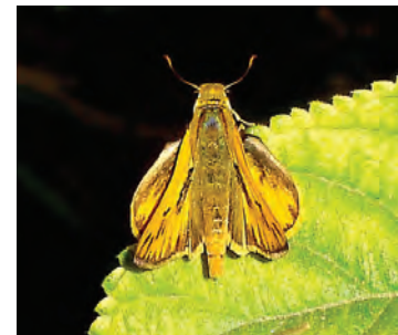
2 Hylephila phyleus phyleus (Drury, 1773)