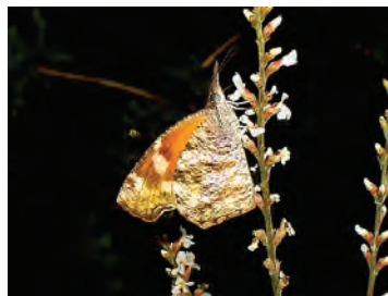
9 Libytheana carinenta mexicana (Michener, 1943) Nymphalidae