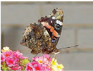
10 Vanessa atalanta rubria (Fruhstorfer, 1909) Nymphalidae