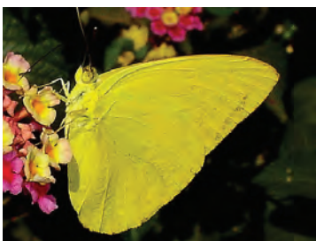
15 Phoebis sennae marcellina (Cramer, 1777) Pieridae