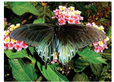
12 Battus philenor philenor (Linnaeus, 1771) Papilionidae