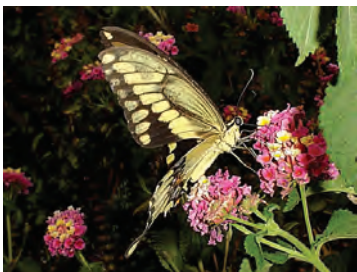
13 Heraclides rumiko (Shiraiwa & Grishin, 2014) Papilionidae