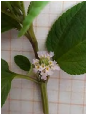
6 Lippia alba (Mill.) N.E. Br ex P. Wilson