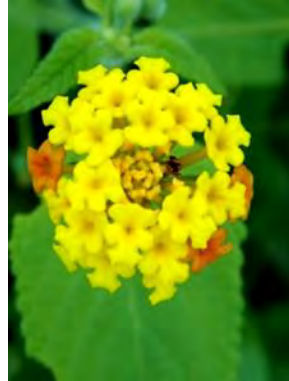
2 Lantana camara L.