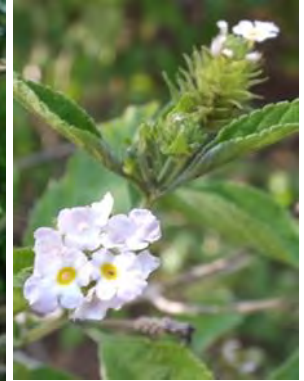
5 Lantana radula Sw.