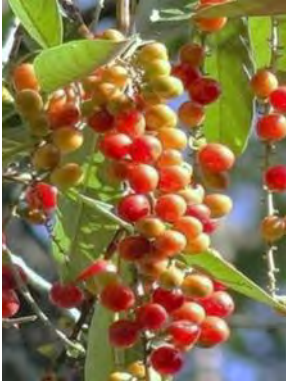
1 Citharexylum myrianthum Cham.

[fieldguides.fieldmuseum.org] [1175] versão 1 12/2019