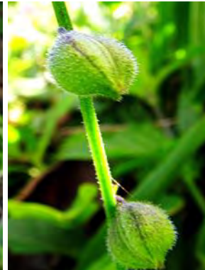
9 Priva bahiensis A.DC.