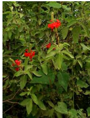
12 Stachytarpheta coccinea Schauer