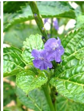
14 Stachytarpheta maximiliani Schauer