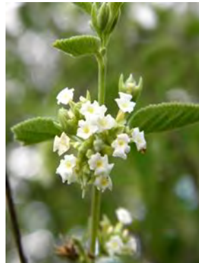
7 Lippia grata Schauer