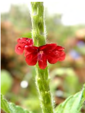
16 Stachytarpheta microphylla Walpers