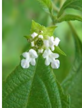
3 Lantana canescens Kunth.