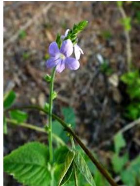
8 Priva bahiensis A.DC