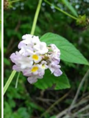
4 Lantana fucata Lindl.