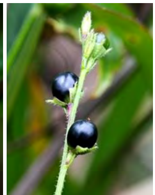
20 Tamonea spicata Aubl.