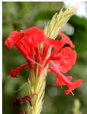
13 Stachytarpheta coccinea Schauer