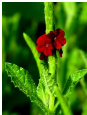
18 Stachytarpheta sessilis Moldenke