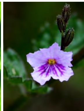
19 Tamonea spicata Aubl.