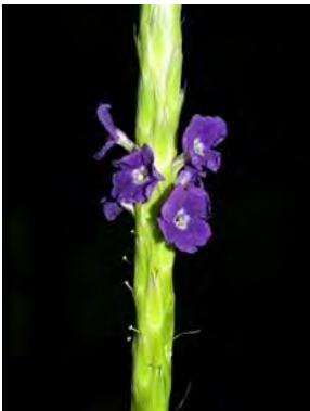
11 Stachytarpheta angustifolia (Mill.) Vahl