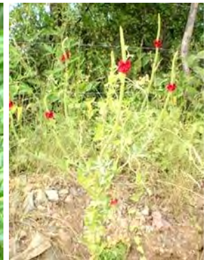
15 Stachytarpheta microphylla Walpers