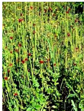
17 Stachytarpheta sessilis Moldenke