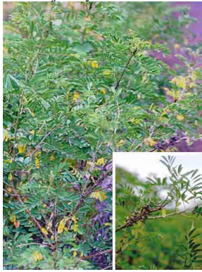
21 Añil FABACEAE Indigofera suffruticosa

Producido por: L. Grijalva, R. B. Foster, M. Giblin, con el apoyo del Mellon Foundation y E. Hyndman. [RRC@fmnh.org] Rapid Color Guide #135 version 1.2