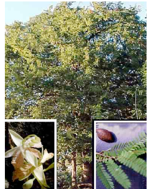
15 Tamarindo CAESALPINIACEAE Tamarindus indica