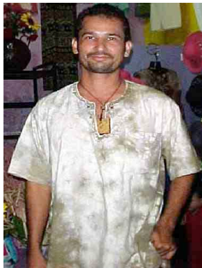
38 Camisa artesanal