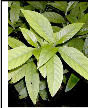
1Color Celeste ACANTHACEAE Justicia tinctoria

Producido por: L. Grijalva, R. B. Foster, M. Giblin, con el apoyo del Mellon Foundation y E. Hyndman. [RRC@fmnh.org] Rapid Color Guide #135 version 1.2