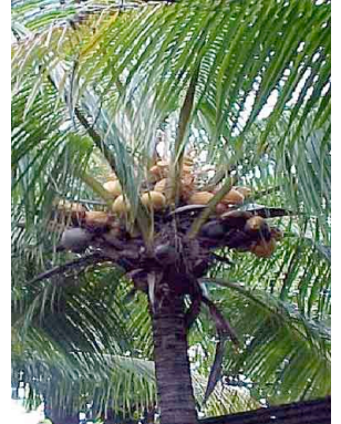
5 Coco ARECACEAE Cocos nucifera