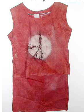
19 Vestido con tinte de Brasil