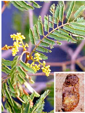
13 Nacascolo CAESALPINIACEAE Caesalpinia coriaria