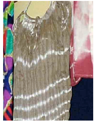
10 Camisa con coco amarillo