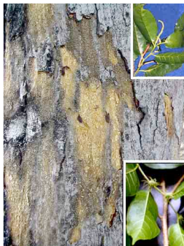
2 Color amarillo MORACEAE Maclura tinctoria