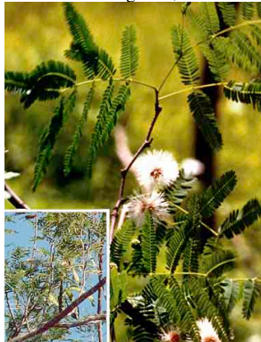
22 Quebracho FABACEAE Lysiloma sp.