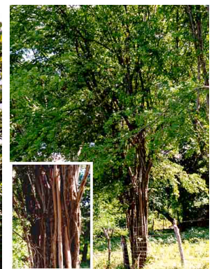
5 Brasil CAESALPINIACEAE Haematoxylon brasiletto