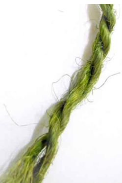
3 Color verde Mecate Resultado de combinacion