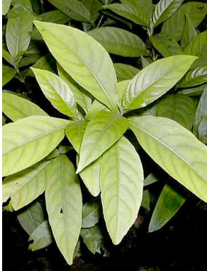
2 Sacatinta ACANTHACEAE Justicia tinctoria