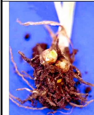
2Color amarillo ZINGIBERACEAE Curcuma longa