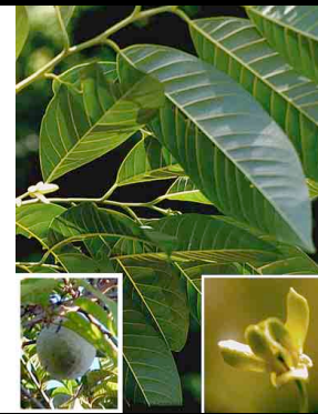
3Color negro ANNONACEAE Annona reticulata