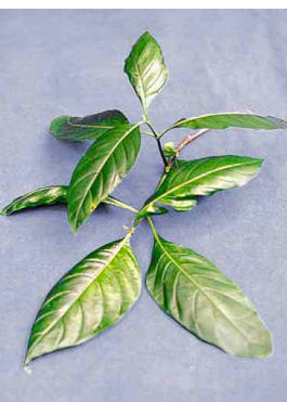
1 Color celeste ACANTHACEAE Justicia spicigera