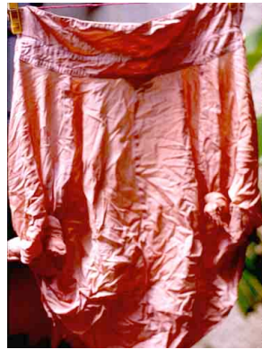
9 Camisa con coco verde