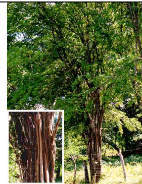
4Color rojo CAESALPINIACEAE Haematoxylon brasiletto