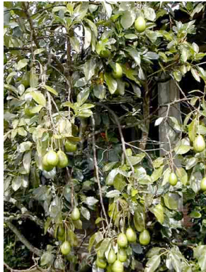
23 Aguacate LAURACEAE Persea americana