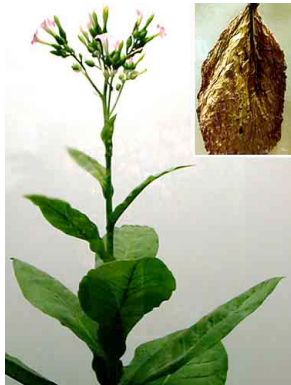
33 Tabaco SOLANACEAE Nicotiana tabacum