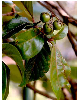
35 Nancite MALPIGHIACEAE Byrsonima crassifolia