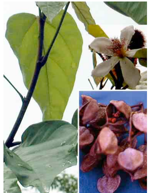
11 Achiote BIXACEAE Bixa orellana