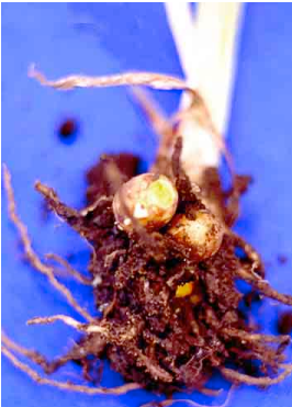
2 Curcuma ZINGIBERACEAE Curcuma longa