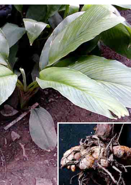
2 Color amarillo ZINGIBERACEAE Curcuma longa