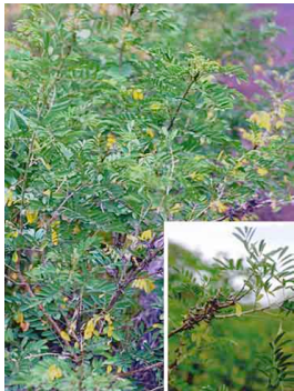
1 Color azul FABACEAE Indigofera suffruticosa