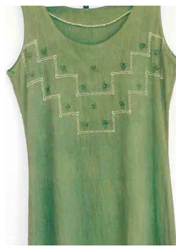
3 Color verde Vestido Resultado de combinacion