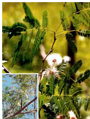
2 Quebracho FABACEAE Lysiloma sp.