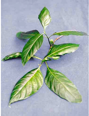
1 Sacatinta ACANTHACEAE Justicia spicigera

Producido por: L. Grijalva, R. B. Foster, M. Giblin, con el apoyo del Mellon Foundation y E. Hyndman. [RRC@fmnh.org] Rapid Color Guide #135 version 1.2