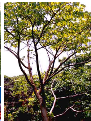
4 Indio desnudo BURSERACEAE Bursaria simaruba