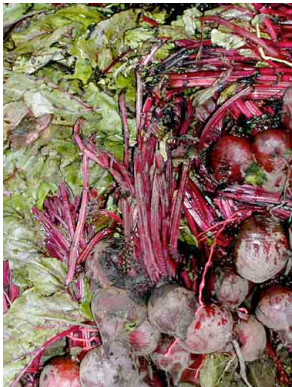
12 Remolacha CHENOPODIACEAE Beta vulgaris