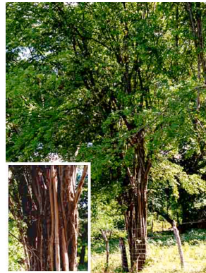
14 Brasil CAESALPINIACEAE Haematoxylon brasiletto