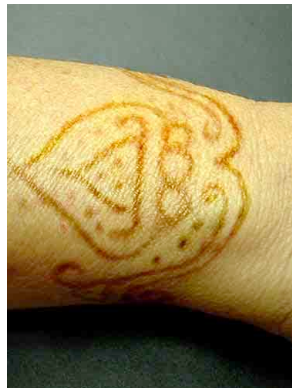
29 Dibujo en la piel