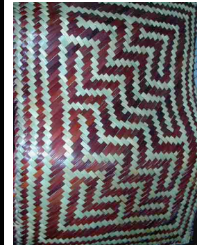
1 Petate teñido con Brasil