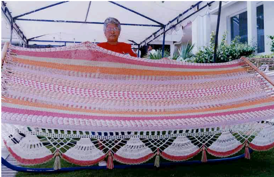
Cinco diferentes plantas productoras de tanino fueron utilizadas para dar color a esta hamaca hecha a mano. Five different plants were used as dyes to create the color range of this hand-woven hammock.

Producido por: L. Grijalva, R. B. Foster, M. Giblin, con el apoyo del Mellon Foundation y E. Hyndman. [RRC@fmnh.org] Rapid Color Guide #135 version 1.2