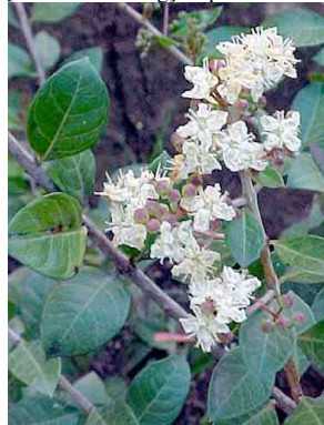
24 Reseda LYTHRACEAE Lawsonia inermis