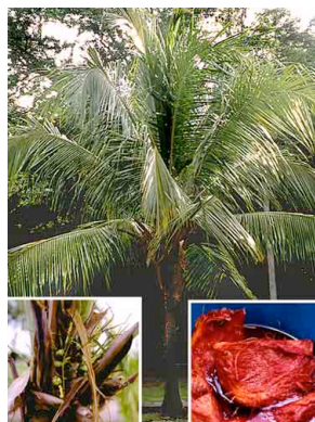
3 Coco ARECACEAE Cocos nucifera