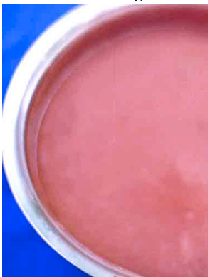
17 Cebada bebida tipica