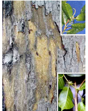
25 Mora MORACEAE Maclura tinctoria