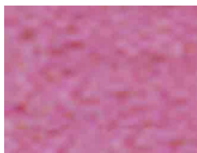
Rosado Light Pink