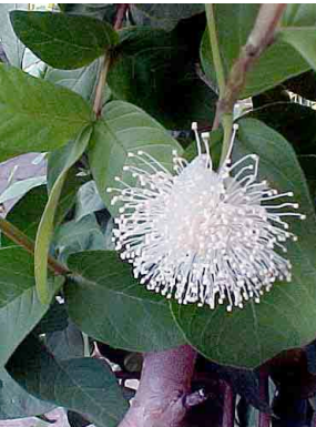
31 Guayaba MYRTACEAE Psidium guajava