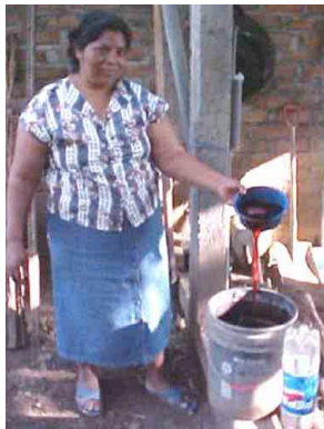
37 Artesana extrayendo el colorante natural