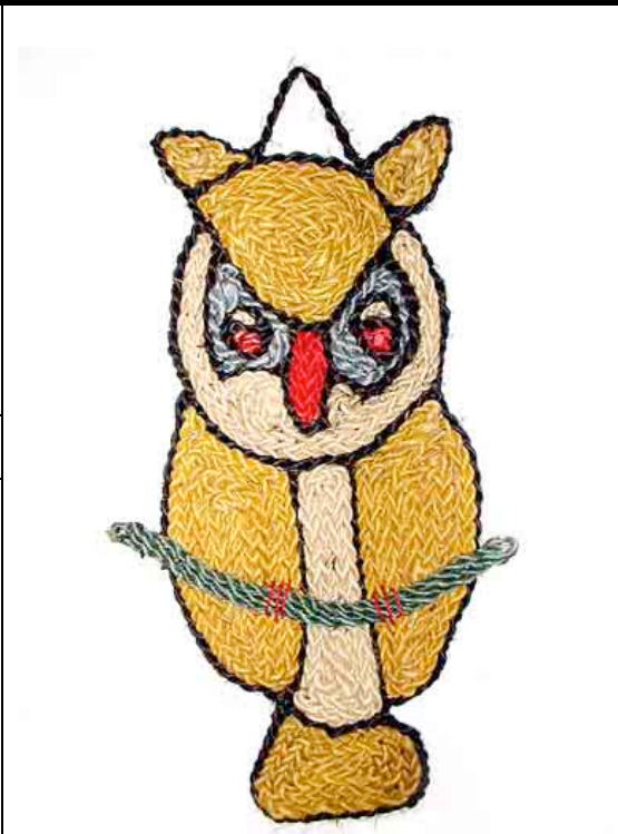
Tapiz de Buho: elaborado con fibra natural y teñido con cuatro diferentes especies plantas tintoreas