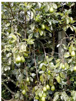
1 Aguacate LAURACEAE Persea americana