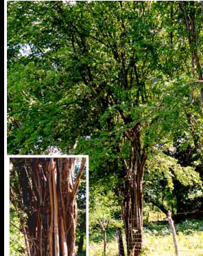
2 Brasil CAESALPINIACEAE Haematoxylon brasiletto