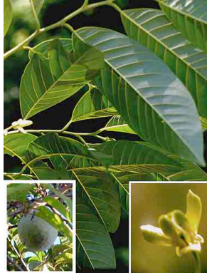
3 Anona ANNONACEAE Annona reticulata