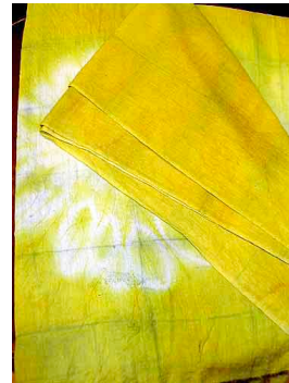
1 Tela Teñida con Curcuma