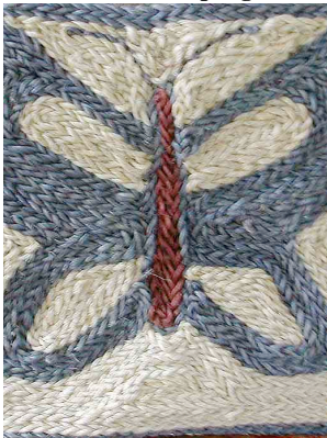
6 Mariposa de petate teñida con Sacatinta