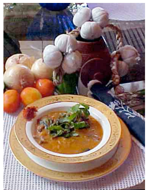
16 Indio Viejo comida tipica