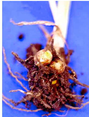
34 Curcuma ZINGIBERACEAE Curcuma longa