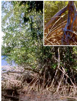
32 Mangle RHIZOPHORACEAE Rhizophora mangle