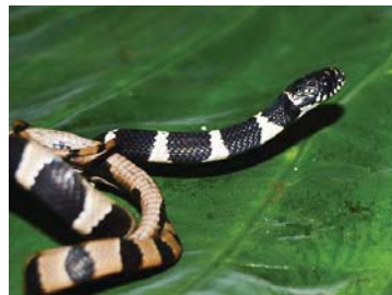
70 Dipsas pavonina COLUBRIDAE – DIPSADINAE LTT