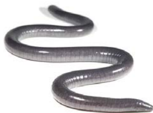
53 Caecilia crassisquama CAECILIIDAE FG