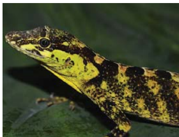
59 Anolis fitchi ♀ IGUANIDAE – DACTYLOINAE LTT