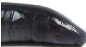
51 Caecilia abitaguae CAECILIIDAE