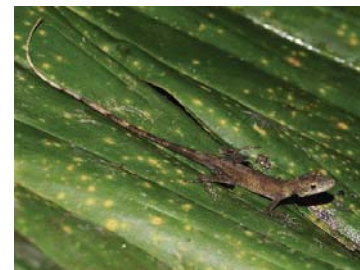
60 Anolis fuscoauratus IGUANIDAE – DACTYLOINAE LTT