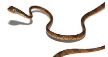
72 Imantodes cenchoa COLUBRIDAE – DIPSADINAE FG