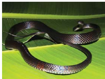
74 Oxyrhopus petolarius COLUBRIDAE – DIPSADINAE FV