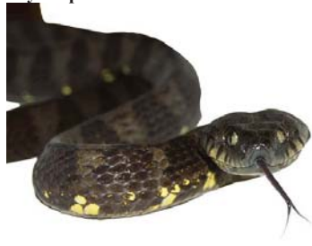
66 Dipsas indica COLUBRIDAE – DIPSADINAE LTT