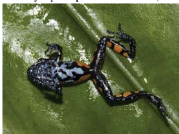
49 Pristimantis ventrimarmoratus (v) 50 STRABOMANTIDAE LTT