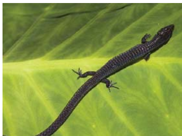
57 Riama cf. anatorloros GYMNOPHTHALMIDAE LTT