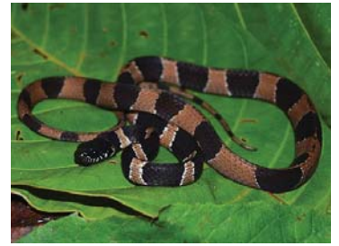
68 Dipsas palmeri COLUBRIDAE – DIPSADINAE FV