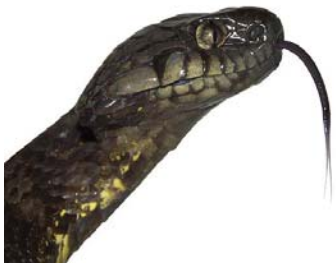
65 Dipsas indica COLUBRIDAE – DIPSADINAE LTT