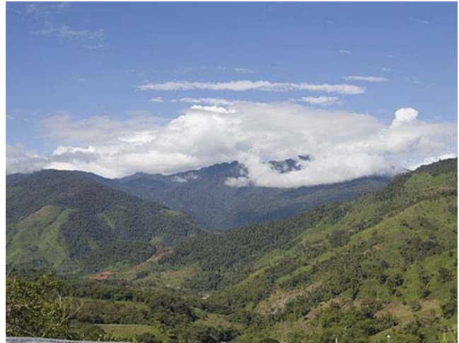
Bosque secundario colinado