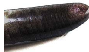
52 Caecilia abitaguae CAECILIIDAE