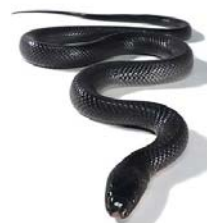
64 Clelia clelia ♀ COLUBRIDAE – DIPSADINAE AAV