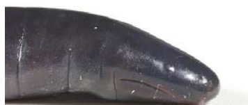
54 Caecilia crassisquama CAECILIIDAE FG