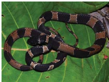
69 Dipsas palmeri COLUBRIDAE – DIPSADINAE FV