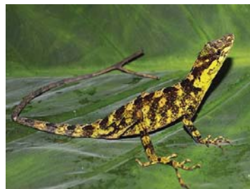
58 Anolis fitchi ♀ IGUANIDAE – DACTYLOINAE LTT