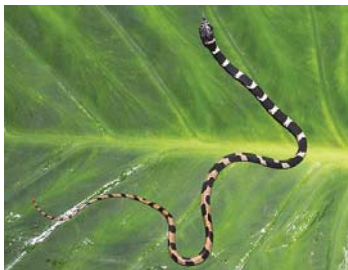
71 Dipsas pavonina COLUBRIDAE – DIPSADINAE LTT