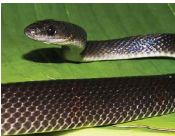
75 Oxyrhopus petolarius COLUBRIDAE – DIPSADINAE FV