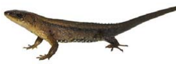
55 Alopoglossus atriventris ALPOGLOSSIDAE LTT