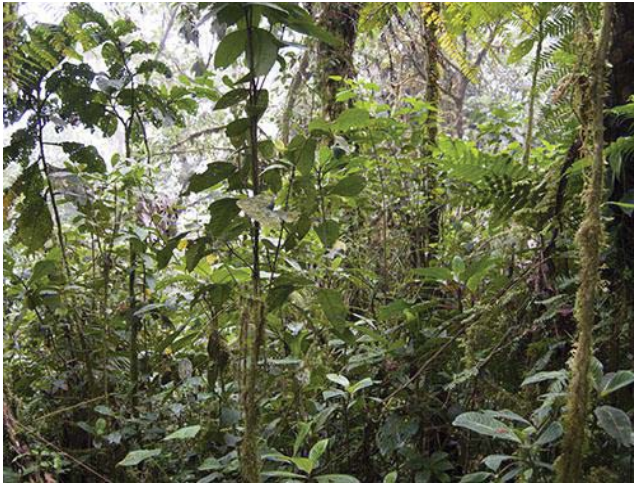
Estribaciones orientales de la Cordillera de los Andes