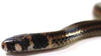
62 Tantilla melanocephala COLUBRIDAE-COLUBRINAE APM