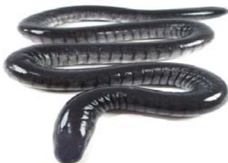
Caecilia abitaguae CAECILIIDAE