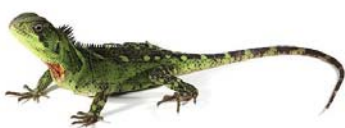
61 Enyalioides praestabilis IGUANIDAE – HOPLOCERCINAE FG