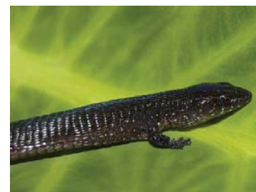
56 Riama cf. anatorloros GYMNOPHTHALMIDAE LTT