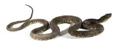
76 Bothrops atrox ♂ VIPERIDAE FV