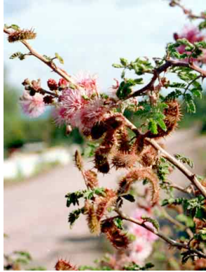
22 Mimosa monancistra FABACEAE-MIMOSOIDEA Uña de gato