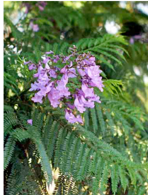
8 Jacaranda mimosifolia BIGNONIACEAE Jacaranda