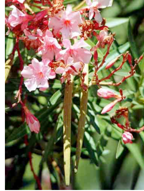
4 Nerium oleander APOCYNACEAE Rosa laurel