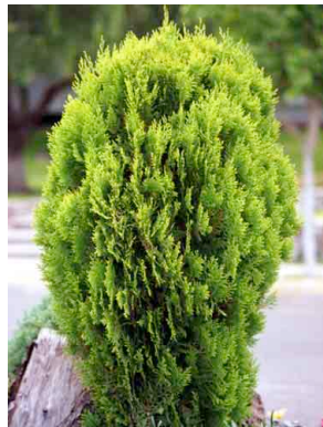
18 Thuja orientalis CUPRESSACEAE Tuja