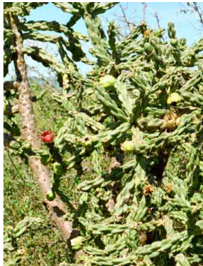
11 Opuntia imbricata CACTACEAE Cardon