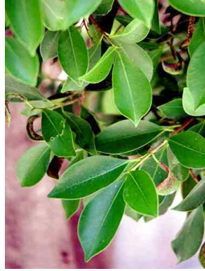
29 Ficus retusa MORACEAE Laurel de la India