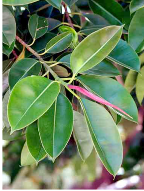
28 Ficus elastica MORACEAE Hule