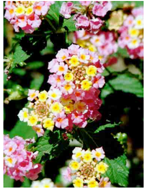
40 Lantana camara VERBENACEAE Cinco Negritos