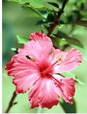
24 Hibiscus rosa-sinensis MALVACEAE Tulipan