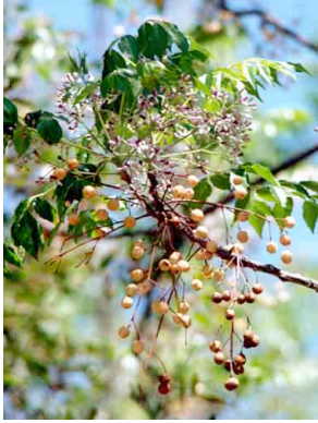
26 Melia azedarach MELIACEAE Paraiso