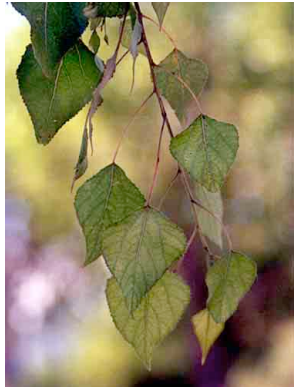
37 Populus fremontii SALICACEAE Alamillo