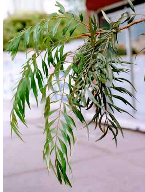
33 Grevillea robusta PROTEACEAE Grevilia