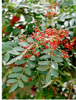
3 Schinus terebinthifolius ANACARDIACEAE Pirul chino