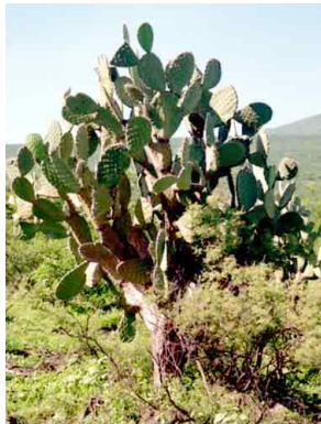
12 Opuntia streptacantha CACTACEAE Nopal cardon