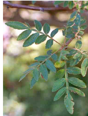
9 Bursera palmeri BURSERACEAE Xixote colorado