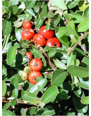
35 Pyracantha koidzumii ROSACEAE Piracanto