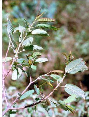
34 Karwinskia humboldtiana RHAMNACEAE Tullidora