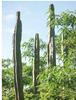
13 Stenocereus dumortieri CACTACEAE Organa