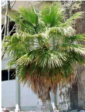
7 Washingtonia robusta ARECACEAE Palma Washingtonia