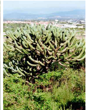
10 Myrtillocactus geometrizans CACTACEAE Garambullo