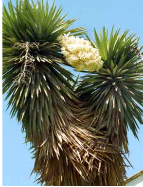
1 Yucca filifera AGAVACEAE Yuca

©G. Ocampo, J. Quesada, R. Aguirre, y Environ. & Conserv. Programs, The Field Museum, Chicago, IL 60605 USA. [RRC@fmnh.org] Rapid Color Guide #138 version 1.3