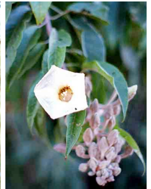
15 Ipomoea murucoides CONVOLVULACEAE Palo bobo