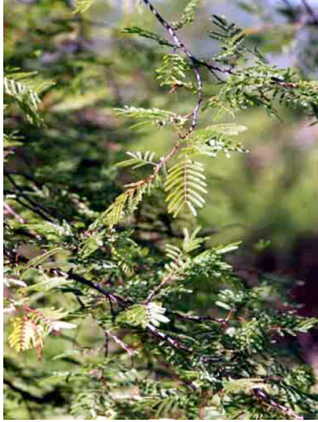
21 Lysiloma microphyllum FABACEAE-MIMOSOID Palo de arco

©G. Ocampo, J. Quesada, R. Aguirre, y Environ. & Conserv. Programs, The Field Museum, Chicago, IL 60605 USA. [RRC@fmnh.org] Rapid Color Guide #138 version 1.3