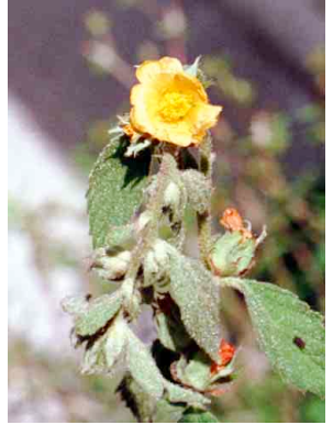
25 Malvastrum bicuspidatum MALVACEAE Huinare