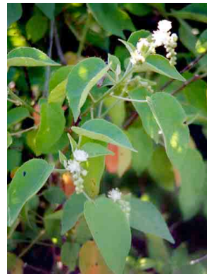
19 Croton ciliato-glanduliferus EUPHORBIACEAE Soliman