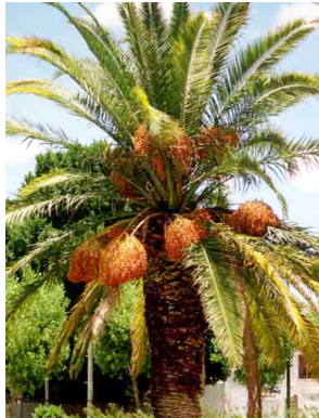
6 Phoenix canariensis ARECACEAE Palma