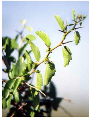
39 Celtis ehrenbergiana ULMACEAE Granjeno