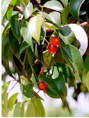
27 Ficus benjamina MORACEAE Ficus