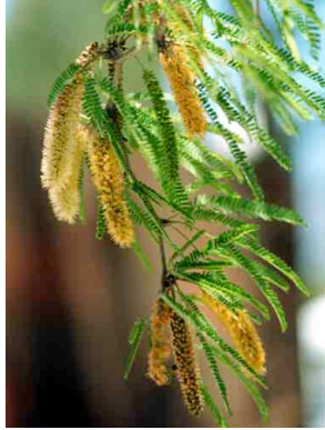
23 Prosopis laevigata FABACEAE-MIMOSOIDEA Mezquite