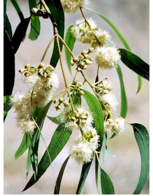
30 Eucalyptus camaldulensis MYRTACEAE Eucalipto