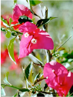
31 Bougainvillea glabra NYCTAGINACEAE Camelina