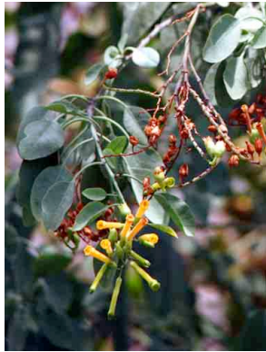
38 Nicotiana glauca SOLANACEAE Tabaquillo