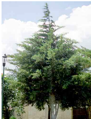
16 Cupressus lusitanica CUPRESSACEAE Ciprés