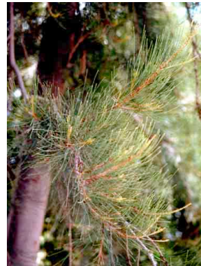
14 Casuarina equisetifolia CASUARINACEAE Casuarina