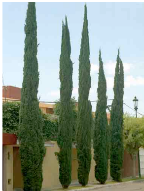
17 Cupressus sempervirens CUPRESSACEAE Ciprés italiano