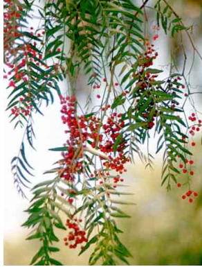
2 Schinus molle ANACARDIACEAE Pirul