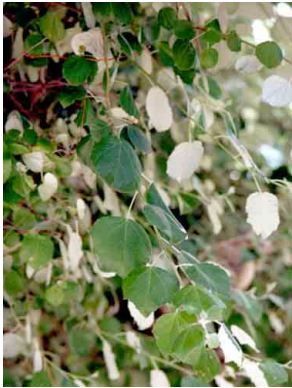
36 Populus alba SALICACEAE Álamo blanco