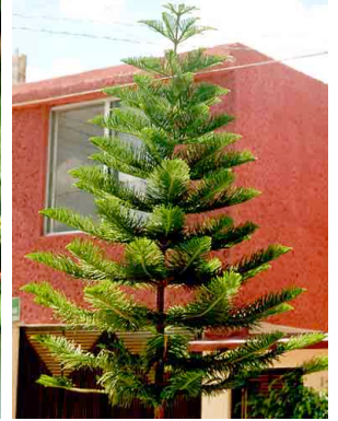
5 Araucaria heterophylla ARAUCARIACEAE Araucaria