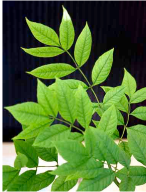
32 Fraxinus uhdei OLEACEAE Fresno