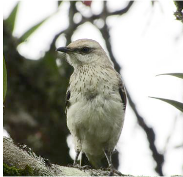
14 Mimus gilvus (A) MIMIDAE Sinsote común

Común y conspicuo en áreas boscosas abiertas, plantaciones y parques.