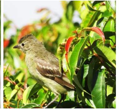
40 Elaenia flavogaster (A) TYRANNIDAE Elaenia copetona

Abundante en áreas abiertas en tierras altas, páramos, tierras agrícolas. La mirla más grande de Colombia.