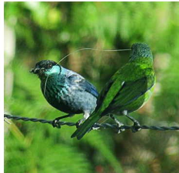
31 Stelpnia heinei (Izq: M, Der: H) (C) THRAUPIDAE Tángara capirozada

Común en bosques, borde de bosque, plantaciones y jardines. Localmente común en los Andes.