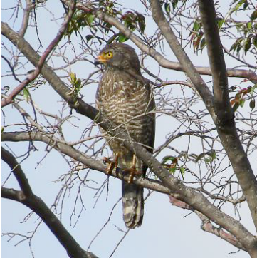
1 Rupornis magnirostris (Inm, A) ACCIPITRIDAE Gavilán caminero

Común en bosques y áreas abiertas a todas elevaciones. Visto con frecuencia.