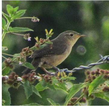
38 Troglodytes aedon (A) TROGLODYTIDAE Cucarachero común

Localmente común en borde de bosque, plantaciones y jardines.