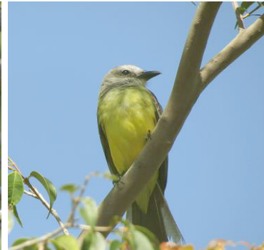
43 Tyrannus melancholicus (A) TYRANNIDAE Sirirí común

Abundante en áreas boscosas abiertas, bordes de bosque, plantaciones, bosques de ribera, jardines y parques.