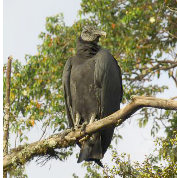
2 Coragyps atratus (A) CATHARTIDAE Gallinazo común

Común en bosques y áreas abiertas a todas elevaciones. Visto con frecuencia.