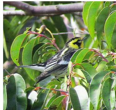
19 Setophaga fusca (M, A, Mi) PARULIDAE Reinita gorginaranja

Común en bosque montano y bordes. Especie más abundante del género en los Andes, especialmente en áreas montañosas.