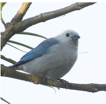
33 Thraupis episcopus (A) THRAUPIDAE Azulejo común

Frecuente en áreas abiertas, bordes, vegetación secundaria, matorrales y zonas arboladas en todo el país.