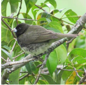
26 Sporophila nigricollis (M, A) THRAUPIDAE Espiguero capuchino

Común en gran parte de Colombia. Frecuente matorrales y especialmente en pastizales de espigas altas.