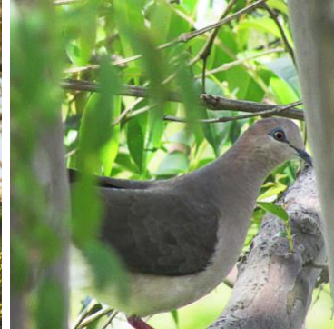
3 Leptotila verreauxi (C) COLUMBIDAE Camimera colipinta

Regularmente en ciudades, vertederos, borde de bosque y humedales.