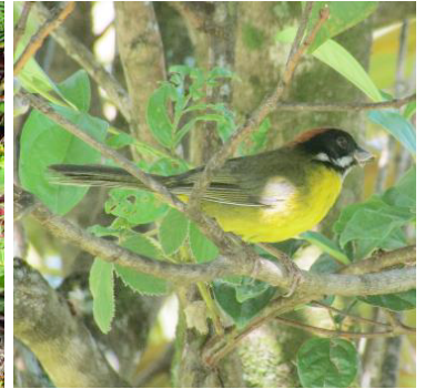
16 Atlapetes albofrenatus (CE, PC) PASSERELLIDAE Atlapetes bigotudo

Común en áreas abiertas, matorrales, sabanas y pastizales. Fácil de observar.