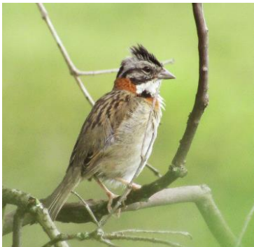
17 Zonotrichia capensis (M, A) PASSERELLIDAE Copetón común

Común en bosques arbustivos subtropicales y bordes boscosos. Así como en vegetación secundaria y rastrojos.