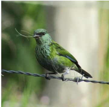
30 Stelpnia heinei (H, C) THRAUPIDAE Tángara capirozada

Común en bosques, borde de bosque, plantaciones y jardines. Localmente común en los Andes.