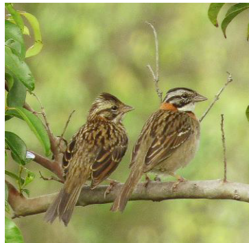
18 Zonotrichia capensis (Izq: H, Der: Inm) (A) PASSERELLIDAE Copetón común

Común en zonas agrícolas, matorrales, zonas arboladas, pastizales, áreas urbanas y bordes