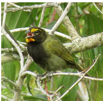
34 Tiaris olivaceus (M, A) THRAUPIDAE Semillero cariamarillo

Frecuente en áreas abiertas, bordes, vegetación secundaria, matorrales y zonas arboladas en todo el país.