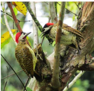
21 Colaptes punctigula (Izq: M, Der: H) (C) PICIDAE Carpintero buchipecoso

Común en bosques, vegetación secundaria, áreas semiabiertas, plantaciones, palmerales y jardines.