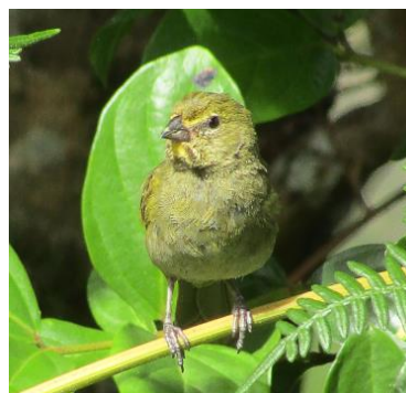
35 Tiaris olivaceus (H, A) THRAUPIDAE Semillero cariamarillo

Común en abiertas, plantaciones, áreas agrícolas, jardines y pastizales en los Andes.