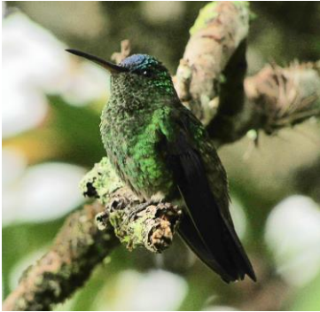
37 Amazilia cyanifrons (H, E, C) TROCHILIDAE Amazilia ciáneo

Localmente común en borde de bosque, plantaciones y jardines.