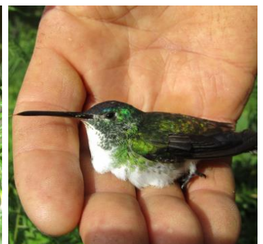
36 Amazilia franciae (M, C) TROCHILIDAE Amazilia andino

Frecuente en bosques, borde de bosque y jardines en los Andes.