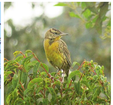
12 Sturnella magna (Inm, C) ICTERIDAE Chirlobirlo