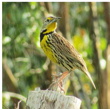
10 Sturnella magna (M, C) ICTERIDAE Chirlobirlo

Común en bosques y bordes. Visita comederos de frutas.