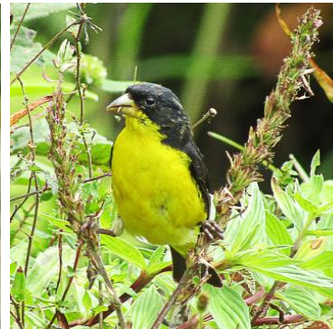
7 Spinus psaltria (M, C) FRINGILLIDAE Jilguero aliblanco

Común en áreas abiertas, pastizales y matorrales en zonas agrícolas. Grupos ruidosos y notables.