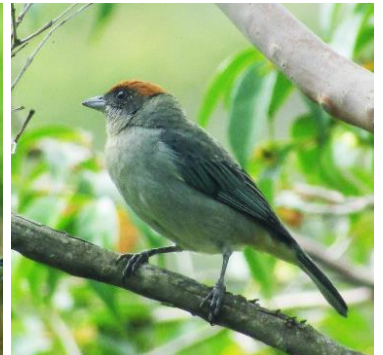
32 Stelpnia vitriolina (CE, A) THRAUPIDAE Tángara rastrojera