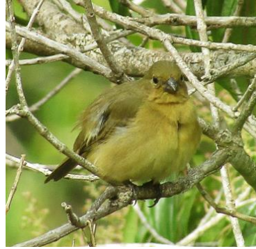
27 Sporophila nigricollis (H, A) THRAUPIDAE Espiguero capuchino

Común en gran parte de Colombia. Frecuente matorrales y especialmente en pastizales de espigas altas.