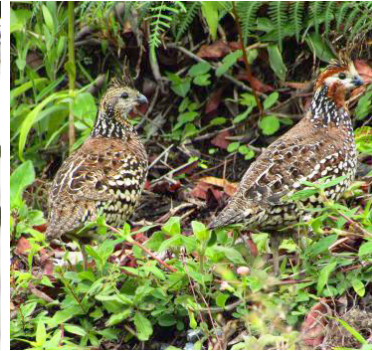
15 Colinus cristatus (Izq: H, Der: M) (C) ODONTOPHORIDAE Perdiz común o Chilindra

Común y conspicuo en áreas abiertas arboladas, bordes, matorrales, zonas ganaderas y vegetación semidesértica, así como en áreas urbanas.