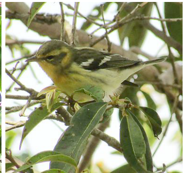
20 Setophaga fusca (H, A, Mi) PARULIDAE Reinita gorginaranja

Común en bosque montano y bordes. Especie más abundante del género en los Andes, especialmente en áreas montañosas.