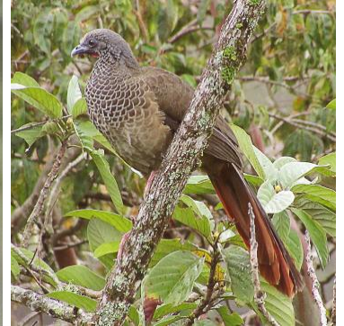
4 Ortalis columbiana (E, C) CRACIDAE Guacharaca colombiana

Común en bosques, claros y áreas semiabiertas, vegetación secundaria, matorrales y áreas agrícolas.