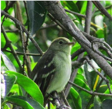
41 Elaenia frantzii (A) TYRANNIDAE Sinsote común

Común en bosques y bordes arbolados, vegetación secundaria, parques, jardines y áreas ligeramente.