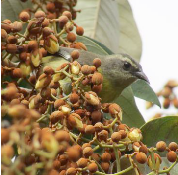
25 Coereba flaveola (Inm, A) THRAUPIDAE Mielero común