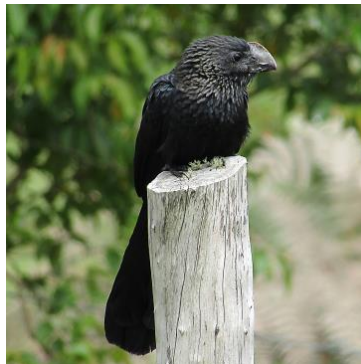
6 Crotophaga ani (C) CUCULIDAE Garrapatero piquiliso

Común en áreas abiertas, pastizales y matorrales en zonas agrícolas. Grupos ruidosos y notables.