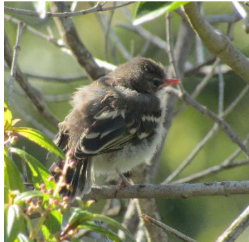
42 Elaenia frantzii (Inm, A) TYRANNIDAE Sinsote común

Común en borde de bosques montanos y matorrales, así como en vegetación secundaria.