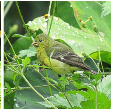
8 Spinus psaltria (H, C) FRINGILLIDAE Jilguero aliblanco

Común en áreas boscosas, tierras de cultivo, parque y jardines de montaña.