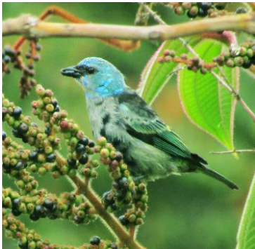
29 Stelpnia cyanicollis (Inm, C) THRAUPIDAE Tángara real

Común en bordes de bosque, plantaciones y jardines en los Andes.