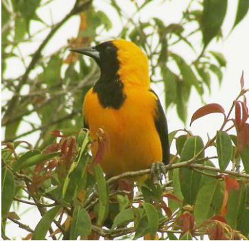
13 Icterus chrysater (C) ICTERIDAE Turpial montañero

Común y conspicuo en áreas boscosas abiertas, plantaciones y parques.