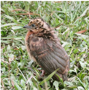
5 Ortalis columbiana (Inm, E, C) CRACIDAE Guacharaca colombiana

Frecuente en vegetación secundaria y zonas arboladas, así como en parques, jardines y plantaciones.