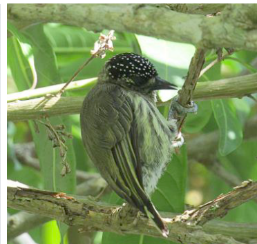
23 Picumnus olivaceus (H, PC) PICIDAE Carpinterito oliváceo

Frecuente en bosques secundarios, semiabiertos y plantaciones con árboles altos.