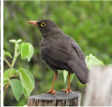
39 Turdus fuscater (M, A) TURDIDAE Mirla común

Frecuente en áreas abiertas. Especialmente abundante alrededor de las casas y ranchos. Cucarachero más común en Colombia.