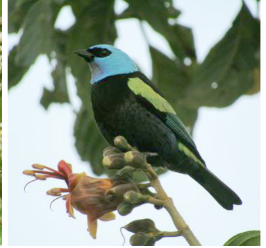
28 Stelpnia cyanicollis (C) THRAUPIDAE Tángara real

Común en bordes de bosque, plantaciones y jardines en los Andes.