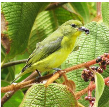
9 Eufonia lanirostris (H, A) FRINGILLIDAE Eufonia gorgiamarilla

Común en bosques y bordes. Visita comederos de frutas.