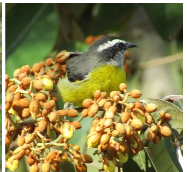
24 Coereba flaveola (A) THRAUPIDAE Mielero común

Común en bosques secundarios, bordes, alrededor de claros y plantaciones.