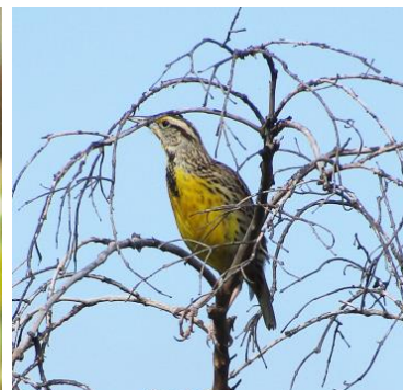
11 Sturnella magna (H, C) ICTERIDAE Chirlobirlo

Frecuente en zonas abiertas, pastizales, granjas ganaderas y áreas con poca vegetación.