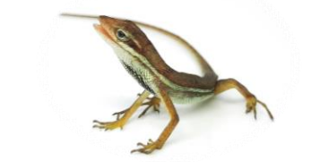
28 Norops auratus DACTYLOIDAE Camaleón sabanero