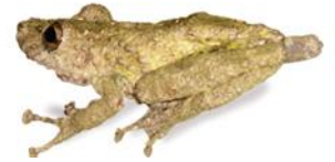
4 Scinax boulengeri HYLIDAE Rana arborícola narizona