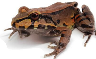
11 Leptodactylus savagei LEPTODACTYLIDAE Rana de dedos delgados