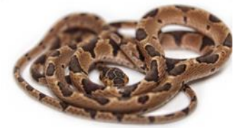
25 Imantodes cenchoa DIPSADIDAE Bejuquilla cabezona