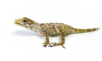
32 Norops pentaprion DACTYLOIDAE Norops de liquen