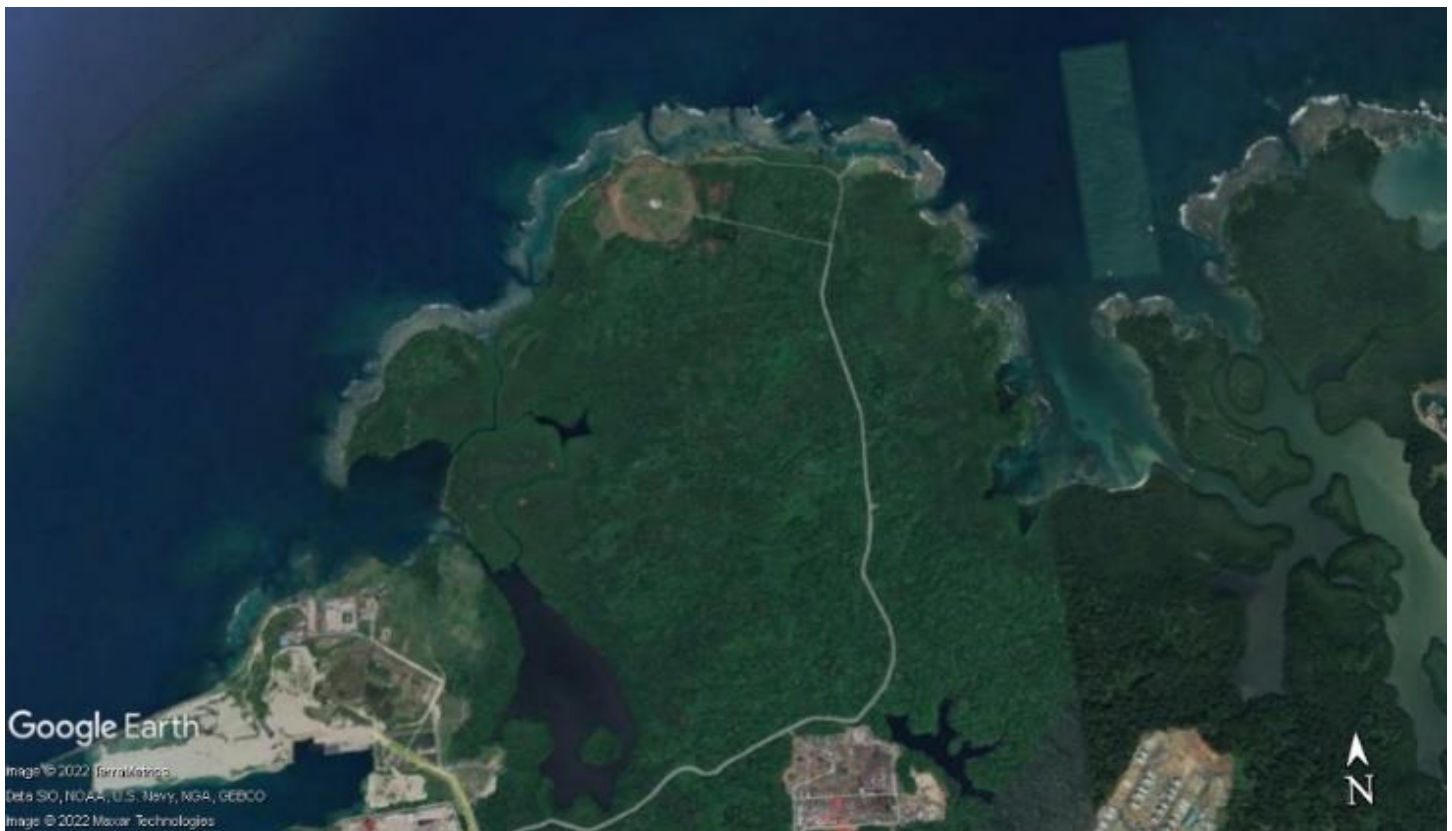
Vista satelital del Paisaje Protegido Isla Galeta, 2022

Con agrado esperamos que la presente guía sea de mucha utilidad para los visitantes nacionales y extranjeros interesados en conocer la biodiversidad de Isla Galeta. Esta guía representa un valor agregado al conocimiento de la herpetofauna del PPIG, como material educativo producto de giras de campo y una publicación científica. Fuente: Walter-Conrado, M., Ulloa, L., Melo, N., Sosa-Bartuano, Á., & Contreras, M. (2022). Diversidad y estado de conservación de anfibios y reptiles en Paisaje Protegido Isla Galeta, Colón-Panamá Scientia, 32(2), 38-53. Recuperado a partir de https://revistas.up.ac.pa/index.php/scientia/article/view/3125