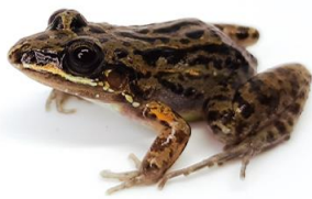
9 Leptodactylus fragilis LEPTODACTYLIDAE Rana de bigotes