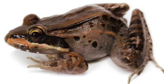
10 Leptodactylus insularum LEPTODACTYLIDAE Rana de la isla San Miguel