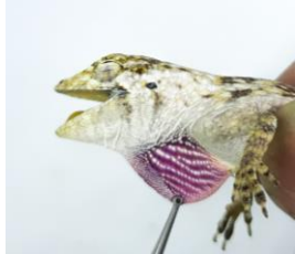
33 Norops pentapryon DACTYLOIDAE Norops de liquen