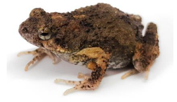
12 Engystomops pustulosus LEPTODACTYLIDAE Ranita túngara