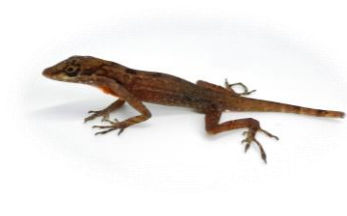
30 Norops apletophallus DACTYLOIDAE