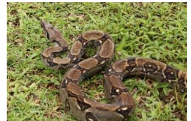
16 Boa imperator BOIDAE Boa constrictora común