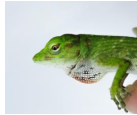
35 Norops biporcatus DACTYLOIDAE Abaniquillo verde