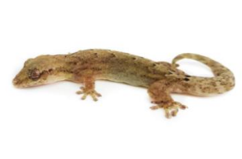
36 Lepidodactylus lugubris GEKKONIDAE Salamanquesas de luto