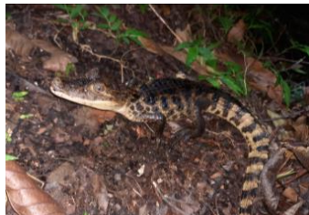
14 Caiman crocodilus ALLIGATORIDAE Caimán de anteojos