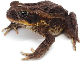
1 Rhinella horribilis BUFONIDAE Sapo de caña