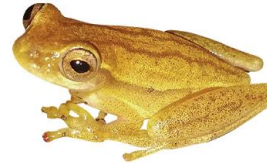
7 Dendropsophus microcephalus HYLIDAE Rana enana de cabeza pequeña