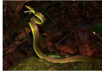
18 Oxybelis brevirostris COLUBRIDAE Serpiente de la vid de Cope