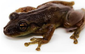
3 Scinax ruber HYLIDAE Ranita listada