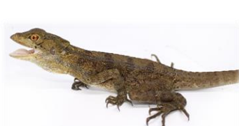
27 Basiliscus basiliscus CORYTOPHANIDAE Basilisco común