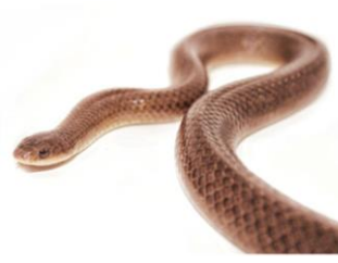
19 Stenorrhina degenhardtii COLUBRIDAE Serpiente alacranera