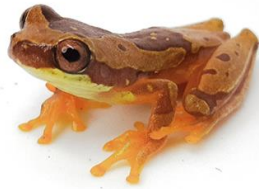
6 Dendropsophus ebraccatus HYLIDAE Rana reloj de arena