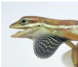
29 Norops auratus DACTYLOIDAE