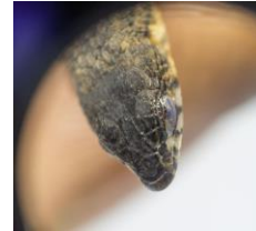
39 Loxopholis rugiceps GYMNOPHTHALMIDAE