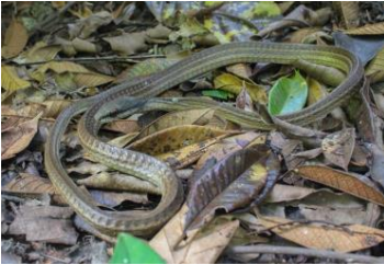
17 Mastigodryas alternatus COLUBRIDAE Culebra cazadora