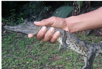
15 Crocodylus acutus CROCODYLIDAE Cocodrilo americano