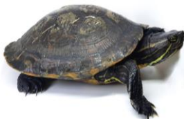
45 Trachemys scripta EMYDIDAE Tortuga pintada