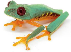
8 Agalychnis callidryas HYLIDAE Rana de ojos rojos