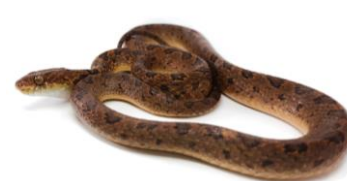
26 Leptodeira rhombifera DIPSADIDAE Serpiente ojo de gato