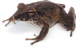
2 Craugastor fitzingeri CRAUGASTORIDAE Rana de cristal