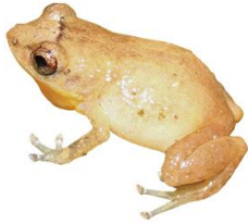
5 Diasporus diastema ELEUTHERODACTYLIDAE Rana de campanilla