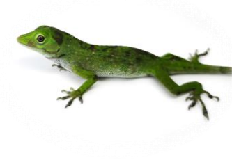
34 Norops biporcatus DACTYLOIDAE Abaniquillo verde