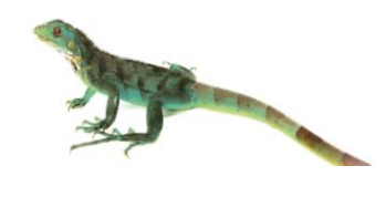
40 Iguana rhinolopha IGUANIDAE Iguana verde