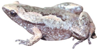
13 Elachistocleis panamensis MICROHYLIDAE Sapito de los termiteros