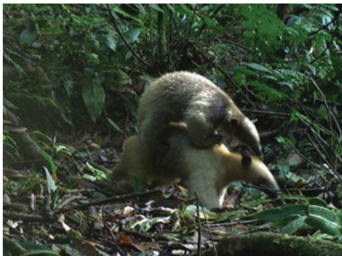
16 Tamandua tetradactyla MYRMECOPHAGIDAE Oso hormiguero