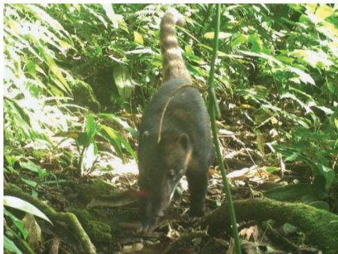
17 Nasua nasua PROCYONIDAE Coatí