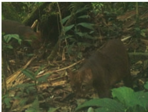
8 Herpailurus yagouaroundi FELIDAE Yaguarundi