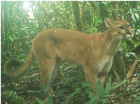
13 Puma concolor FELIDAE Puma