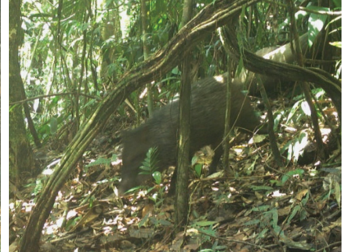
21 Dicotyles tajacu TAYASSUIDAE Sajino