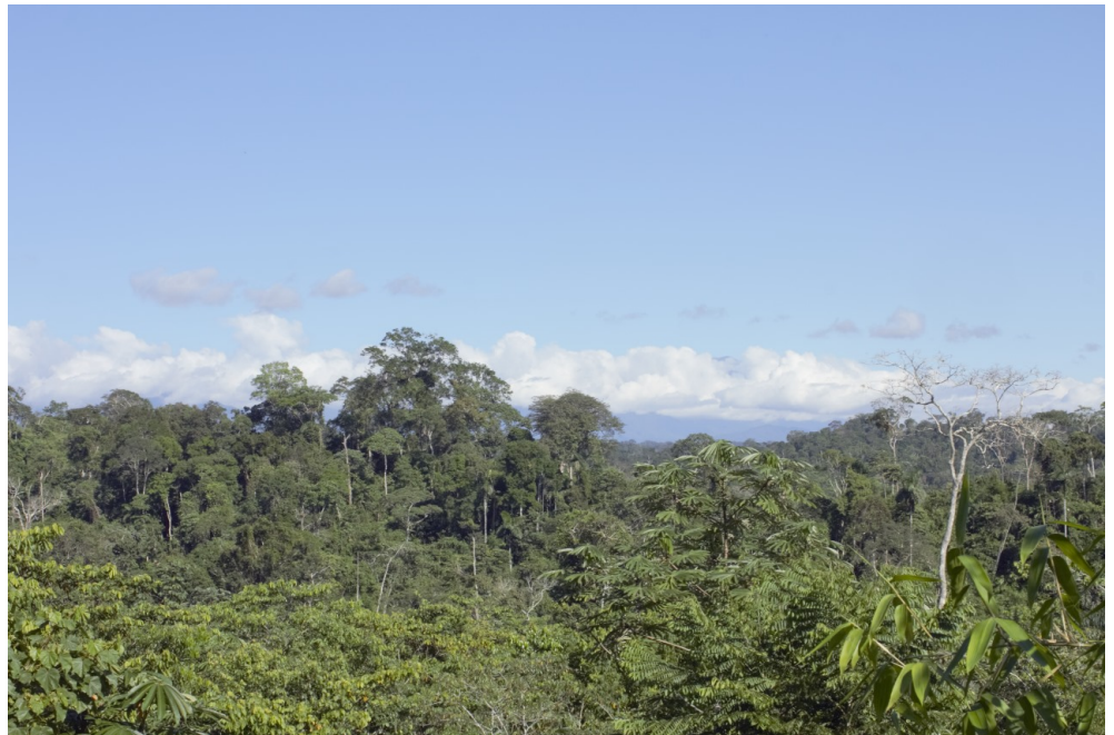
23 Reserva Comunal Machiguenga