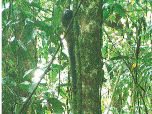
2 Leontocebus weddelli CALLITRICHIDAE Pichico común