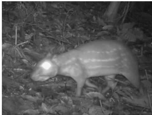
4 Cuniculus paca CUNICULIDAE Paca