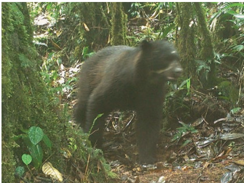
22 Tremarctos ornatus URSIDAE Oso de anteojos