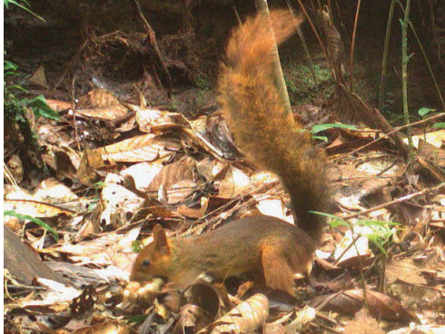
19 Hadroskiurus spadiceus SCIURIDAE Ardilla roja amazónica

[fieldguides.fieldmuseum.org] [1693] versión 1 7/2024