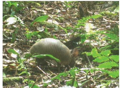
6 Dasyus novemcinctus DASYPODIDAE Armadillo bandeado