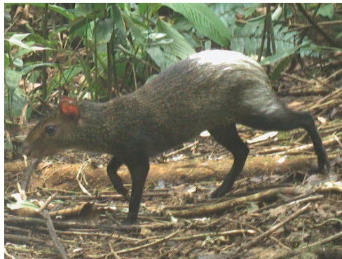
5 Dasyprocta kalinowskii DASYPROCTIDAE Añuje de Kalinowski