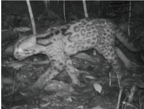
11 Leopardus tigrinus FELIDAE Tigrillo