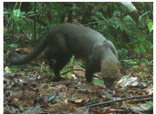
9 Herpailurus yagouaroundi FELIDAE Yaguarundi