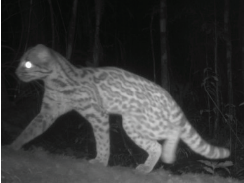
10 Leopardus pardalis FELIDAE Ocelote

[fieldguides.fieldmuseum.org] [1693] versión 1 7/2024