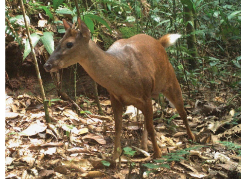
3 Mazama americana CERVIDAE Venado colorado