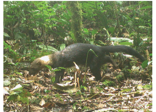
15 Eira barbara MUSTELIDAE Tayra