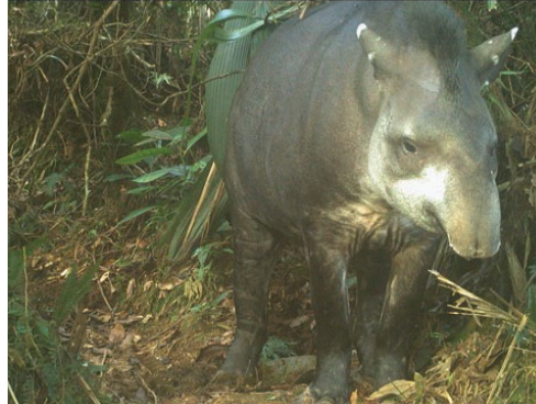
20 Tapirus terrestris TAPIRIDAE Tapir