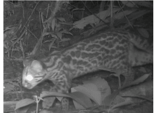
12 Leopardus wiedii FELIDAE Margay