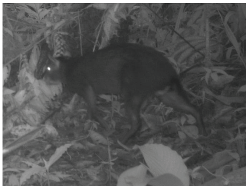
7 Myoprocta pratti DASYPROCTIDAE Acuchí