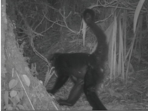
1 Ateles chamek ATELIDAE Mono araña

[fieldguides.fieldmuseum.org] [1693] versión 1 7/2024