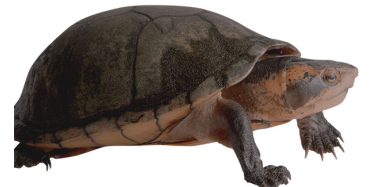
44 Kinosternon leucostomum KINOSTERNIDAE Tapáculo