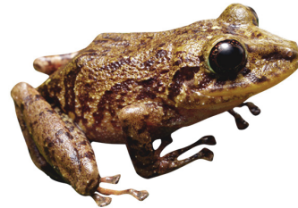
6 Pristimantis latidiscus CRAUGASTORIDAE Rana de lluvia EB