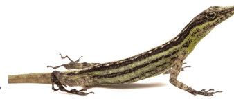
23 Anolis aff. anchicayae DACTYLOIDAE Camaleón