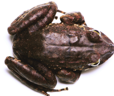
18 Strabomantis anomalus STRABOMANTIDAE