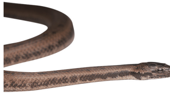
39 Tretanorhinus nigroluteus COLUBRIDAE Lagunera