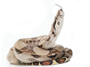
34 Boa imperator BOIDAE Boa