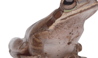
15 Smilisca phaeota HYLIDAE SR