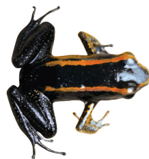
10 Phyllobates samperi DENDROBATIDAE Rana dardo SR