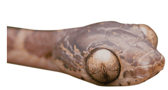
36 Imantodes cenchoa COLUBRIDAE Guascamilla