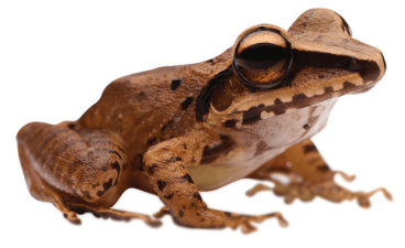
4 Craugastor longirostris CRAUGASTORIDAE Rana picuda SR