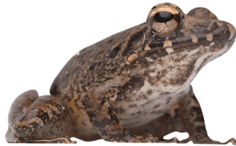
2 Craugastor fitzingeri CRAUGASTORIDAE Rana picuda SR