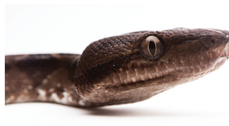
35 Corallus annulatus BOIDAE Boa arboricola