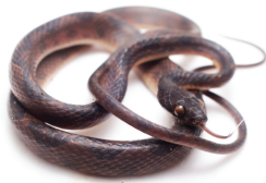
37 Leptodeira ornata COLUBRIDAE Ojo de gato