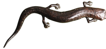
19 Bolitoglossa biseriata PLETHODONTIDAE Salamandra