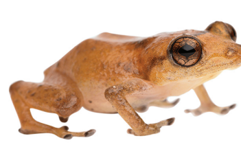
11 Diasporus gularis ELEUTHERODACTYLIDAE Ranita SR