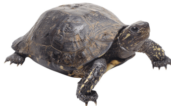
42 Rhinoclemmys annulata GEOEMYDIDAE Palmera negra