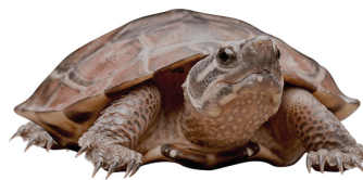
43 Rhinoclemmys nasuta GEOEMYDIDAE Palmera narizona