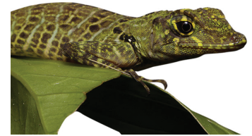
24 Anolis aff. latifrons DACTYLOIDAE Camaleón