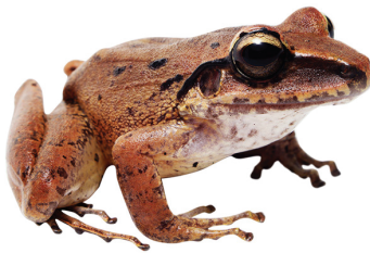
5 Craugastor raniformis CRAUGASTORIDAE Rana de lluvia EB