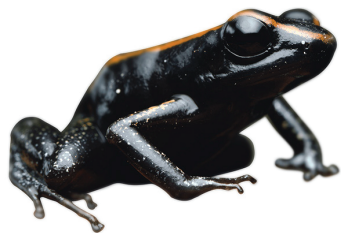
9 Phyllobates samperi DENDROBATIDAE Rana dardo SR