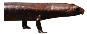
20 Bolitoglossa biseriata PLETHODONTIDAE Salamandra