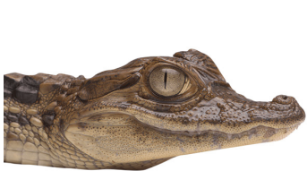
33 Caiman crocodilus fuscus ALLIGATORIDAE Babilla

[fieldguides.fieldmuseum.org] [1701] versión 1 12/2024