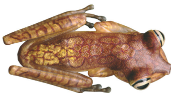
13 Boana picturata HYLIDAE Rana arborícola SR