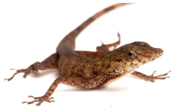
25 Anolis maculiventris DACTYLOIDAE Camaleón