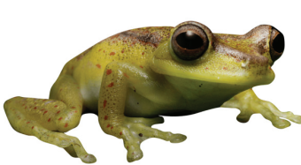
14 Boana rubracyla HYLIDAE Rana arborícola AP