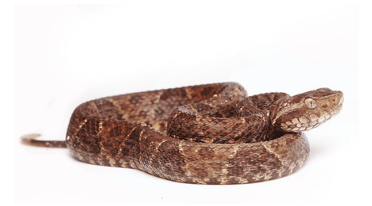
40 Bothrops asper VIPERIDAE Talla equis