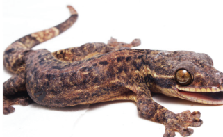
31 Thecadactylus rapicauda PHYLLODACTYLIDAE Salamaqueja