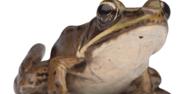
16 Lithobates vaillanti RANIDAE Chula SR