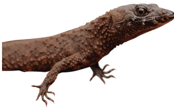
29 Echinosauro horrida GYMNOPHTHALMIDAE Palitos