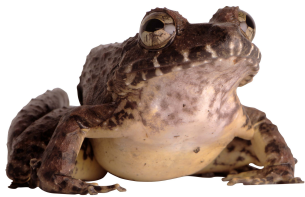
17 Strabomantis anomalus STRABOMANTIDAE

[fieldguides.fieldmuseum.org] [1701] versión 1 12/2024