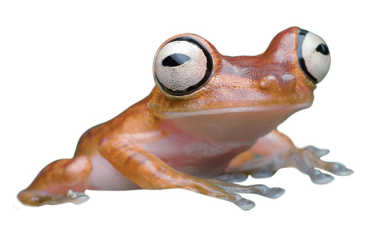
12 Boana picturata HYLIDAE Rana arborícola SR