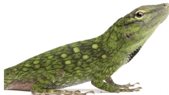
26 Anolis cf. parvauritus DACTYLOIDAE Camaleón