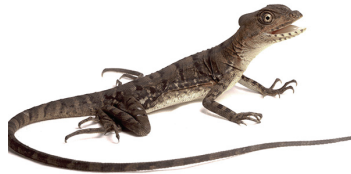
22 Basiliscus galeritus CORYTOPHANIDAE Piande, ochora