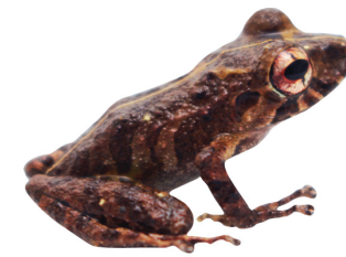
7 Pristimantis sp. CRAUGASTORIDAE Rana de lluvia EB