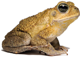
1 Rhinella horribilis BUFONIDAE Sapo común EB

[fieldguides.fieldmuseum.org] [1701] versión 1 12/2024