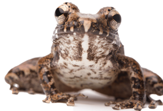
3 Craugastor fitzingeri CRAUGASTORIDAE Rana picuda SR