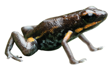
8 Andinobates minutus DENDROBATIDAE Rana cohete SR