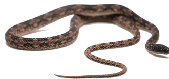
38 Nothopsis rugosus COLUBRIDAE Falso verrugoso