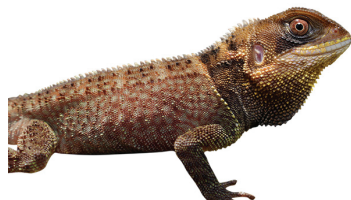
30 Enyalioides heterolepis HOPLOCERCIDAE Lagarto espinoso