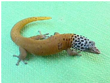
9 Sphaerodactylus dimorphicus (Macho)