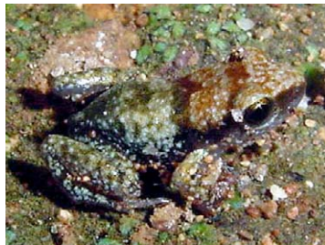
7 Eleutherodactylus etheridgei (Juvenil)