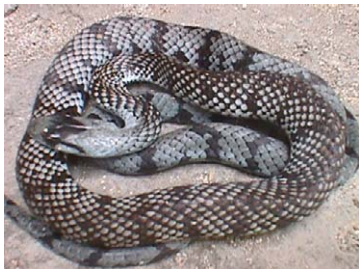
29 Alsophis cantherigerus Jubo