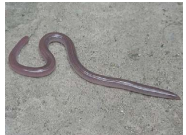
36 Typhlops lumbricalis Culebrita ciega