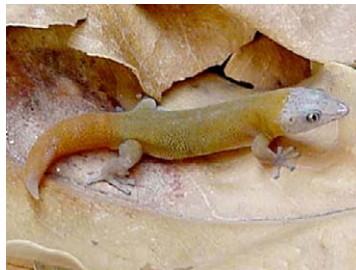
11 Sphaerodactylus siboney (Macho)