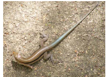
28 Ameiva auberi Rabiazul