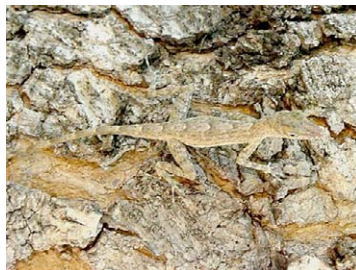
15 Anolis argenteolus