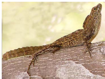
19 Anolis jubar