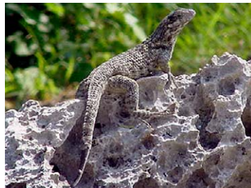
26 Leiocephalus carinatus Perrito de Costa