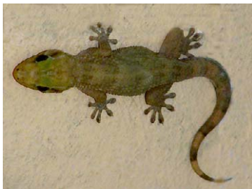
13 Tarentola americana Dormilona