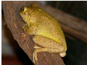
3 Osteopilus septentrionalis Rana platanera