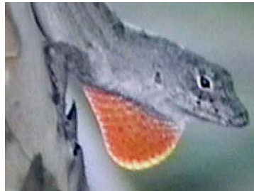
22 Anolis sagrei Lagartija (Macho)