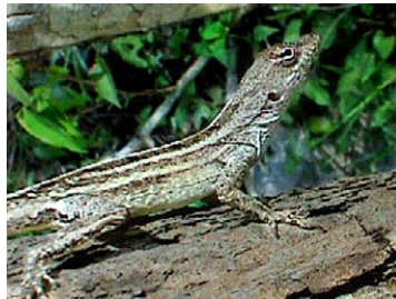
23 Anolis sagrei Lagartija (Hembra)