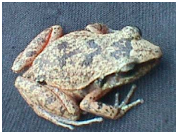
5 Eleutherodactylus atkinsi