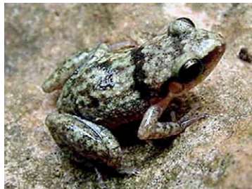
6 Eleutherodactylus etheridgei (Adulto)