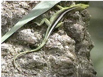
21 Anolis porcatius (Hembra)

Producido por BIOECO, Santiago de Cuba y R. Foster y S. Kaplan con el apoyo del J.D. & C.T. MacArthur Foundation, A. Mellon Foundation, G. & B. Moore Foundation. © BIOECO y Environmental & Conservation Programs, The Field Museum, Chicago, IL 60605 USA. [RRC@fmnh.org] Rapid Color Guide # 170 versión 3.