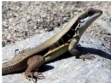
27 Leiocephalus macropus Bayoya