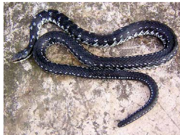
30 Antillophis andreae Jubito prieto