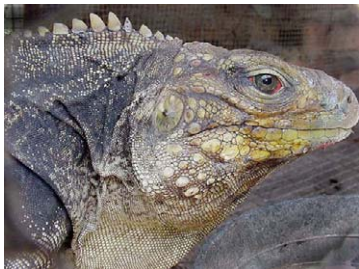
25 Cyclura nubila Iguana