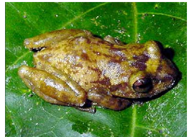
8 Eleutherodactylus ionthus