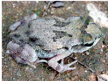
2 Bufo peltoccephalus Sapo timbalero (Juvenil)