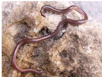
35 Typhlops biminiensis Culebrita ciega