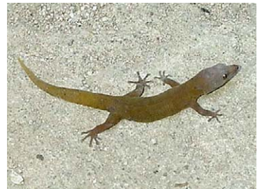
12 Sphaerodactylus siboney (Hembra)