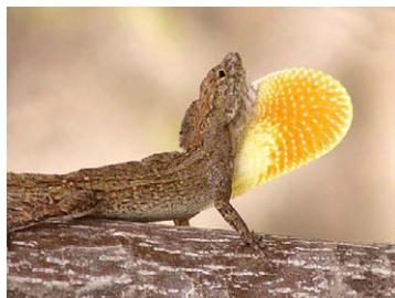
18 Anolis jubar (Pañuelo)