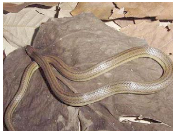
31 Arrhyton landoi