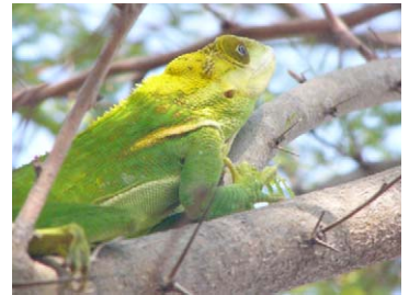
24 Anolis smallwoodi Chipojo