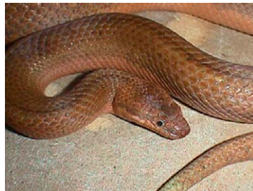
34 Tropidophis melanurus Culebra boba (Anaranjada)