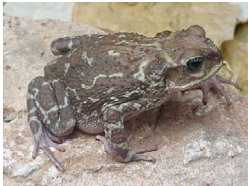
1 Bufo peltoccephalus Sapo timbalero (Adulto)

Fotos de los autores. Producido por BIOECO, Santiago de Cuba y R. Foster y S. Kaplan con el apoyo del J.D. & C.T. MacArthur Foundation, A. Mellon Foundation, G. & B. Moore Foundation. © BIOECO y Environmental & Conservation Programs, The Field Museum, Chicago, IL 60605 USA. [RRC@fmnh.org] Rapid Color Guide # 170 versión 3.