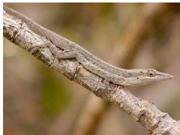
14 Anolis angusticeps