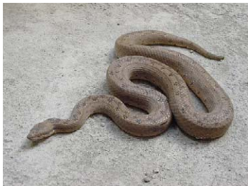
33 Tropidophis melanurus Culebra boba (Oscura)