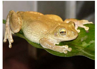
4 Osteopilus septentrionalis Rana platanera