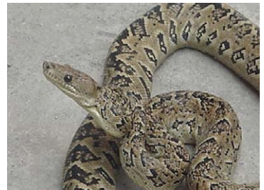
32 Epicrates angulifer Majá de Santa María