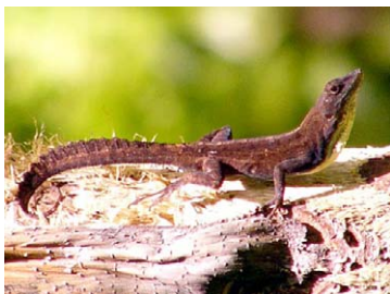
17 Anolis homolechis