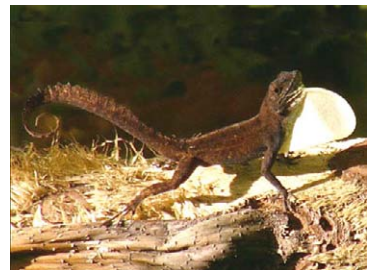
16 Anolis homolechis (Pañuelo)