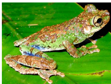
70 Osteocephalus cabrerai HYLIDAE