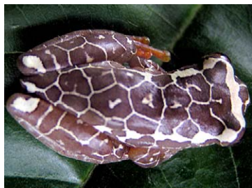
46 Dendropsophus leucophyllatus HYLIDAE