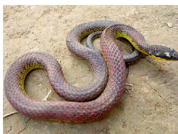
239 Liophis cf. cobella COLUBRIDAE