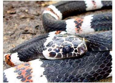
248 Rhinobothryum lentiginosum COLUBRIDAE