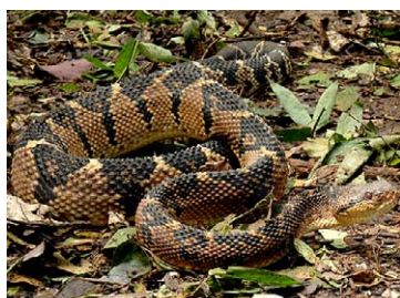
274 Lachesis muta VIPERIDAE