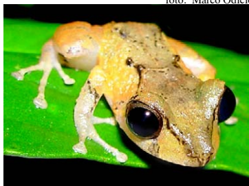
145 Pristimantis kichwarum STRABOMANTIDAE