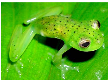
17 Vitreorana oyampiensis CENTROLENIDAE