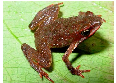
8 Dendrophryniscus minutus BUFONIDAE