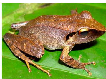
158 Pristimantis peruvianus STRABOMANTIDAE