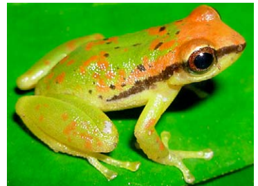
136 Pristimantis acuminatus STRABOMANTIDAE