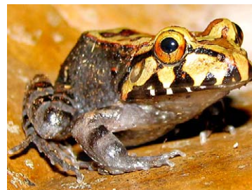
108 Leptodactylus knudseni LEPTODACTYLIDAE