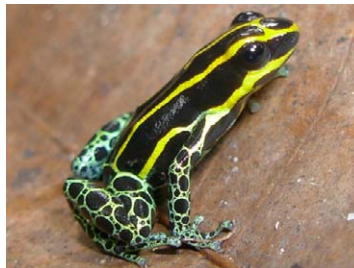
35 Ranitomeya ventrimaculata DENDROBATIDAE