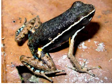
21 Ameerega hahneli DENDROBATIDAE

[rrc@fieldmuseum.org] [www.fmnh.org/animalguides/] Rapid Color Guide # 262 versión 1 01/2010