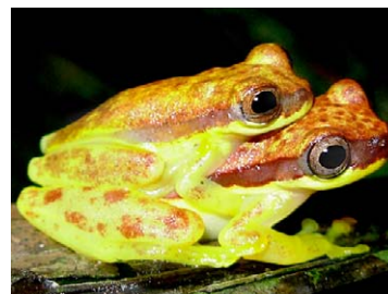
52 Dendropsophus rhodopeplus HYLIDAE