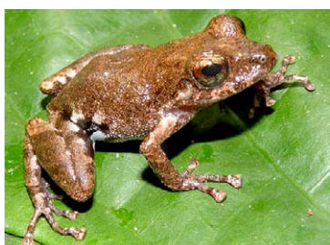
157 Pristimantis orcus STRABOMANTIDAE