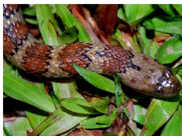
230 Helicops angulatus COLUBRIDAE