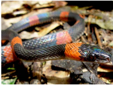
245 Oxyrhopus petala COLUBRIDAE