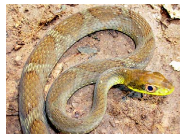
228 Drymobius rombifer COLUBRIDAE