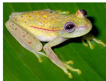
68 Hypsiboas punctatus HYLIDAE