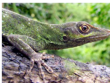
195 Anolis punctata POLYCHROTIDAE