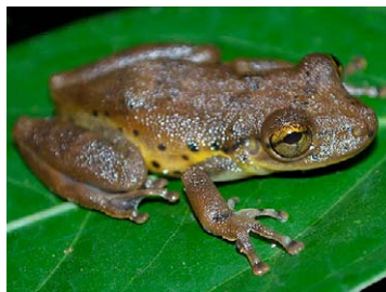
91 Scinax iquitorum HYLIDAE