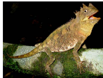
184 Enyalioides palpebralis HOPLOCERCIDAE