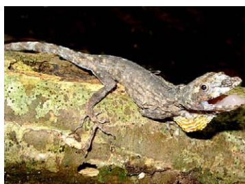
194 Anolis ortonii POLYCHROTIDAE