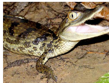
168 Caiman crocodylus ALIGATORIDAE