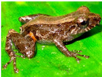
137 Pristimantis altamazonicus STRABOMANTIDAE