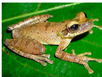
75 Osteocephalus yasuni HYLIDAE