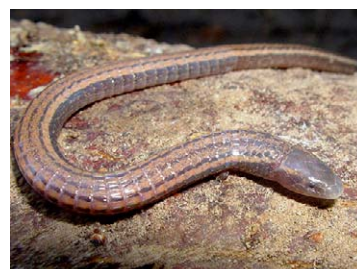
176 Bachia vermiformis GYMNOPHTHALMIDAE