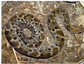
251 Xenodon rabdocephalus COLUBRIDAE