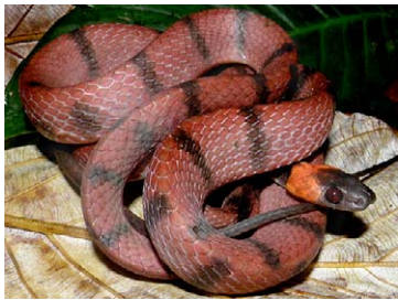
249 Siphlophis compressus COLUBRIDAE