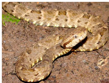
267 Bothrops atrox VIPERIDAE