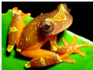
55 Dendropsophus sarayacuensis HYLIDAE