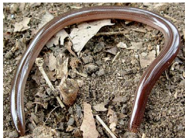
262 Typhlops brongersmianus TYPHLOPIDAE