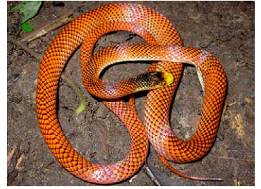
244 Oxyrhopus formosus COLUBRIDAE