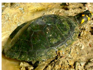
279 Podocnemis unifilis PODOCNEMIDIDAE