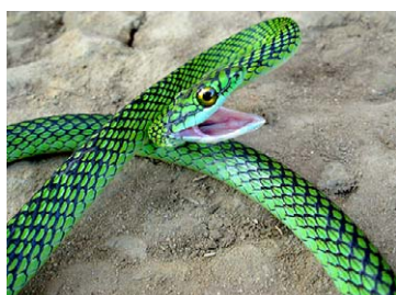
238 Leptophis ahetulla COLUBRIDAE