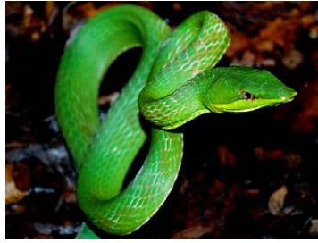
243 Oxybelis fulgidus COLUBRIDAE