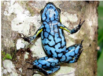
25 Ameerega cf. petersi DENDROBATIDAE