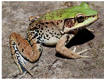
131 Lithobates palmipes RANIDAE