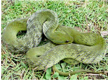
241 Liophis typhlus COLUBRIDAE

[rrc@fieldmuseum.org] [www.fmh.org/animalguides/] Rapid Color Guide # 262 versión 1 01/2010