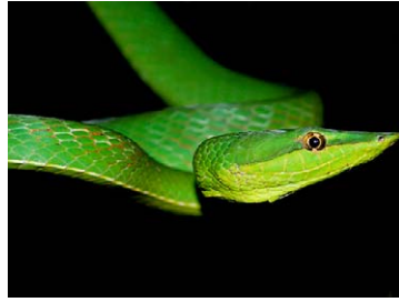
242 Oxybelis fulgidus COLUBRIDAE