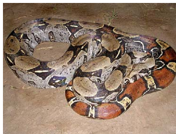
211 Boa constrictor BOIDAE