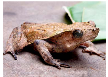
12 Rhinella dapsilis BUFONIDAE