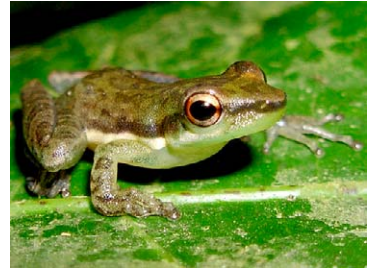
84 Scarthyia goinorum HYLIDAE