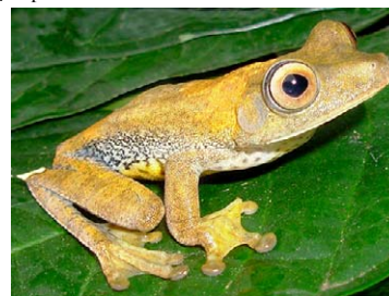
64 Hypsiboas geographicus HYLIDAE