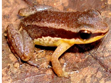
3 Allobates sp. 1 AROMOBATIDAE