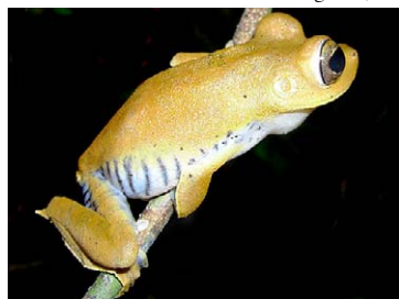
61 Hypsiboas calcaratus HYLIDAE

© Environmental & Conservation Programs, The Field Museum, Chicago, IL 60605 USA. [rrc@fieldmuseum.org] [www.fmh.org/animalguides/] Rapid Color Guide # 262 versión 1 01/2010