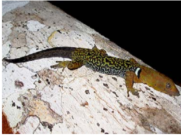
201 Gonatodes concinatus SPHAERODACTILYDAE

[rrc@fieldmuseum.org] [www.fmh.org/animalguides/] Rapid Color Guide # 262 versión 1 01/2010