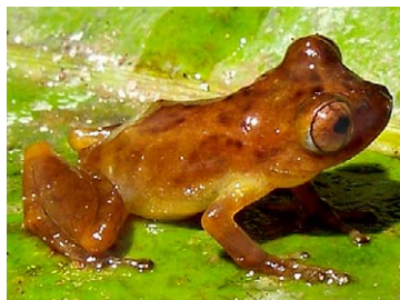
146 Pristimantis lacrimosus STRABOMANTIDAE