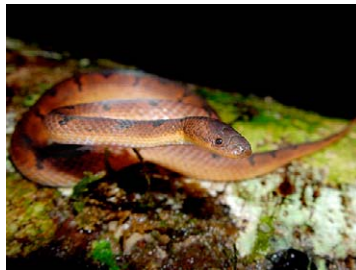
255 Xenopholis scalaris COLUBRIDAE