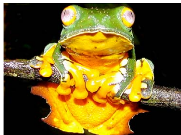
38 Cruziohyla craspedopus HYLIDAE