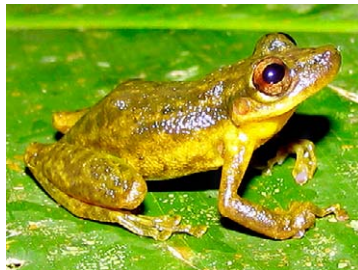
86 Scinax cruentommus HYLIDAE