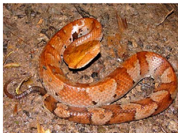
266 Bothrocophias hyoprora VIPERIDAE