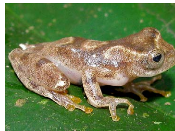
48 Dendropsophus cf. minutus HYLIDAE