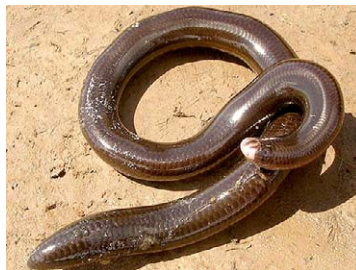
263 Typhlops cf. minuisquamus TYPHLOPIDAE