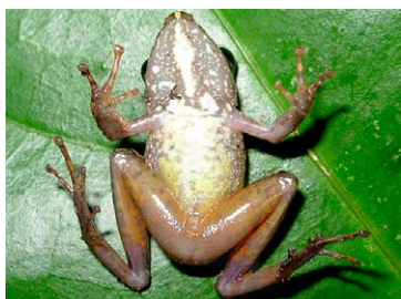
149 Pristimantis lanthanites STRABOMANTIDAE