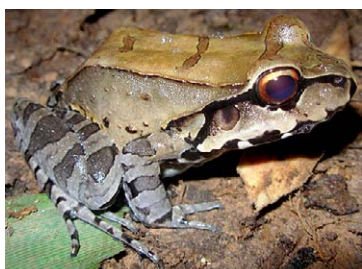
113 Leptodactylus pentadactylus LEPTODACTYLIDAE