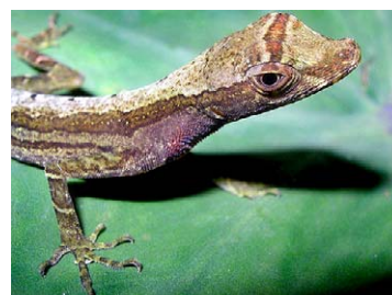
196 Anolis trachyderma POLYCHROTIDAE