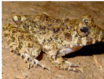
135 Oreobates quixensis STRABOMANTIDAE