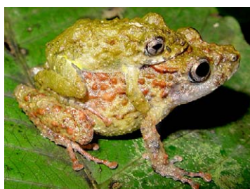
159 Pristimantis sp. nov. 1 STRABOMANTIDAE