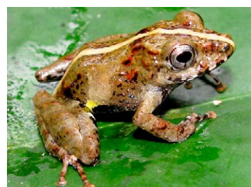
160 Pristimantis sp. nov. 1 STRABOMANTIDAE