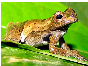
50 Dendropsophus parviceps HYLIDAE