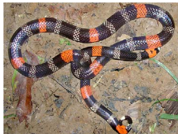
258 Micrurus lemniscatus ELAPIDAE