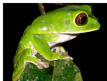
80 Phyllomedusa tarsius HYLIDAE