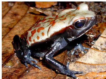
10 Rhaebo guttatus BUFONIDAE