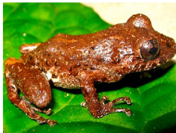
143 Pristimantis cf. diadematus STRABOMANTIDAE