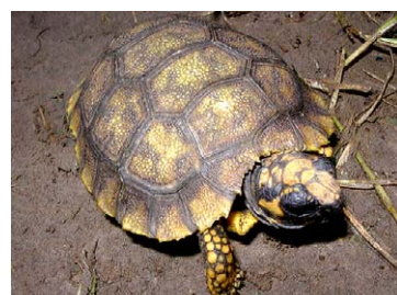
280 Chelonoidis denticulata TESTUDINIDAE