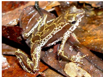
7 Atelopus spumarius BUFONIDAE