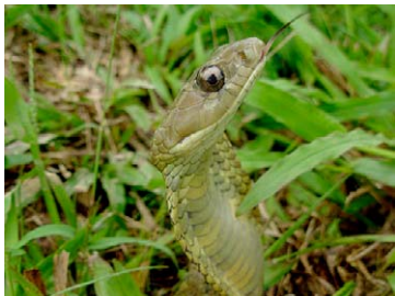
253 Xenodon severus COLUBRIDAE