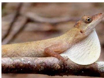
189 Anolis fuscoauratus POLYCHROTIDAE