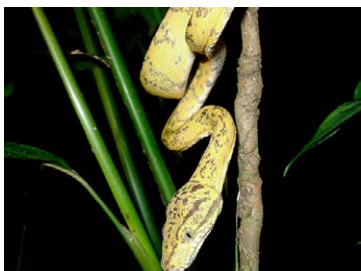
213 Corallus hortulanus BOIDAE