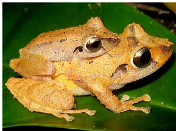
141 Pristimantis delius STRABOMANTIDAE

© Environmental & Conservation Programs, The Field Museum, Chicago, IL 60605 USA. [rrc@fieldmuseum.org] [www.fmh.org/animalguides/] Rapid Color Guide # 262 versión 1 01/2010