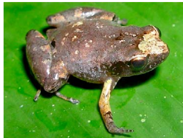
134 Noblella myrmecoides STRABOMANTIDAE