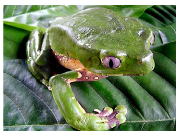
77 Phyllomedusa bicolor HYLIDAE