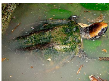
277 Platemys platycephala CHELIDAE