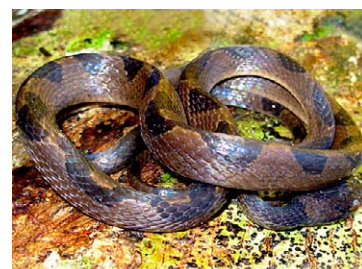
236 Leptodeira annulata COLUBRIDAE