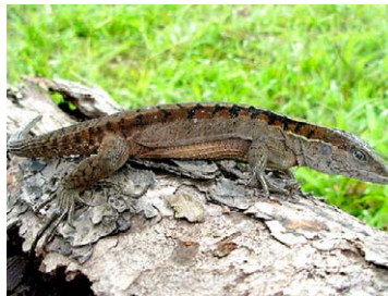
207 Kentropyx pelviceps TEIIDAE