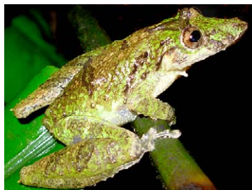
90 Scinax garbei HYLIDAE