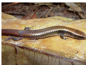
179 Iphisa elegans GYMNOPHTHALMIDAE