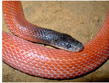
246 Pseudoboa coronata COLUBRIDAE