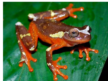
56 Dendropsophus sarayacuensis HYLIDAE