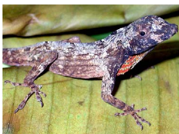
193 Anolis ortonii PHYLLODACTYLIDAE