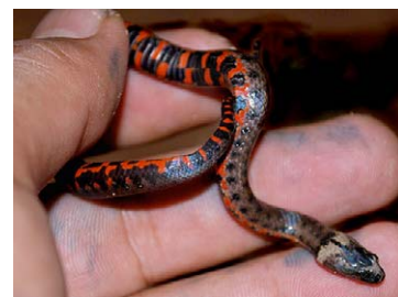
232 Helicops leopardinus COLUBRIDAE