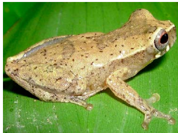
42 Dendropsophus cf. brevifrons HYLIDAE