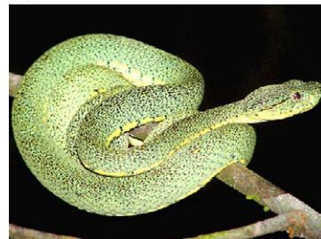
264 Bothriopsis bilineata VIPERIDAE