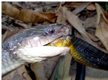
221 Clelia clelia COLUBRIDAE

© Environmental &amp; Conservation Programs, The Field Museum, Chicago, IL 60605 USA. [rrc@fieldmuseum.org] [www.fmh.org/animalguides/] Rapid Color Guide # 262 versión 1 01/2010