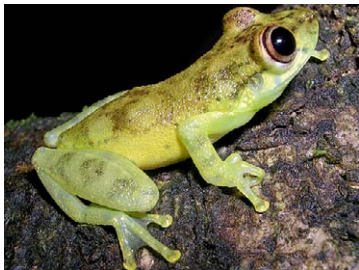
85 Scinax cruentommus HYLIDAE