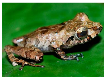
154 Pristimantis ockendeni STRABOMANTIDAE