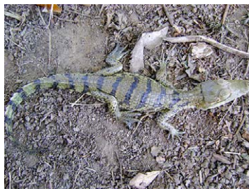
167 Caiman crocodylus ALIGATORIDAE