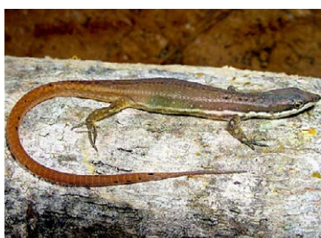
177 Cercosaura argulus GYMNOPHTHALMIDAE