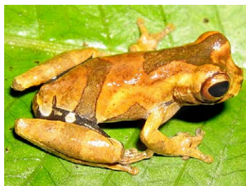
51 Dendropsophus parviceps HYLIDAE