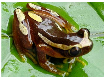
45 Dendropsophus leucophyllatus HYLIDAE