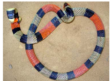
260 Micrurus obscurus ELAPIDAE