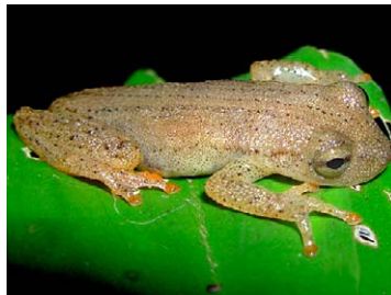
43 Dendropsophus haraldschultzi HYLIDAE