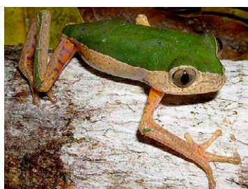
79 Phyllomedusa palliata HYLIDAE