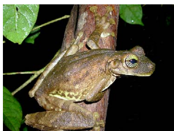
74 Osteocephalus taurinus HYLIDAE