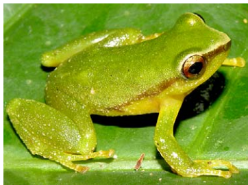
161 Pristimantis sp. nov. 2 STRABOMANTIDAE

[rrc@fieldmuseum.org] [www.fmnh.org/animalguides/] Rapid Color Guide # 262 versión 1 01/2010