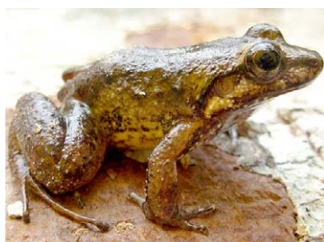
114 Leptodactylus petersii LEPTODACTYLIDAE