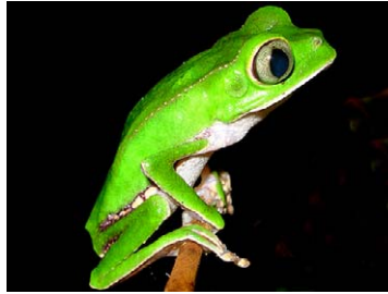
83 Phyllomedusa vaillantii HYLIDAE