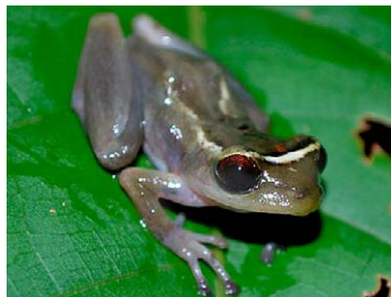
139 Pristimantis aurolineatus STRABOMANTIDAE