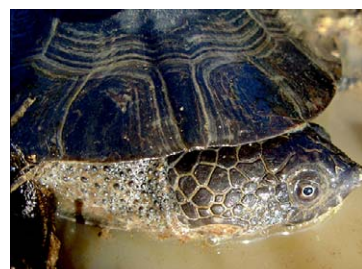
276 Mesoclemmys gibba CHELIDAE