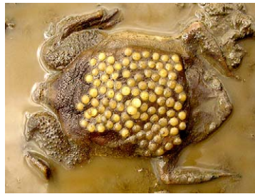
130 Pipa pipa PIPIDAE