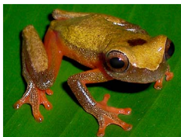
59 Dendropsophus triangulum HYLIDAE