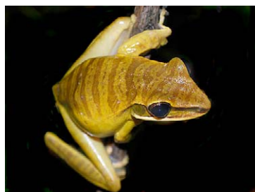
65 Hypsiboas lanciformis HYLIDAE