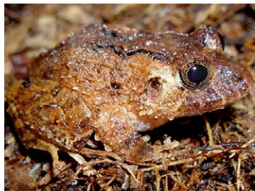
162 Strabomantis sulcatus STRABOMANTIDAE