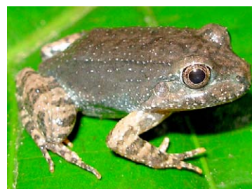
116 Leptodactylus cf. rhodonotus LEPTODACTYLIDAE