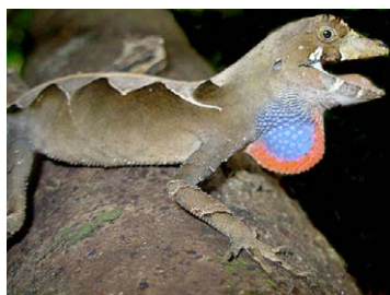
191 Anolis nitens scypheus POLYCHROTIDAE