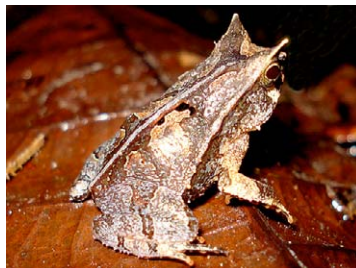
11 Rhinella ceratophrys BUFONIDAE