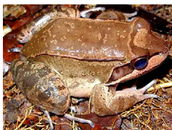
115 Leptodactylus rhodomystax LEPTODACTYLIDAE