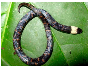
217 Atractus snethlageae COLUBRIDAE