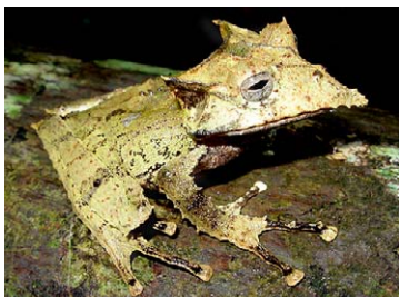
37 Hemiphractus proboscideus HEMIPHRACTIDAE