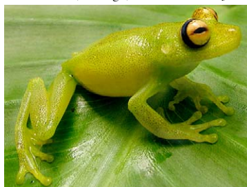
62 Hypsiboas cinerascens HYLIDAE