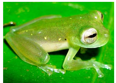
16 Teratohyla midas CENTROLENIDAE