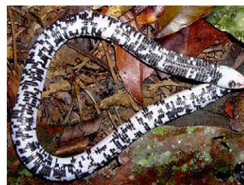
172 Amphisbaenia fuliginosa AMPHISBAENIDAE