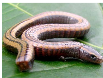
175 Bachia trisanale GYMNOPHTHALMIDAE