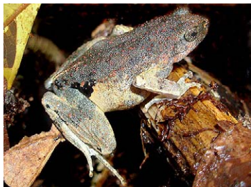
101 Engystomops freibergeri LEIUPERIDAE

[rrc@fieldmuseum.org] [www.fmh.org/animalguides/] Rapid Color Guide # 262 versión 1 01/2010