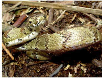
247 Pseustes poecilonotus COLUBRIDAE