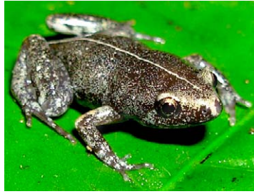
123 Chiasmocleis ventrimaculata MICROHYLIDAE