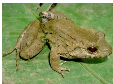
118 Leptodactylus wagneri LEPTODACTYLIDAE