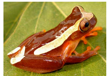
40 Dendropsophus bifurcus HYLIDAE