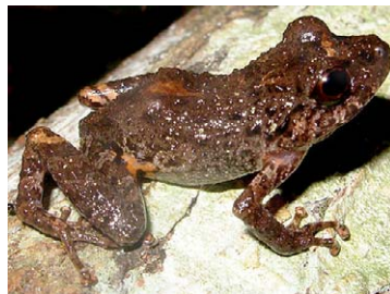
138 Pristimantis altamazonicus STRABOMANTIDAE