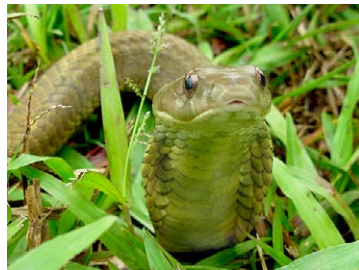
254 Xenodon severus COLUBRIDAE