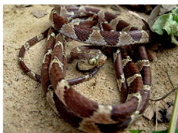
234 Imantodes cenchoa COLUBRIDAE