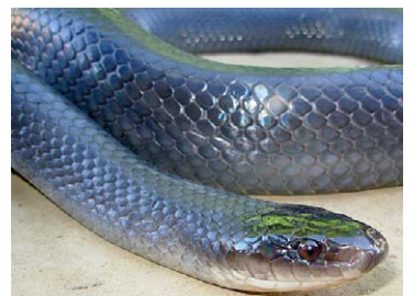
220 Clelia clelia COLUBRIDAE