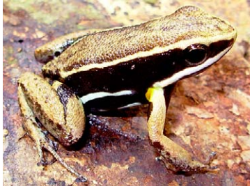
1 Allobates femoralis AROMOBATIDAE

[rrc@fieldmuseum.org] [www.fmh.org/animalguides/] Rapid Color Guide # 262 versión 1 01/2010