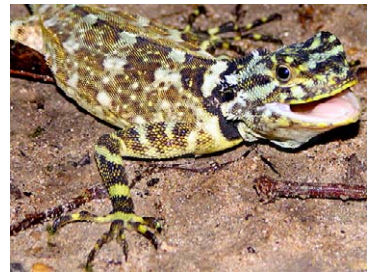
208 Plica plica TROPIDURIDAE