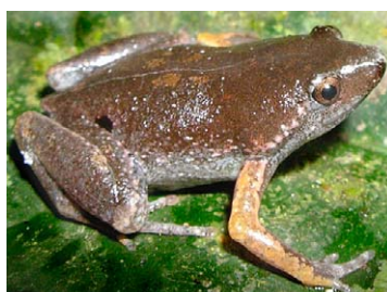
119 Chiasmocleis bassleri MICROHYLIDAE