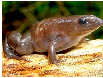
126 Synapturanus cf. rabus MICROHYLIDAE