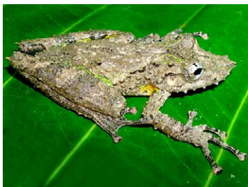
89 Scinax garbei HYLIDAE