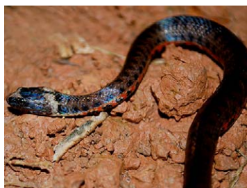
231 Helicops leopardinus COLUBRIDAE