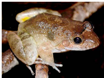
106 Leptodactylus diedrus LEPTODACTYLIDAE