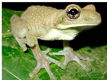
99 Trachycephalus venulosus HYLIDAE