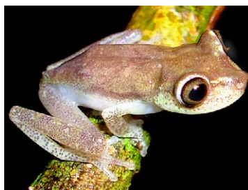
67 Hypsiboas nympa HYLIDAE