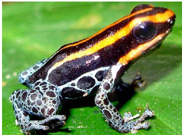
29 Ranitomeya duellmani DENDROBATIDAE