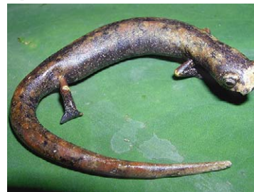
164 Bolitoglossa altamazonica PLETHODONTIDAE