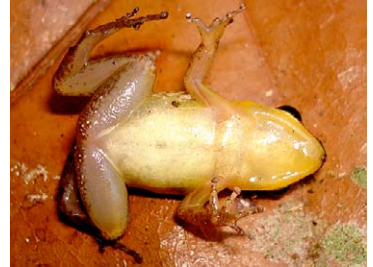
4 Allobates sp. 1 AROMOBATIDAE