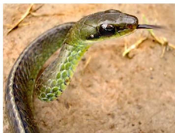
219 Chironius fuscus COLUBRIDAE