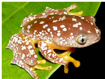
39 Cruziohyla craspedopus HYLIDAE