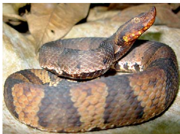
265 Bothrocophias hyoprora VIPERIDAE