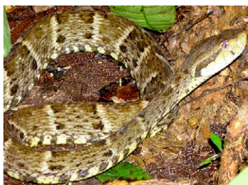
269 Bothrops atrox VIPERIDAE