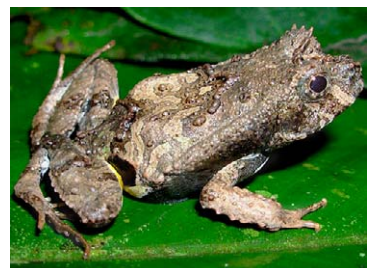
100 Edalorhina perezii LEIUPERIDAE