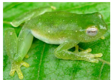
96 Sphaenorhynchus dorisae HYLIDAE