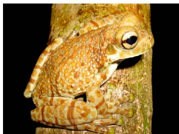
98 Trachycephalus resinifictrix HYLIDAE