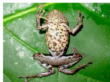
156 Pristimantis orcus STRABOMANTIDAE