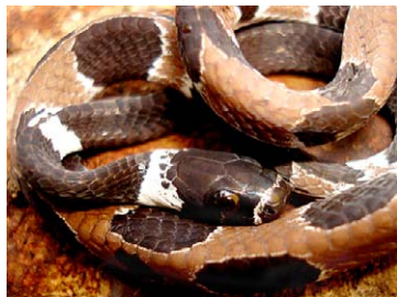
222 Dipsas catesbyi COLUBRIDAE