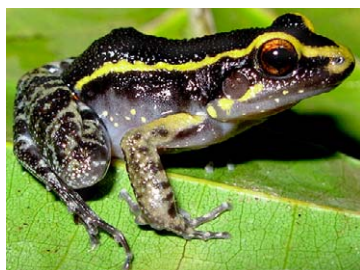
110 Leptodactylus lineatus LEPTODACTYLIDAE