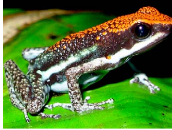
23 Ameerega parvula DENDROBATIDAE