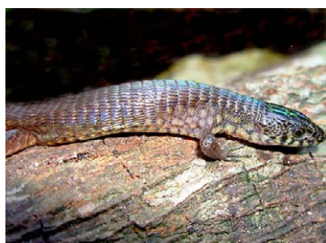
174 Arthrosaura reticulata GYMNOPHTHALMIDAE