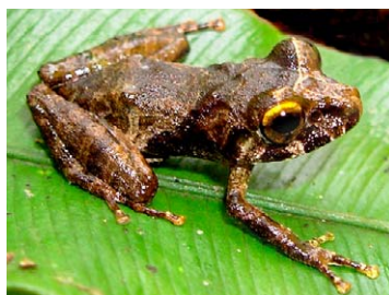
151 Pristimantis luscombei STRABOMANTIDAE