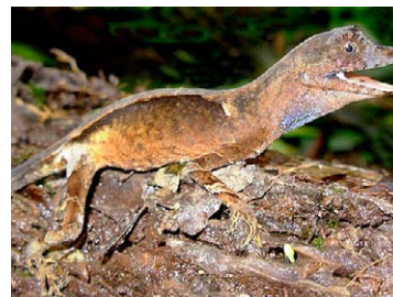
188 Anolis bombiceps POLYCHROTIDAE