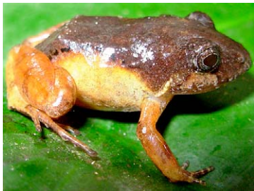
133 Hypodactylus nigrovittatus STRABOMANTIDAE