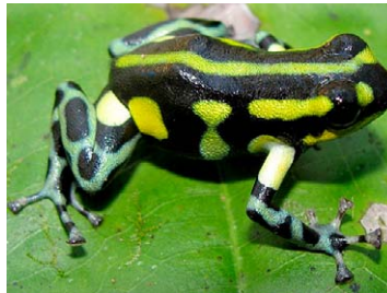
31 Ranitomeya lamasi DENDROBATIDAE