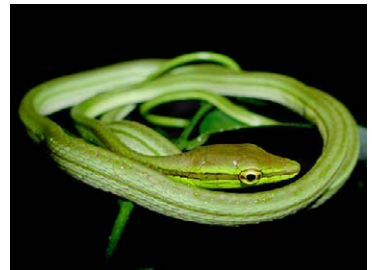
256 Xenoxybelis argenteus COLUBRIDAE