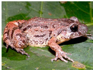
103 Leptodactylus andreae LEPTODACTYLIDAE