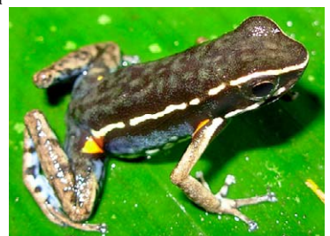
20 Ameerega altamazonica DENDROBATIDAE