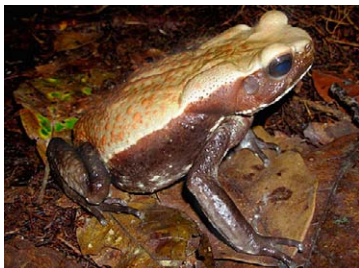
9 Rhaebo guttatus BUFONIDAE