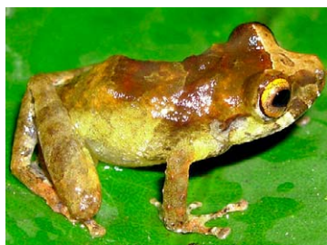
150 Pristimantis luscombei STRABOMANTIDAE