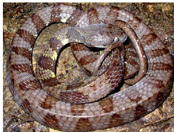
223 Dipsas indica COLUBRIDAE