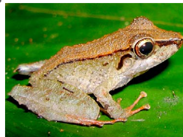
148 Pristimantis lanthanites STRABOMANTIDAE