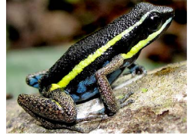
24 Ameerega cf. petersi DENDROBATIDAE