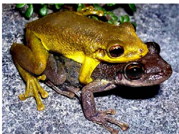
93 Scinax ruber HYLIDAE