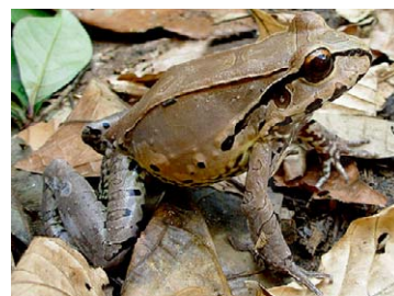
112 Leptodactylus pentadactylus LEPTODACTYLIDAE