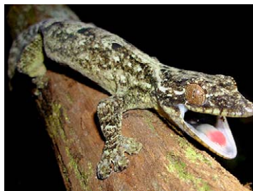
187 Thecadactylus solimoensis PHYLLODACTYLIDAE