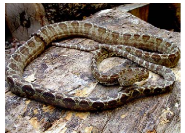
212 Corallus hortulanus BOIDAE