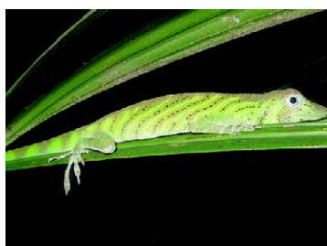
198 Anolis transversalis POLYCHROTIDAE