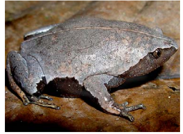
124 Ctenophryne geayi MICROHYLIDAE