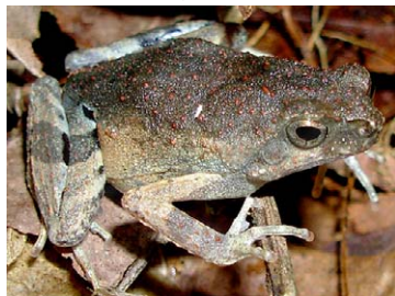
102 Engystomops petersi LEIUPERIDAE