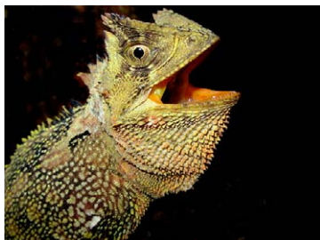
185 Enyalioides palpebralis HOPLOCERCIDAE