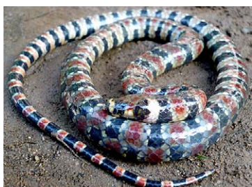
233 Hydrops martii COLUBRIDAE