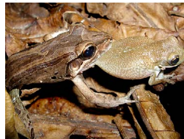
104 Leptodactylus bolivianus LEPTODACTYLIDAE