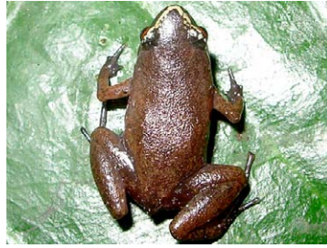
122 Chiasmocleis magna MICROHYLIDAE