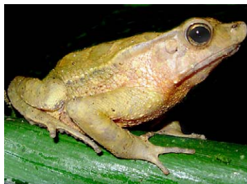
14 Rhinella margaritifera BUFONIDAE