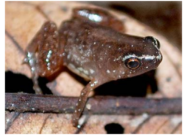
128 Syncope tridactyla MICROHYLIDAE