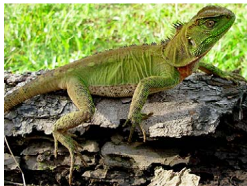
182 Enyalioides laticeps HOPLOCERCIDAE