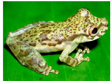
88 Scinax funereus HYLIDAE