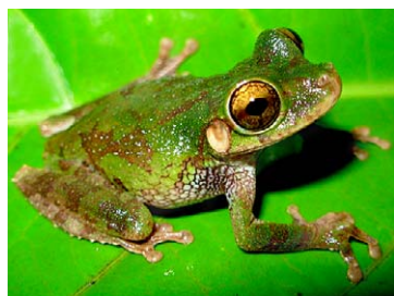
69 Osteocephalus buckleyi HYLIDAE