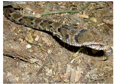
252 Xenodon rabdocephalus COLUBRIDAE