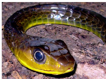
218 Chironius exoletus COLUBRIDAE