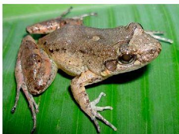
109 Leptodactylus cf. leptodactyloides LEPTODACTYLIDAE