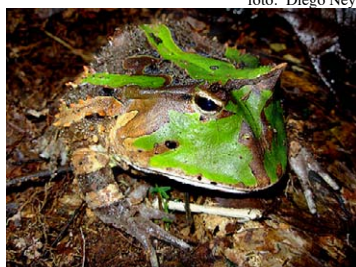
19 Ceratophrys cornuta CERATOPHRYDAE