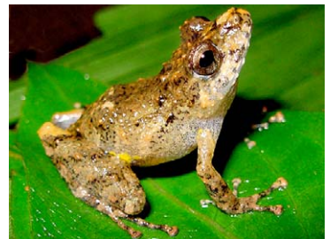
140 Pristimantis croceinguinis STRABOMANTIDAE