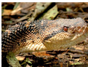
275 Lachesis muta VIPERIDAE