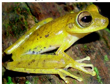
63 Hypsiboas fasciatus HYLIDAE