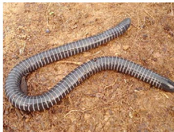
163 Siphonops annulatus CAECILIIDAE