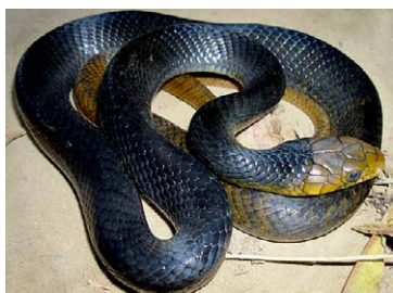
225 Drymarchon corais COLUBRIDAE