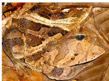
18 Ceratophrys cornuta CERATOPHRYDAE