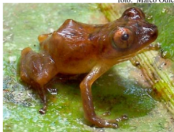
147 Pristimantis lacrimosus STRABOMANTIDAE