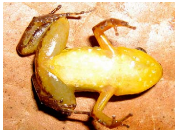
6 Allobates sp. 2 AROMOBATIDAE