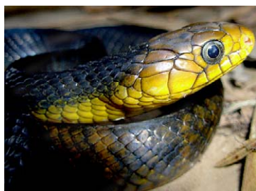
226 Drymarchon corais COLUBRIDAE