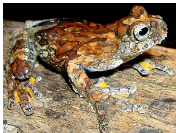
47 Dendropsophus marmoratus HYLIDAE