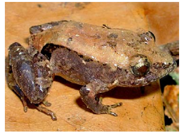
132 Hypodactylus nigrovittatus STRABOMANTIDAE