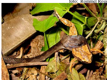
237 Leptodeira annulata COLUBRIDAE