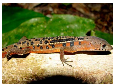
178 Cercosaura ocellata GYMNOPHTHALMIDAE