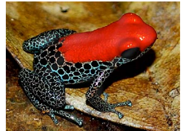
32 Ranitomeya reticulata DENDROBATIDAE