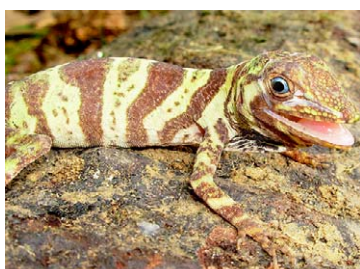
197 Anolis transversalis POLYCHROTIDAE