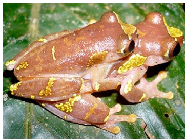
54 Dendropsophus sarayacuensis HYLIDAE