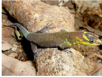
202 Gonatodes humeralis SPHAERODACTILYDAE