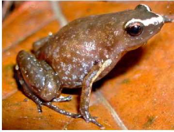
121 Chiasmocleis magna MICROHYLIDAE

[rrc@fieldmuseum.org] [www.fmh.org/animalguides/] Rapid Color Guide # 262 versión 1 01/2010