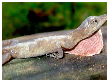
190 Anolis fuscoauratus POLYCHROTIDAE