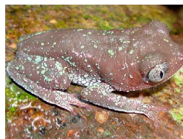
76 Phyllomedusa atelopoides HYLIDAE