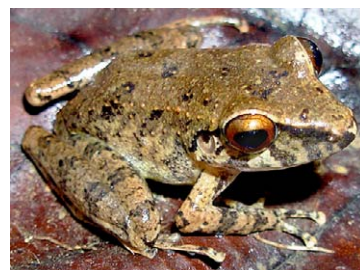
152 Pristimantis malkini STRABOMANTIDAE