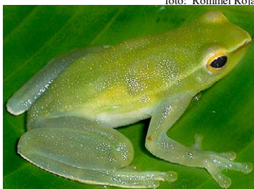
97 Sphaenorhynchus lacteus HYLIDAE