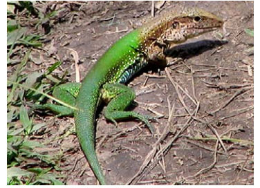
204 Ameiva ameiva TEIIDAE