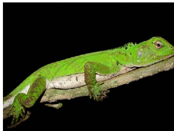
183 Enyalioides laticeps HOPLOCERCIDAE