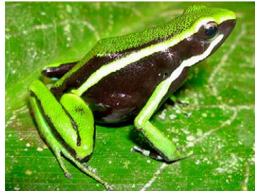
26 Ameerega trivittata DENDROBATIDAE