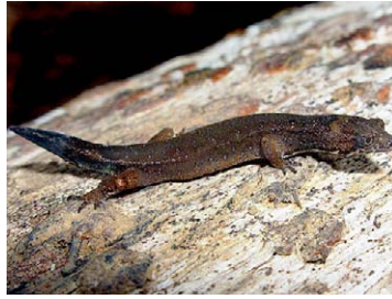
203 Pseudogonatodes guianensis SPHAERODACTILYDAE