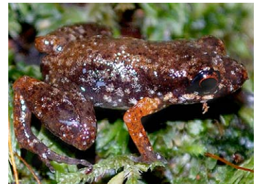
36 Adelophryne adiaastola ELEUTHERODACTYLIDAE