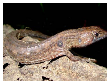
180 Potamites ecleopus GYMNOPHTHALMIDAE