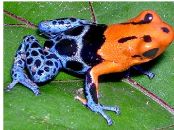
30 Ranitomeya fantastica DENDROBATIDAE