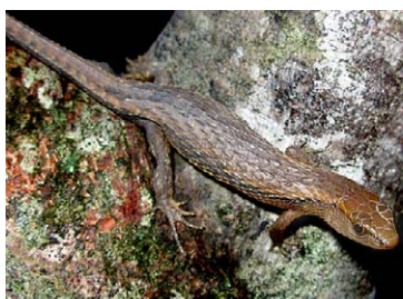
173 Alopoglossus cf. angulatus GYMNOPHTHALMIDAE