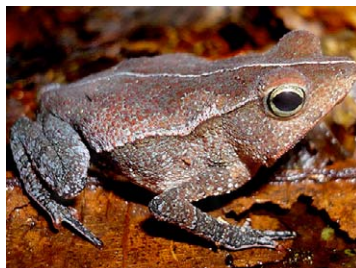
15 Rhinella margaritifera BUFONIDAE