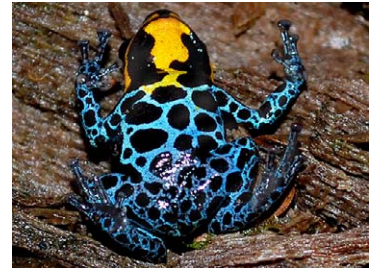
28 Ranitomeya amazonica DENDROBATIDAE