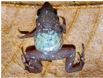
129 Syncope tridactyla MICROHYLIDAE