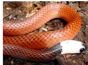
224 Drepanoides anomalus COLUBRIDAE