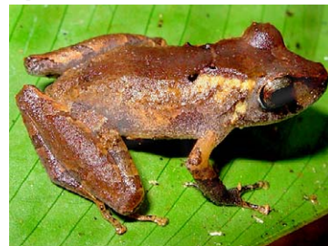
144 Pristimantis kichwarum STRABOMANTIDAE