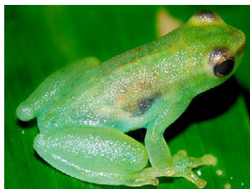
95 Sphaenorhynchus carneus HYLIDAE