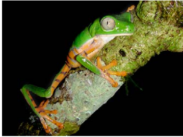
81 Phyllomedusa tomopterna HYLIDAE

[rrc@fieldmuseum.org] [www.fmh.org/animalguides/] Rapid Color Guide # 262 versión 1 01/2010