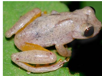
44 Dendropsophus leali HYLIDAE