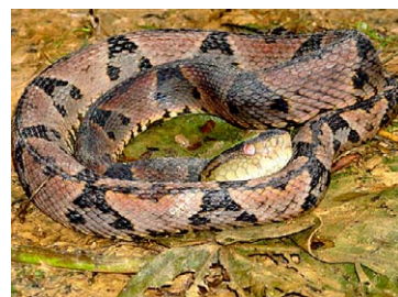
272 Bothrops brazili VIPERIDAE