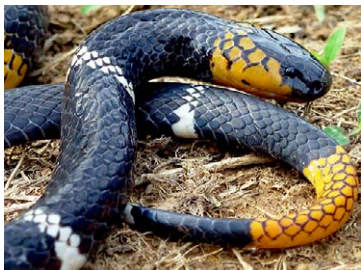
257 Micrurus hemprichii ELAPIDAE