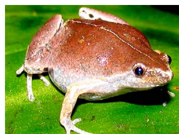
120 Chiasmocleis bassleri MICROHYLIDAE