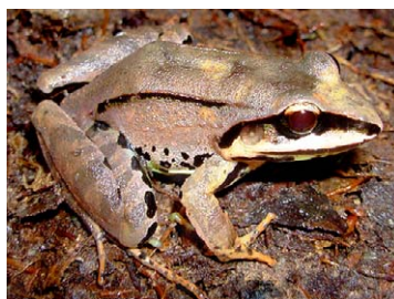
111 Leptodactylus mystaceus LEPTODACTYLIDAE