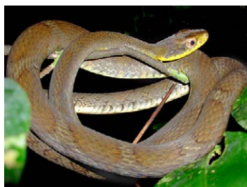
227 Drymobius rombifer COLUBRIDAE