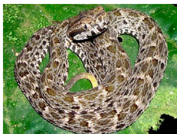
271 Bothrops atrox (juvenil) VIPERIDAE