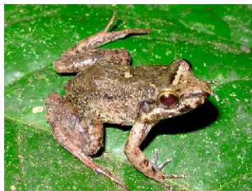
107 Leptodactylus discodactylus LEPTODACTYLIDAE