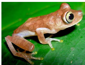
66 Hypsiboas microderma HYLIDAE