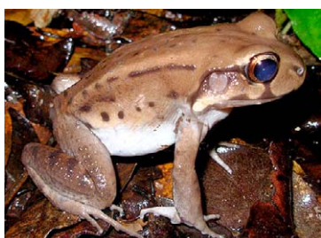
117 Leptodactylus stenodema LEPTODACTYLIDAE