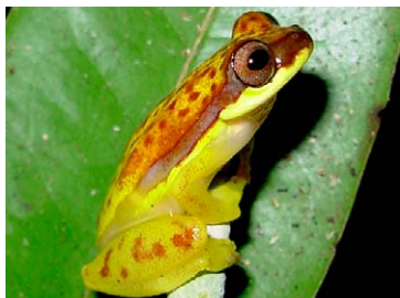
53 Dendropsophus rhodopeplus HYLIDAE