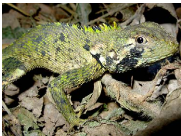
209 Plica umbra TROPIDURIDAE