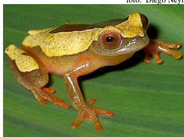
58 Dendropsophus triangulum HYLIDAE