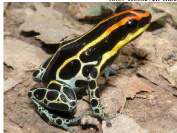
34 Ranitomeya uakarii DENDROBATIDAE