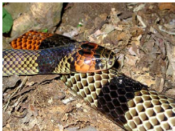
261 Micrurus obscurus ELAPIDAE

© Environmental &amp; Conservation Programs, The Field Museum, Chicago, IL 60605 USA. [rrc@fieldmuseum.org] [www.fmh.org/animalguides/] Rapid Color Guide # 262 versión 1 01/2010