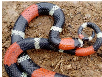
259 Micrurus lemniscatus ELAPIDAE