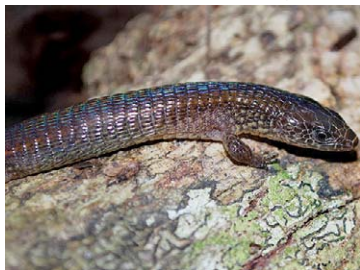
181 Ptychoglossus brevifrontalis GYMNOPHTHALMIDAE

© Environmental &amp; Conservation Programs, The Field Museum, Chicago, IL 60605 USA. [rrc@fieldmuseum.org] [www.fmh.org/animalguides/] Rapid Color Guide # 262 versión 1 01/2010