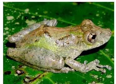
92 Scinax pedromedinae HYLIDAE