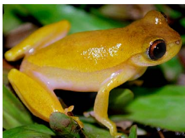
57 Dendropsophus triangulum HYLIDAE