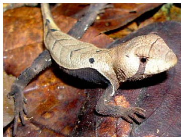
210 Stenocercus fimbriatus TROPIDURIDAE