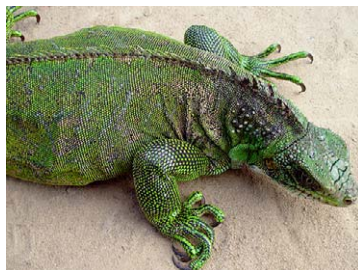
186 Iguana iguana IGUANIDAE