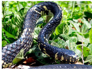
250 Spilotes pullatus COLUBRIDAE