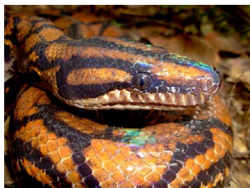
214 Epicrates cenchria BOIDAE