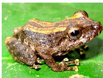
155 Pristimantis orcus STRABOMANTIDAE