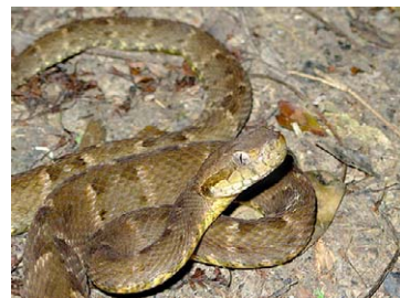
268 Bothrops atrox VIPERIDAE