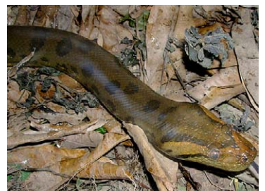
216 Eunectes murinus BOIDAE