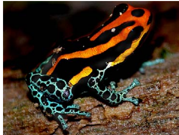
27 Ranitomeya amazonica DENDROBATIDAE