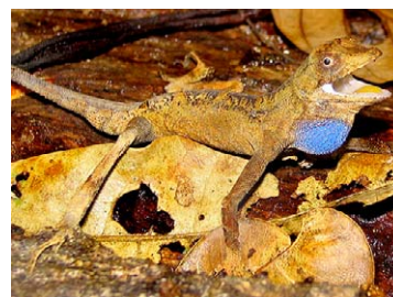
192 Anolis nitens tandai POLYCHROTIDAE