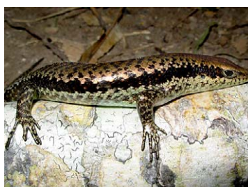
199 Mabuya altamazonica SCINCIDAE