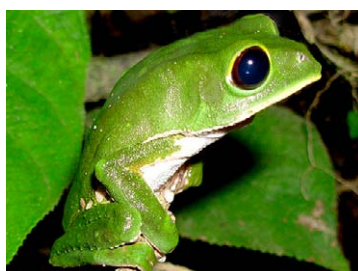
78 Phyllomedusa camba HYLIDAE