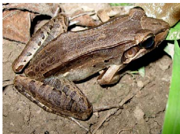
105 Leptodactylus bolivianus LEPTODACTYLIDAE