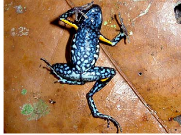
22 Ameerega hahneli DENDROBATIDAE