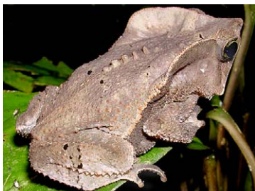
13 Rhinella margaritifera BUFONIDAE