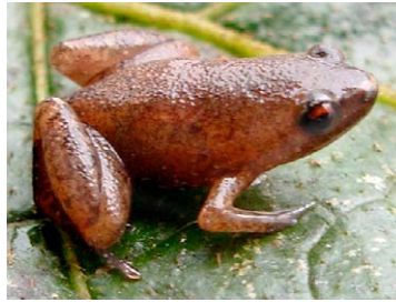
127 Syncope antenori MICROHYLIDAE