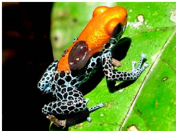
33 Ranitomeya reticulata DENDROBATIDAE