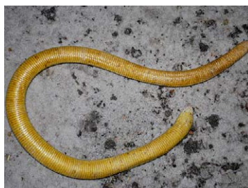
171 Amphisbaenia alba AMPHISBAENIDAE