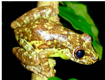
87 Scinax funereus HYLIDAE