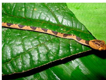
235 Imantodes lentiferus COLUBRIDAE