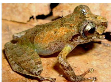
153 Pristimantis ockendeni STRABOMANTIDAE