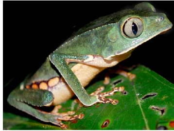
82 Phyllomedusa vaillantii HYLIDAE