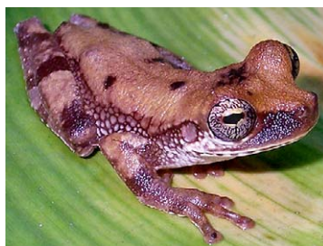
71 Osteocephalus deridens HYLIDAE