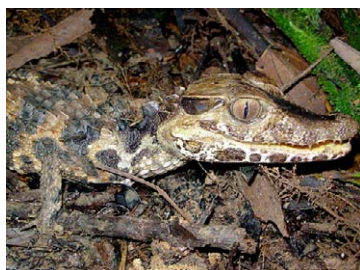
170 Paleosuchus trigonatus ALIGATORIDAE