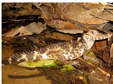
169 Paleosuchus trigonatus ALIGATORIDAE