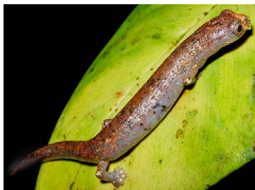
165 Bolitoglossa peruviana PLETHODONTIDAE