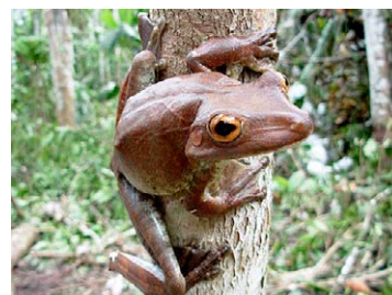
60 Hypsiboas boans HYLIDAE