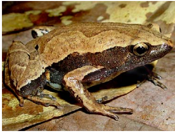
125 Hamptophryne boliviana MICROHYLIDAE