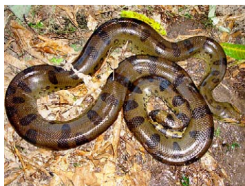
215 Eunectes murinus BOIDAE