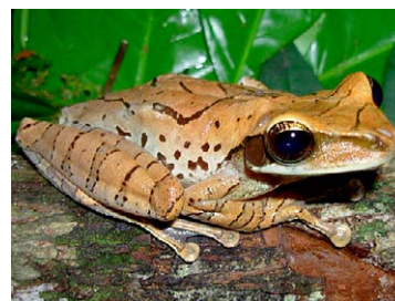
72 Osteocephalus planiceps HYLIDAE