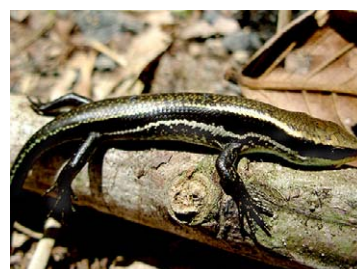
200 Mabuya bistrata SCINCIDAE