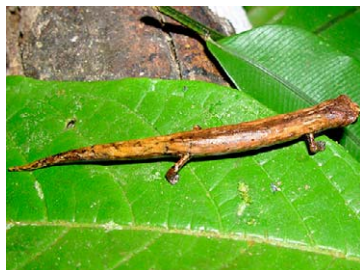
166 Bolitoglossa peruviana PLETHODONTIDAE