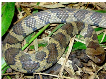
229 Helicops angulatus COLUBRIDAE