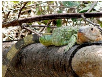
206 Dracaena guianensis TEIIDAE