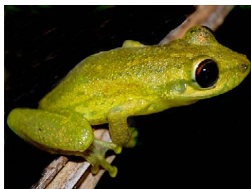
94 Scinax ruber HYLIDAE