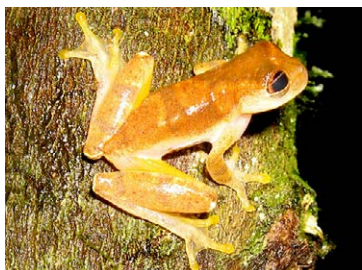
49 Dendropsophus cf. minutus HYLIDAE