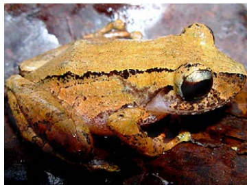
142 Pristimantis delius STRABOMANTIDAE