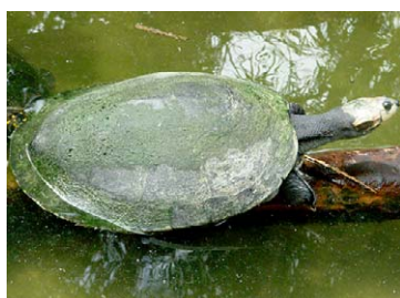
278 Podocnemis expansa PODOCNEMIDIDAE