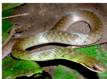
240 Liophis reginae COLUBRIDAE