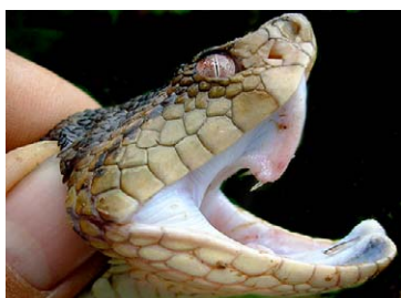
273 Bothrops brazili VIPERIDAE