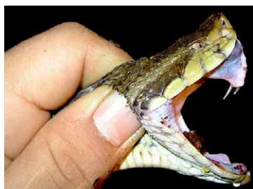
270 Bothrops atrox VIPERIDAE