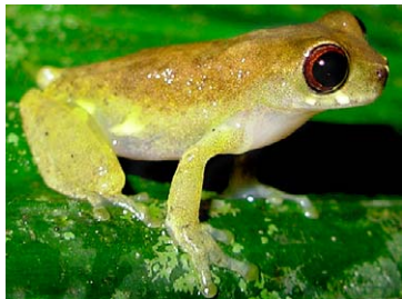
41 Dendropsophus cf. brevifrons HYLIDAE

© Environmental & Conservation Programs, The Field Museum, Chicago, IL 60605 USA. [rrc@fieldmuseum.org] [www.fmnh.org/animalguides/] Rapid Color Guide # 262 versión 1 01/2010