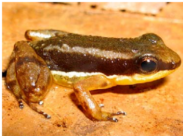
5 Allobates sp. 2 AROMOBATIDAE