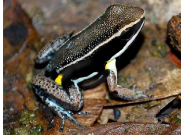
2 Allobates femoralis AROMOBATIDAE