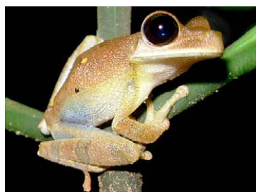
73 Osteocephalus subtilis HYLIDAE