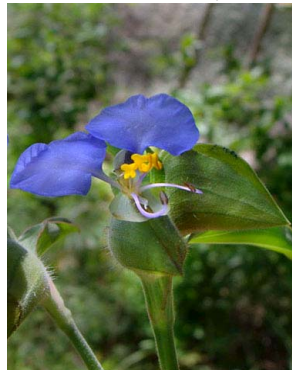
18 Commelina erecta COMMELINACEAE R.R.P.Ramos