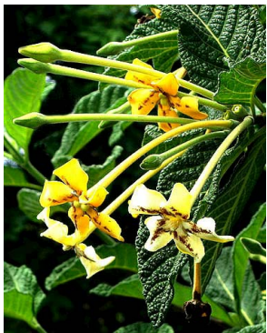
37 Tocoyena formosa RUBIACEAE