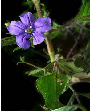
1 Ruellia paniculata ACANTHACEAE R.G.V. Camacho

© J.I.M de Melo [jose.tournefort@gmail.com] e demais autores. Agradecimentos à Suely S. Leal de Castro - Universidade do Estado do Rio Grande do Norte e à Universidade Estadual da Paraíba © ECCo, The Field Museum, Chicago, IL USA 60605 [rrc@fieldmuseum.org] [http://fieldmuseum.org/IDtools] Rapid Color Guide #302 versão 1 09/2011