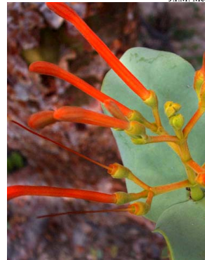
28 Psittacanthus cordatus LORANTHACEAE