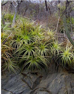
12 Encholirium spectabile BROMELIACEAE J.I.M. Melo