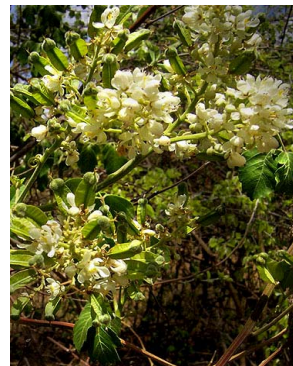
38 Serjania glabrata SAPINDACEAE