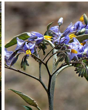
39 Solanum paniculatum SOLANACEAE