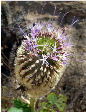
7 Pithecoseris pacourinoides ASTERACEAE R.R.P.Ramos