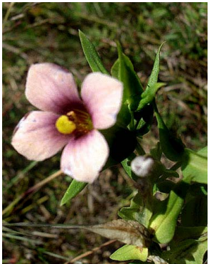
26 Schultesia pohliana GENTIANACEAE