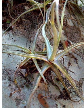
13 Tillandsia streptocarpa BROMELIACEAE J.I.M. Melo