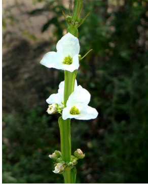
2 Echinodorus grandiflorus ALISMATACEAE R.G.V. Camacho