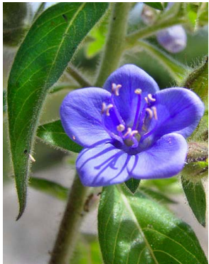
27 Hydrolea spinosa HYDROLEACEAE