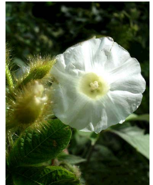
20 Merremia aegyptia CONVOLVULACEAE R.G.V. Camacho