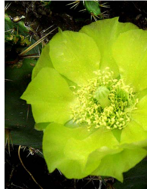
14 Opuntia dillenii CACTACEAE J.I.M. Melo