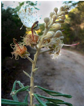
17 Capparis jacobinae CAPPARACEAE J.I.M. Melo