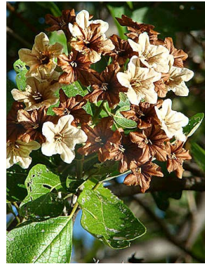
9 Cordia trichotoma BORAGINACEAE J.I.M. Melo