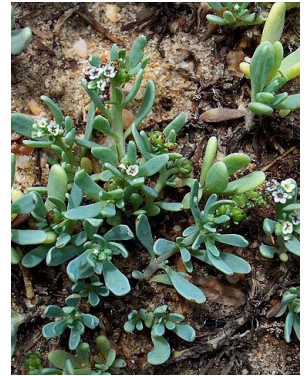
10 Heliotropium curassavicum BORAGINACEAE J.I.M. Melo