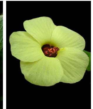
30 Pavonia cancellata MALVACEAE