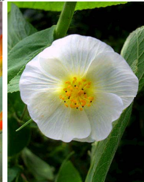
29 Herissantia tiubae MALVACEAE