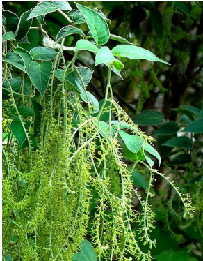
11 Tournefortia salzmannii BORAGINACEAE J.I.M. Melo