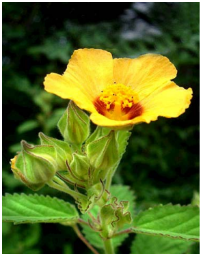
31 Sida galheirensis MALVACEAE