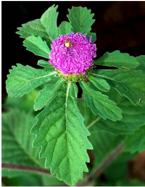
6 Centratherum punctatum ASTERACEAE R.R.P.Ramos