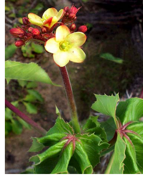
23 Jatropha mollissima EUPHORBIACEAE