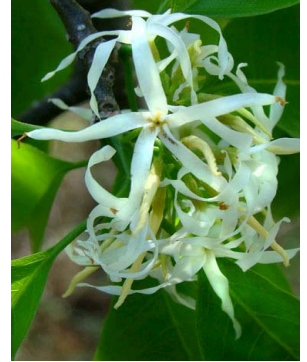
5 Aspidosperma pyrifolium APOCYNACEAE J.I.M. Melo