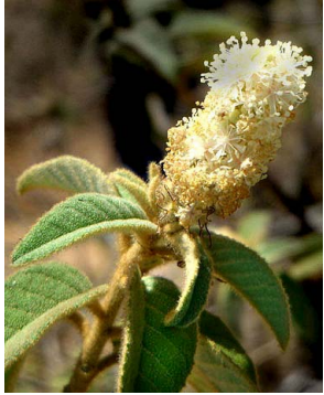
22 Croton heliotropiifolius EUPHORBIACEAE