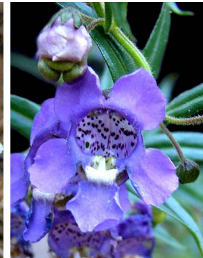
34 Angelonia biflora PLANTAGINACEAE