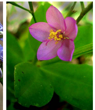
40 Talinum triangulare TALINACEAE