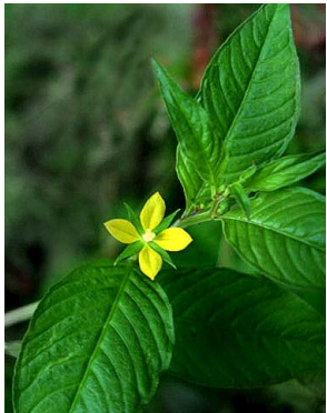
32 Ludwigia octovalvis ONAGRACEAE