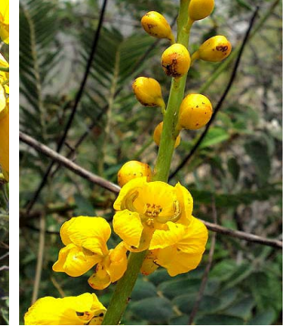
25 Senna martiana FABACEAE