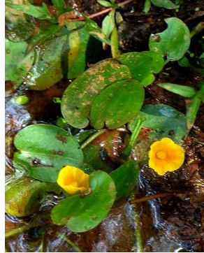
3 Hydrocleys modesta ALISMATACEAE J.I.M. Melo