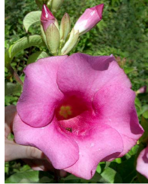
4 Allamanda blanchetii APOCYNACEAE E.E.A.D.Tölke