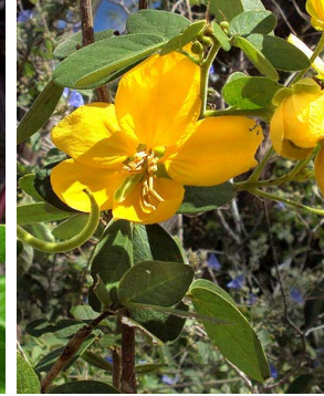
24 Senna macranthera FABACEAE