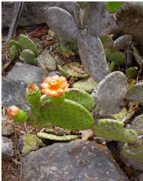
16 Tacinga inamoena CACTACEAE J.I.M. Melo