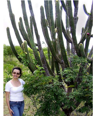
15 Pilosocereus gounellei CACTACEAE J.I.M. Melo