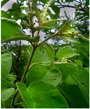
21 Croton blanchetianus EUPHORBIACEAE

© J.I.M de Melo [jose.tournefort@gmail.com] e demais autores. Agradecimentos à Suely S. Leal de Castro - Universidade do Estado do Rio Grande do Norte e à Universidade Estadual da Paraíba © ECCo, The Field Museum, Chicago, IL USA 60605 [rrc@fieldmuseum.org] [http://fieldmuseum.org/IDtools] Rapid Color Guide #302 versão 1 09/2011