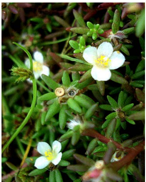
36 Portulaca halimoides PORTULACACEAE