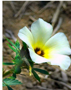
33 Turnera subulata PASSIFLORACEAE