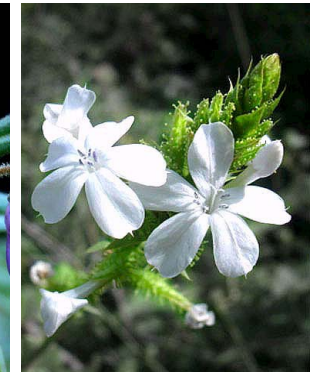
35 Plumbago scandens PLUMBAGINACEAE