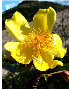
8 Cochlospermum vitifolium BIXACEAE J.I.M. Melo