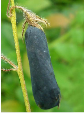
22 Crotalaria stipularia PAPILIONOIDEAE