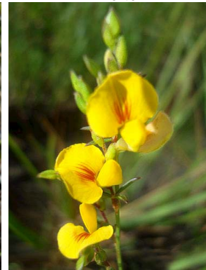
49 Zornia guanipensis PAPILIONOIDEAE