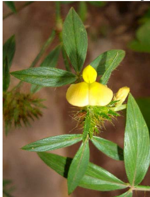
41 Stylosanthes guianensis PAPILIONOIDEAE

Rapid Color Guide # 322 versão 1 11/2011