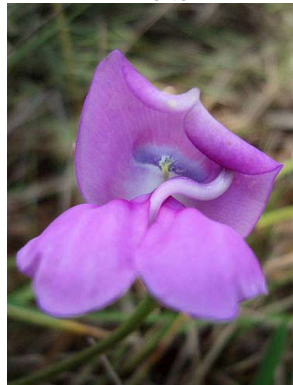
47 Vigna peduncularis PAPILIONOIDEAE