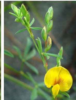
50 Zornia guanipensis PAPILIONOIDEAE