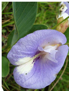
18 Clitoria simplicifolia PAPILIONOIDEAE Christiane Costa