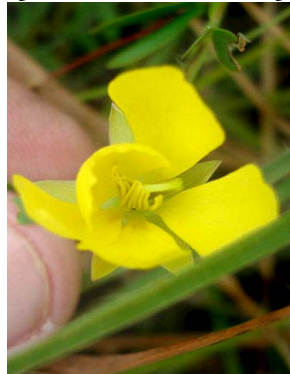
3 Chamaecrista diphylla CAESALPINIOIDEAE