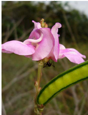
46 Vigna peduncularis PAPILIONOIDEAE