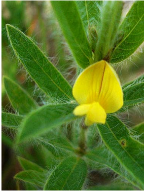
26 Eriosema crinitum PAPILIONOIDEAE