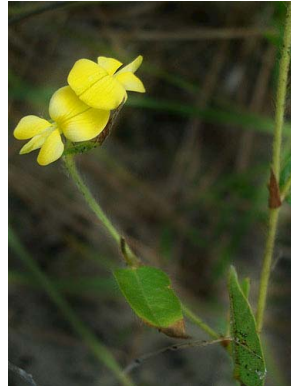
28 Eriosema simplicifolium PAPILIONOIDEAE