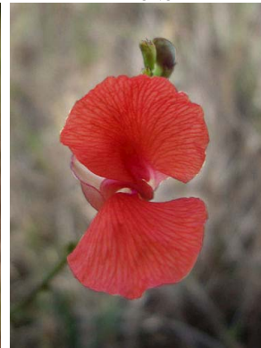
34 Macroptilium gracile PAPILIONOIDEAE