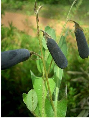
21 Crotalaria stipularia PAPILIONOIDEAE

Rapid Color Guide # 322 versão 1 11/2011