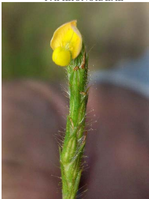
36 Stylosanthes angustifolia PAPILIONOIDEAE