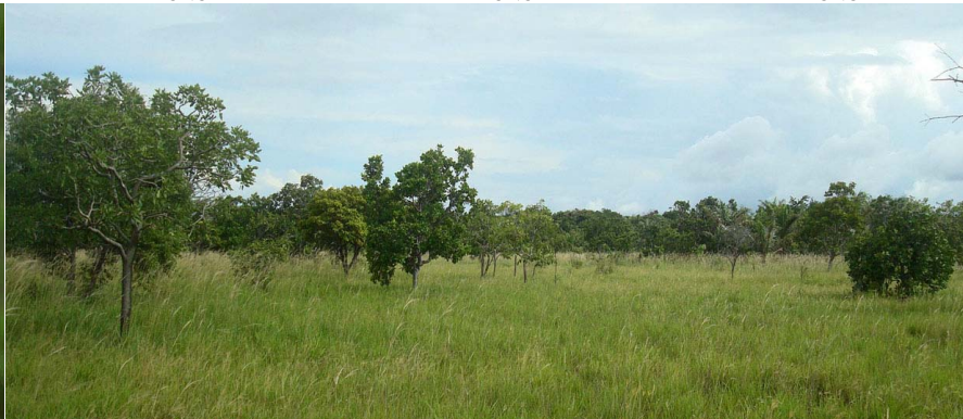
Fitofisionomia – Campo Cerrado