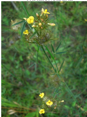
37 Stylosanthes gracilis PAPILIONOIDEAE