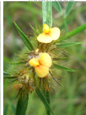
39 Stylosanthes gracilis PAPILIONOIDEAE