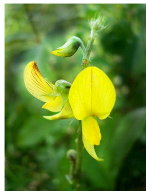
19 Crotalaria stipularia PAPILIONOIDEAE