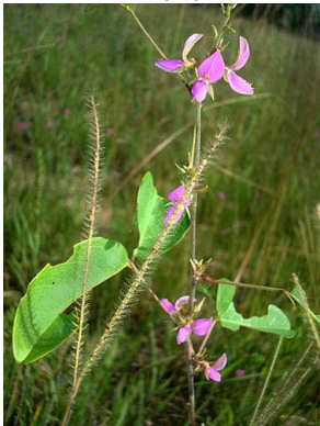
31 Galactia jussiaeana PAPILIONOIDEAE