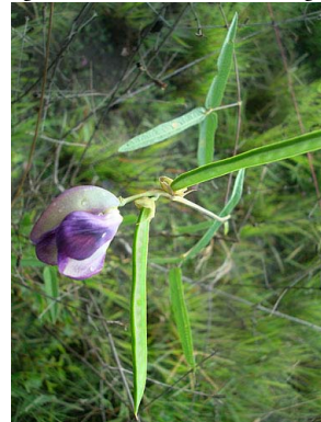
43 Vigna linearis PAPILIONOIDEAE