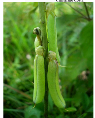
20 Crotalaria stipularia PAPILIONOIDEAE