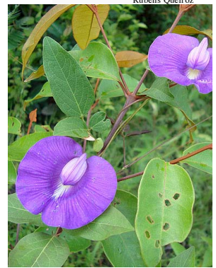
15 Centrosema brasilianum PAPILIONOIDEAE Christiane Costa