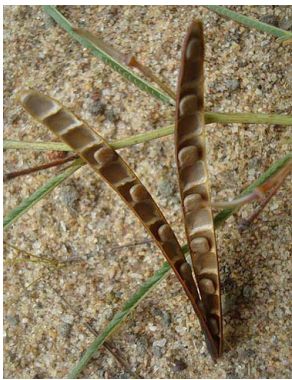
6 Chamaecrista flexuosa CAESALPINIOIDEAE