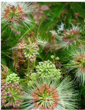
11 Hydrochoria corymbosa MIMOSOIDEAE