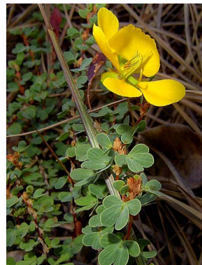
9 Chamaecrista ramosa CAESALPINIOIDEAE Rubens Queiroz