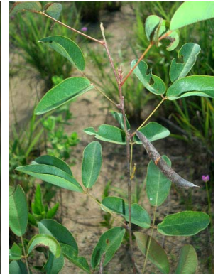
30 Galactia jussiaeana PAPILIONOIDEAE