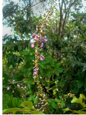
23 Dioclea sclerocarpa PAPILIONOIDEAE