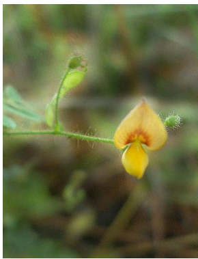
12 Aeschynomene brasiliana PAPILIONOIDEAE