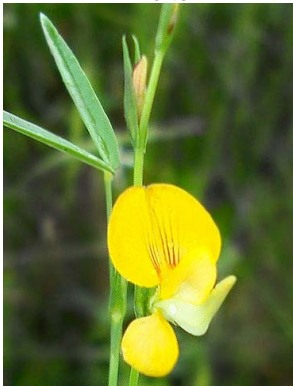
52 Zornia latifolia PAPILIONOIDEAE