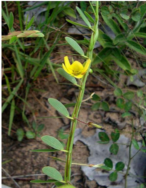
1 Chamaecrista diphylla CAESALPINIOIDEAE

Rapid Color Guide # 322 versão 1 11/2011