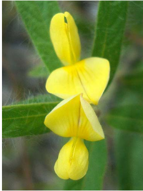
27 Eriosema crinitum PAPILIONOIDEAE