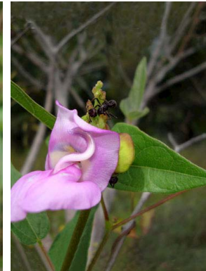
45 Vigna peduncularis PAPILIONOIDEAE