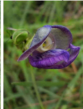
44 Vigna linearis PAPILIONOIDEAE