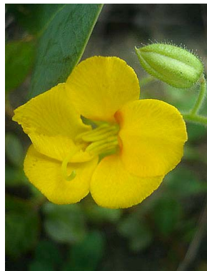
8 Chamaecrista hispidula CAESALPINIOIDEAE