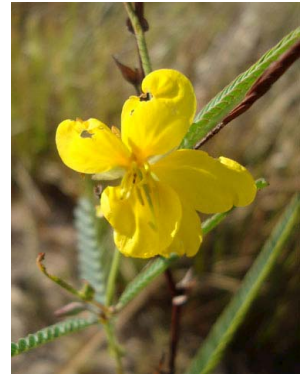
5 Chamaecrista flexuosa CAESALPINIOIDEAE