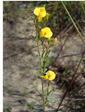
48 Zornia guanipensis PAPILIONOIDEAE