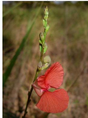
33 Macroptilium gracile PAPILIONOIDEAE