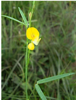
51 Zornia latifolia PAPILIONOIDEAE