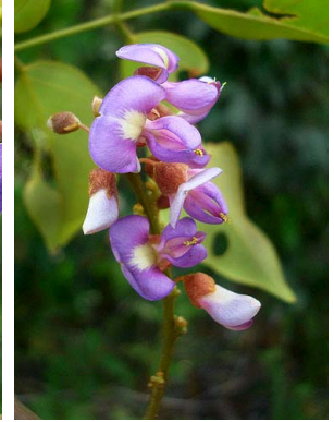
25 Dioclea sclerocarpa PAPILIONOIDEAE