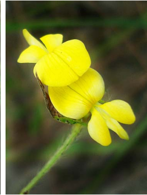
29 Eriosema simplicifolium PAPILIONOIDEAE