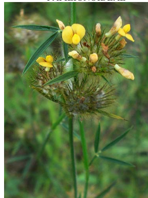
38 Stylosanthes gracilis PAPILIONOIDEAE