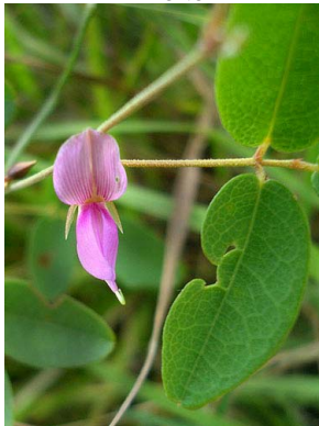
32 Galactia jussiaeana PAPILIONOIDEAE