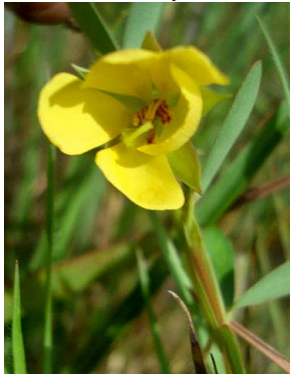
2 Chamaecrista diphylla CAESALPINIOIDEAE