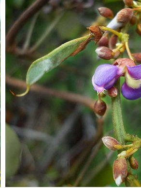
24 Dioclea sclerocarpa PAPILIONOIDEAE