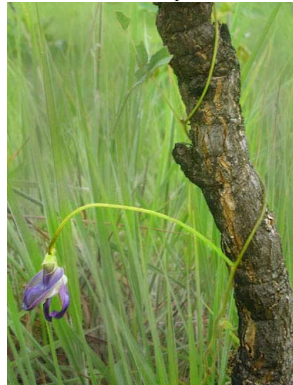
42 Vigna linearis PAPILIONOIDEAE