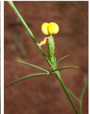
35 Stylosanthes angustifolia PAPILIONOIDEAE