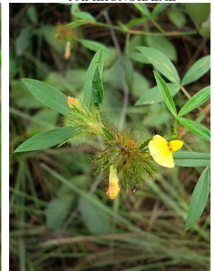
40 Stylosanthes guianensis PAPILIONOIDEAE