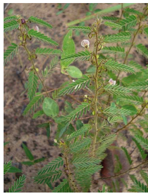
13 Aeschynomene histrix PAPILIONOIDEAE