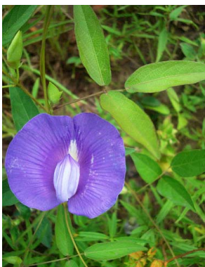
16 Centrosema brasilianum PAPILIONOIDEAE