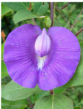
17 Centrosema brasilianum PAPILIONOIDEAE Christiane Costa