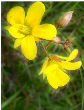
7 Chamaecrista hispidula CAESALPINIOIDEAE