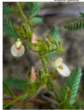
14 Aeschynomene histrix PAPILIONOIDEAE