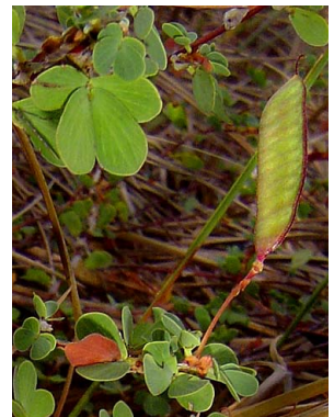
10 Chamaecrista ramosa CAESALPINIOIDEAE Rubens Queiroz