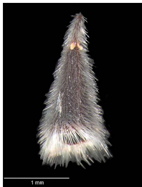
32 Polygala trichosperma semente