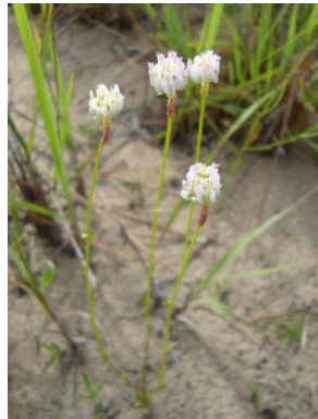
14 Polygala longicaulis