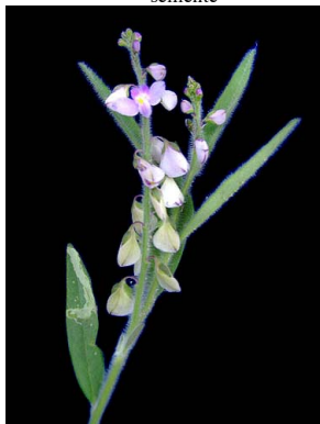
18 Polygala monticola