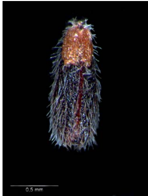
7 Polygala appressa semente