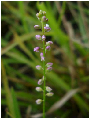
11 Polygala galioides