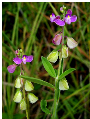
33 Polygala violacea