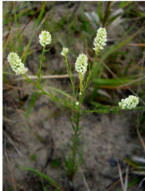
8 Polygala celosioides