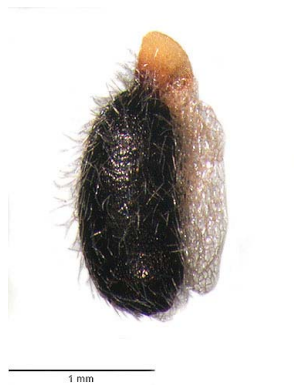
29 Polygala timoutou semente