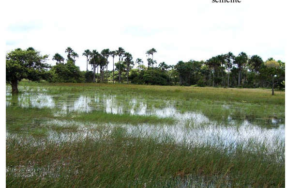
36 Campo Inundável