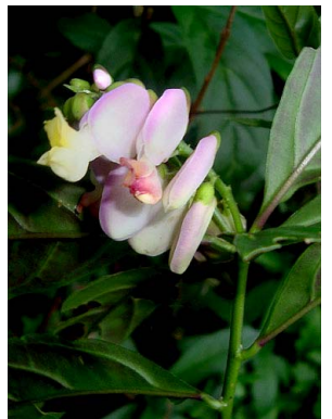
20 Polygala spectabilis