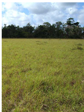
38 Campo Limpo