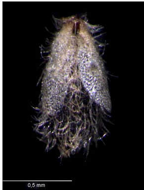
13 Polygala galioides semente