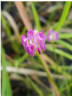
16 Polygala longicaulis