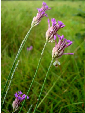
1 Polygala adenophora

Rapid Color Guide # 348 versão 1 01/2012