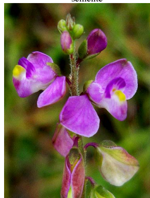
34 Polygala violacea