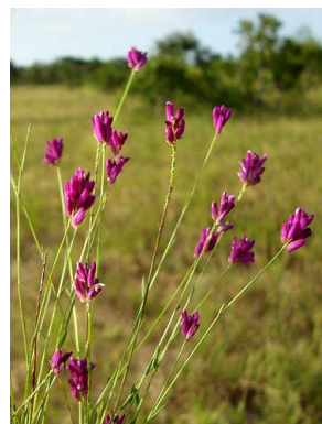
30 Polygala trichosperma