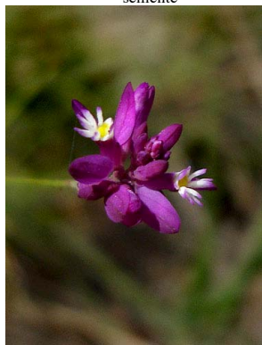
31 Polygala trichosperma