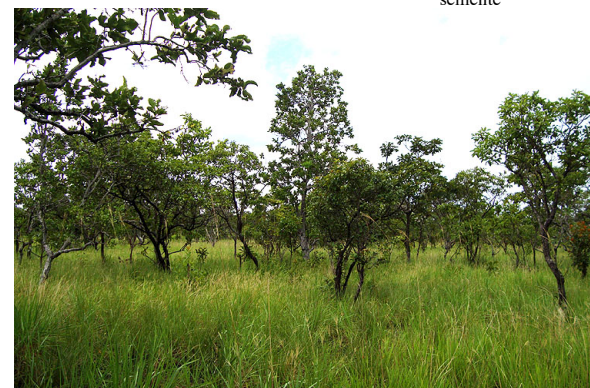
39 Campo Misto