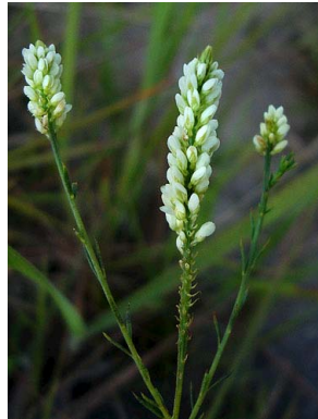
9 Polygala celosioides