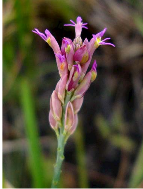
2 Polygala adenophora