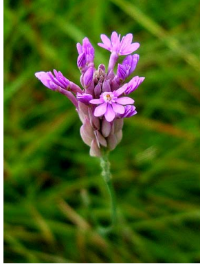
3 Polygala adenophora