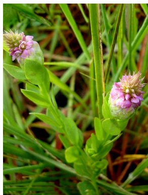
27 Polygala timoutou