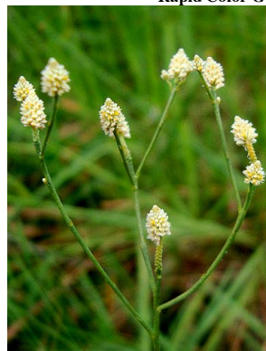
24 Polygala subtilis