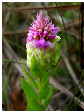
28 Polygala timoutou