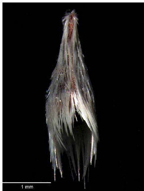
17 Polygala longicaulis semente