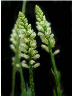
6 Polygala appressa