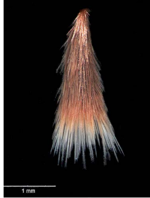
4 Polygala adenophora semente