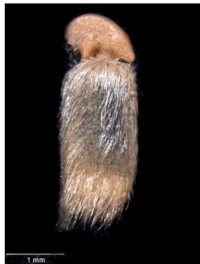
19 Polygala monticola semente