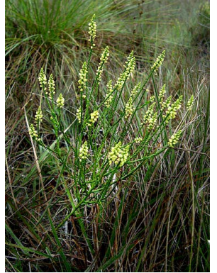
5 Polygala appressa