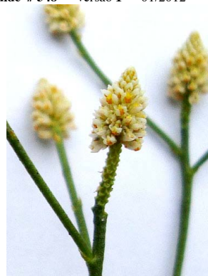
25 Polygala subtilis