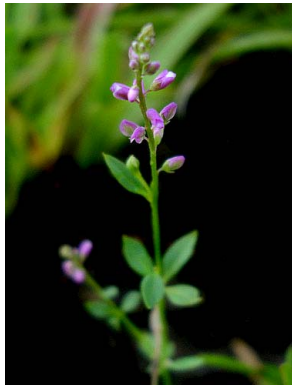
12 Polygala galioides