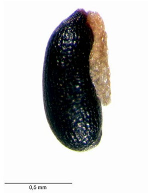
10 Polygala celosioides semente