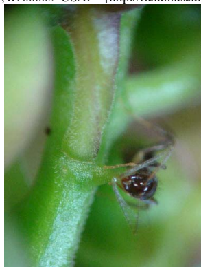
22 Polygala spectabilis com formiga - visitando glândula