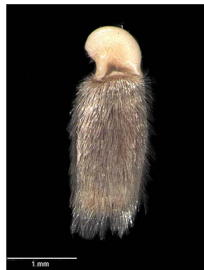
35 Polygala violacea semente