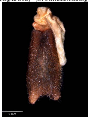
23 Polygala spectabilis semente