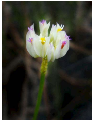
15 Polygala longicaulis