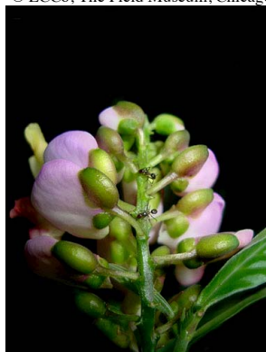
21 Polygala spectabilis com formigas na raque - visitando glândulas

Rapid Color Guide # 348 versão 1 01/2012