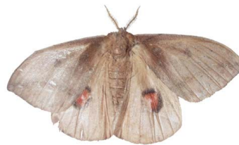
135 sp. Bombycoidea - Saturniidae