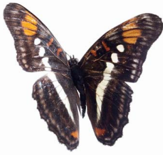
21 Adelpha celerio VD Papilionoidea - Nymphalidae

[fieldguides.fieldmuseum.org] [507] versión 1 6/2019