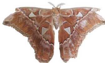
134 Rothschildia sp. VD Bombycoidea - Saturniidae