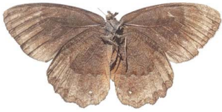
61 Pedaliodes sp. VV Papilionoidea - Nymphalidae

[fieldguides.fieldmuseum.org] [507] versión 1 6/2019