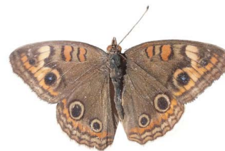
55 Junonia evarete (Mariposa Ojo de Venado) VD Papilionoidea - Nymphalidae