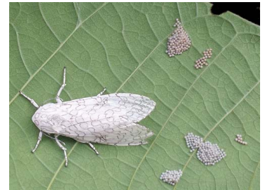
148 Hypercompe sp. ♀ (captada después de la oviposición) Noctuoidea - Erebidae