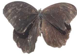
71 Pronophila sp. VD Papilionoidea - Nymphalidae