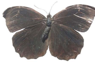
67 Pronophila sp. VD Papilionoidea - Nymphalidae