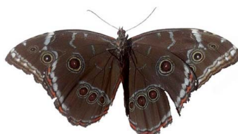
58 Morpho sp. VV Papilionoidea - Nymphalidae