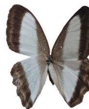
59 Oressinoma typha VD Papilionoidea - Nymphalidae