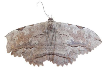
152 Thyrania zenobia VD Noctuoidea - Erebidae