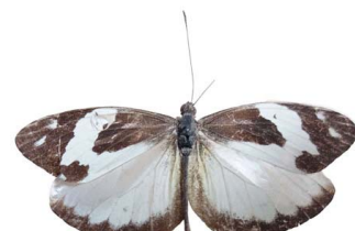
99 Dismorphia crisia foedora ♂ VD Papilionoidea - Pieridae