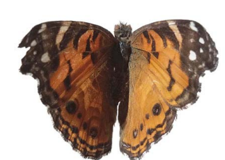
87 Vanessa virginiensis VD Papilionoidea - Nymphalidae