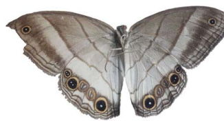
75 sp. Papilionoidea - Nymphalidae