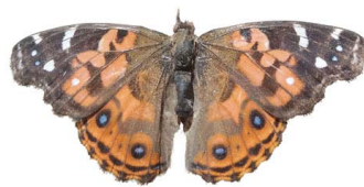
82 Vanessa braziliensis VD Papilionoidea - Nymphalidae