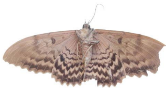
153 Thyrania zenobia VV Noctuoidea - Erebidae