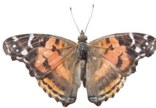
85 Vanessa myrinna VD Papilionoidea - Nymphalidae