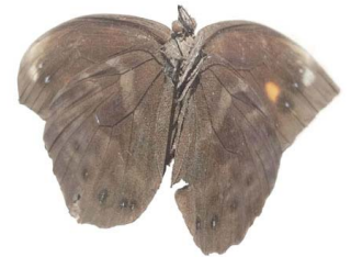
72 Pronophila sp. VV Papilionoidea - Nymphalidae