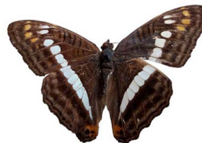
19 Adelpha alala VD Papilionoidea - Nymphalidae