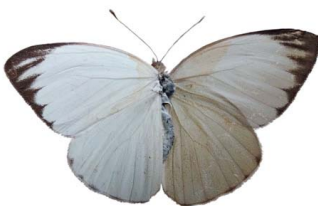
93 Ascia monuste VD Papilionoidea - Pieridae