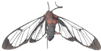
145 Cosmosoma sp. VD Noctuoidea - Erebidae