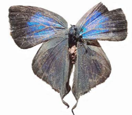
12 sp. Papilionoidea - Lycaenidae