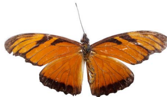
46 Dione junio VD Papilionoidea - Nymphalidae