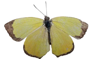
108 Eurema salome ♂ VD Papilionoidea - Pieridae