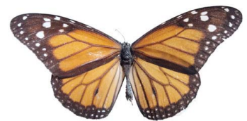
40 Danaus plexippus ♂ (Mariposa Monarca) VD Papilionoidea - Nymphalidae