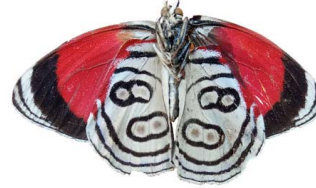
43 Diaethria sp. (Mariposa ochenta y ocho) VV Papilionoidea - Nymphalidae