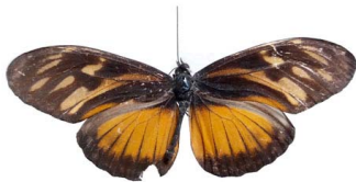
49 Eueides procula kuenowii VD Papilionoidea - Nymphalidae