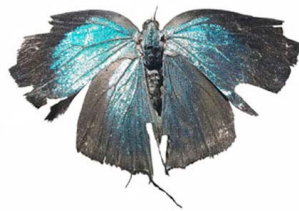
10 Panthiades sp. VD Papilionoidea - Lycaenidae