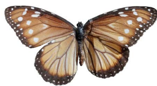
38 Danaus gilippus ♀ (Mariposa Reina) VD Papilionoidea - Nymphalidae