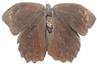
69 Pronophila sp. VD Papilionoidea - Nymphalidae