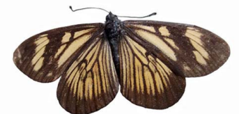
16 Actinote equatoria VD Papilionoidea - Nymphalidae