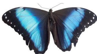
57 Morpho sp. VD Papilionoidea - Nymphalidae