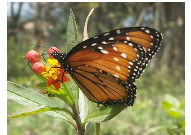
36 Danaus gilippus (Mariposa Reina) Lib. Papilionoidea - Nymphalidae