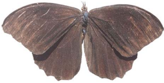
65 Pronophila sp. VD Papilionoidea - Nymphalidae