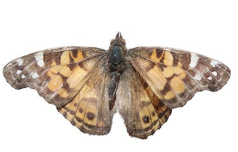
88 Vanessa virginiensis VD Papilionoidea - Nymphalidae