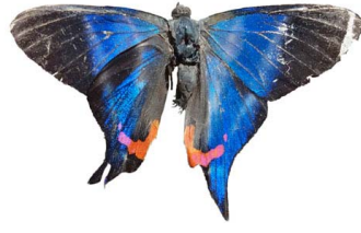
122 Rhetus dysonii caligosus ♂ VD Papilionoidea - Riodinidae