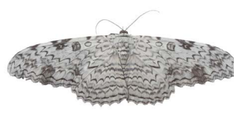
151 Thyrania agrippina (Mariposa Emperador, diablo blanco) VD Noctuoidea - Erebidae