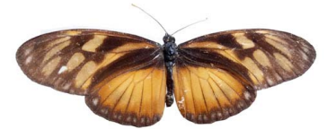
48 Eueides procula edias VD Papilionoidea - Nymphalidae