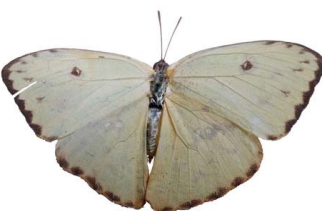
117 Phoebis sennae marcellina ♀ (Mariposa Azufre) VD Papilionoidea - Pieridae