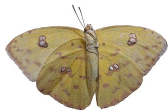
118 Phoebis sennae marcellina ♀ (Mariposa Azufre) VV Papilionoidea - Pieridae