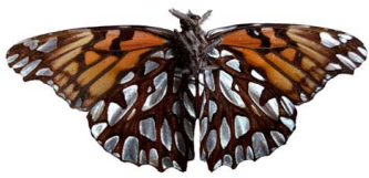
45 Dione glycera (Pasionaria andina) VV Papilionoidea - Nymphalidae