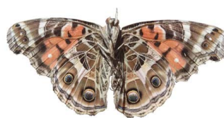
83 Vanessa braziliensis VV Papilionoidea - Nymphalidae