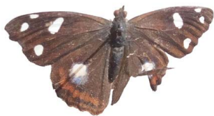
33 Cybdelis mnasylyus VD Papilionoidea - Nymphalidae