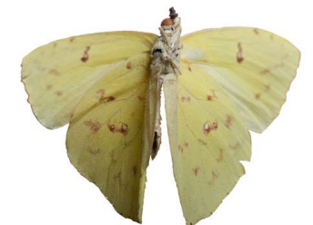
120 Phoebis sennae marcellina ♂ (Mariposa Azufre) VV Papilionoidea - Pieridae