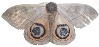
125 Automeris sp. VD Bombycoidea - Saturniidae