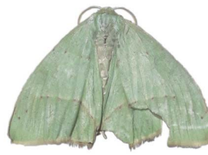
143 Phyle sp. VD Geometroidea - Geometridae