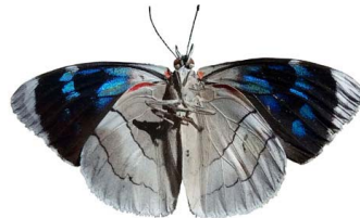
63 Perisama sp. VV Papilionoidea - Nymphalidae