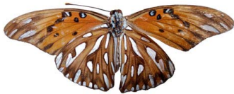
25 Agraulis vanillae (Mariposa Espejito) VV Papilionoidea - Nymphalidae