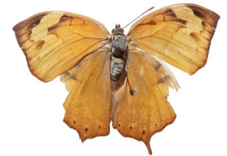
52 Fountainea sp. VD Papilionoidea - Nymphalidae