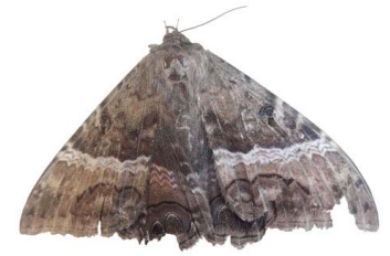
144 Ascalapha odorata VD Noctuoidea - Erebidae