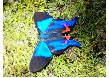
124 Rhetus dysonii caligosus ♂ Papilionoidea - Riodinidae