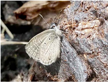
9 Hemiargus hanno bogotana Papilionoidea - Lycaenidae