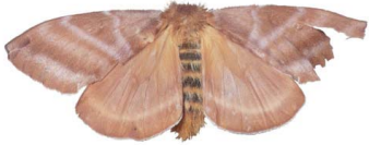
129 Hylesia sp. ♀ (captada después de la oviposición) Bombycoidea - Saturniidae