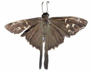
4 Urbanus dorantes VD Hesperioidae - Hesperiiidae