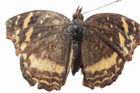
27 Anthanassa drusilla (Mariposa creciente) VD Papilionoidea - Nymphalidae