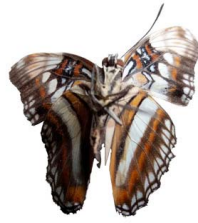
22 Adelpha celerio VV Papilionoidea - Nymphalidae