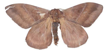
128 Hylesia sp. VD Bombycoidea - Saturniidae