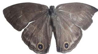
74 sp. Papilionoidea - Nymphalidae