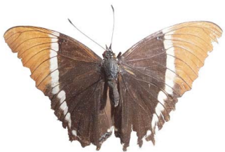
73 Siproeta epaphus (Chocolatosa) VD Papilionoidea - Nymphalidae