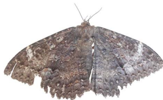
154 Ramphia sp. VD Noctuoidea - Noctuidae