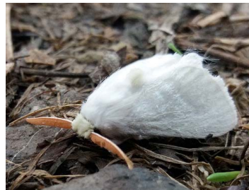
155 Norape ovina (Polilla de franela blanca) Zygaenoidea - Megalopygidae