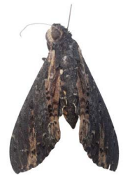
136 sp. Bombycoidea - Sphingidae