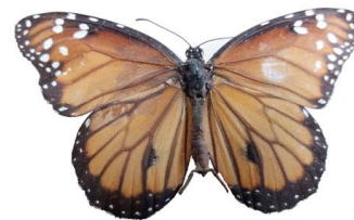
35 Danaus gilippus ♂ (Mariposa Reina) VD Papilionoidea - Nymphalidae