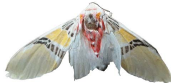
150 Idalus sp. VD Noctuoidea - Erebidae