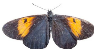
18 Actinote stratonice stratonice VD Papilionoidea - Nymphalidae