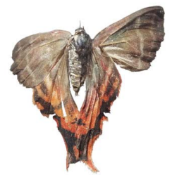
140 Erateina sp. VD Geometroidea - Geometridae