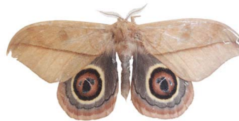
131 Leucanella sp. VD Bombycoidea - Saturniidae