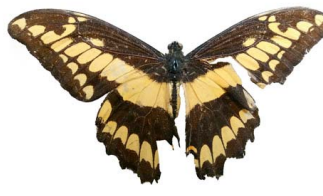
91 Papilio (Heraclides) sp. (Limонера grande, Alas de golondrina)VD Papilionoidea - Papilionidae