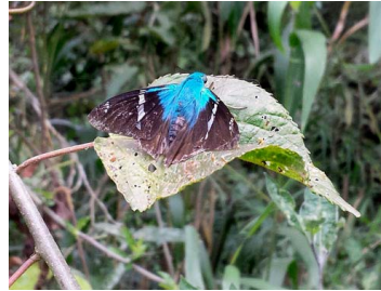
3 Astraptus fulgerator (Saltarina azul de dos barras) Hesperioidae - Hesperiiidae