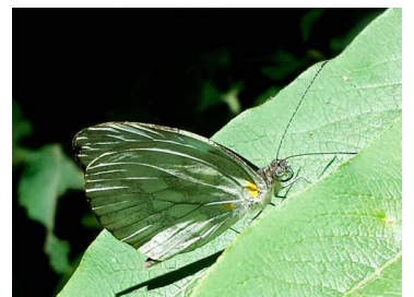
100 Dismorphia crisia foedora ♂ Papilionoidea - Pieridae