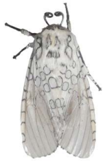
149 Hypercompe sp. Noctuoidea - Erebidae