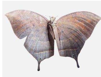
51 Fountainea nessus ♀ (Mariposa hoja) VV Papilionoidea - Nymphalidae