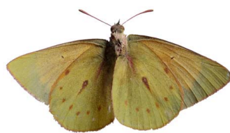
98 Colias dimera ♂ VV Papilionoidea - Pieridae