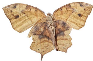
53 Fountainea sp. VV Papilionoidea - Nymphalidae