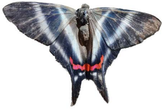
121 Rhetus dysonii caligosus ♀ VD Papilionoidea - Riodinidae

[fieldguides.fieldmuseum.org] [507] versión 1 6/2019