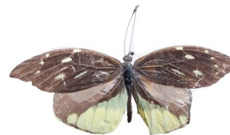
115 Lieinix nemesis nemesis ♂ (Mariposa Conejita) VD Papilionoidea - Pieridae