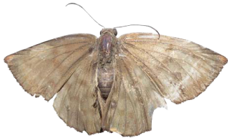
1 Achlyodes pallida VD Hesperioidae - Hesperiiidae

[fieldguides.fieldmuseum.org] [507] versión 1 6/2019