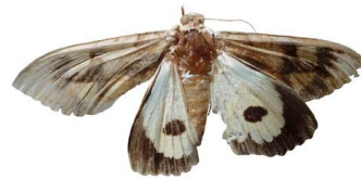
147 Eudocima sp. VD Noctuoidea - Erebidae