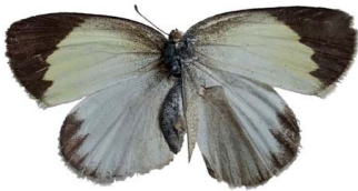
105 Eurema elathea vitellina ♀ VD Papilionoidea - Pieridae