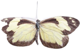
101 Dismorphia hyposticta hyposticta ♀ VD Papilionoidea - Pieridae

[fieldguides.fieldmuseum.org] [507] versión 1 6/2019