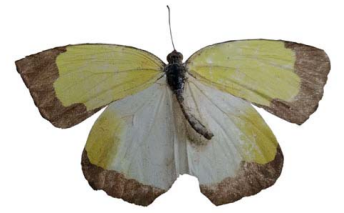
104 Eurema arbela gratiosa VD Papilionoidea - Pieridae