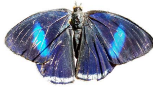
42 Diaethria sp. (Mariposa ochenta y ocho) VD Papilionoidea - Nymphalidae