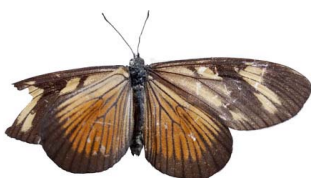
17 Actinote sp. Papilionoidea - Nymphalidae