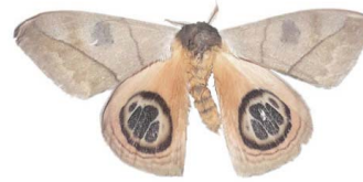
127 Automeris sp. VD Bombycoidea - Saturniidae