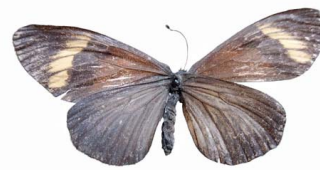
15 Actinote callianira ♂ VD Papilionoidea - Nymphalidae