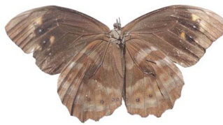
70 Pronophila sp. VV Papilionoidea - Nymphalidae