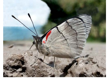
64 Perisama sp. Papilionoidea - Nymphalidae