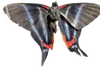
123 Rhetus dysonii caligosus ♂ VV Papilionoidea - Riodinidae