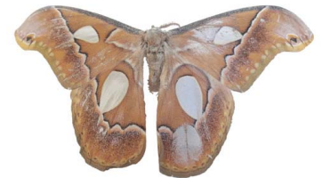
132 Rothschildia aricia VD Bombycoidea - Saturniidae