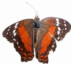
26 Anartia amathea (Mariposa pabón, Princesa Roja) VD Papilionoidea - Nymphalidae