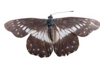
94 Catasticta flisa (Mariposa Victoria) VD Papilionoidea - Pieridae