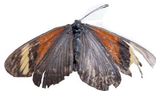
14 Actinote callianira ♀ VD Papilionoidea - Nymphalidae