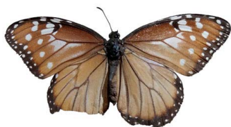
37 Danaus gilippus ♀ (Mariposa Reina) VD Papilionoidea - Nymphalidae