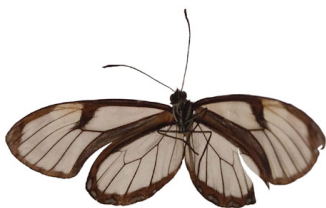
77 sp. Papilionoidea - Nymphalidae