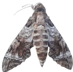
137 sp. Bombycoidea - Sphingidae