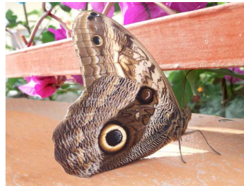
31 Caligo telamonius (Mariposa Búho) Papilionoidea - Nymphalidae