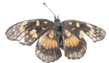
32 Chlosyne sp. VD Papilionoidea - Nymphalidae