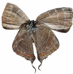
13 sp. Papilionoidea - Lycaenidae