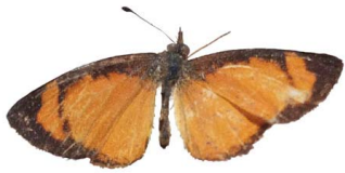
81 Tegosa anieta VD Papilionoidea - Nymphalidae

[fieldguides.fieldmuseum.org] [507] versión 1 6/2019