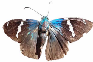
2 Astraptus fulgerator (Saltarina azul de dos barras) VD Hesperioidae - Hesperiiidae