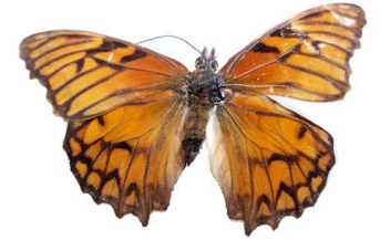
44 Dione glycera (Pasionaria andina) VD Papilionoidea - Nymphalidae