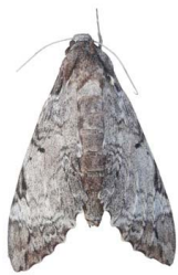
138 sp. Bombycoidea - Sphingidae