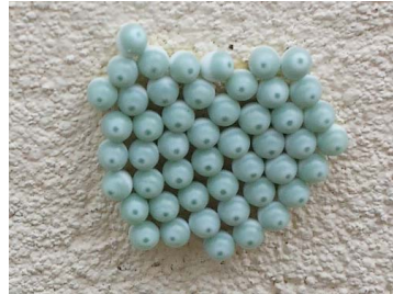
130 Hylesia sp. (Huevos) Bombycoidea - Saturniidae