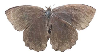
60 Pedaliodes sp. VD Papilionoidea - Nymphalidae