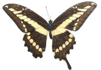
92 Papilio (Heraclides) sp. (Limонера grande, Alas de golondrina)VD Papilionoidea - Papilionidae