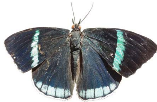
62 Perisama sp. VD Papilionoidea - Nymphalidae