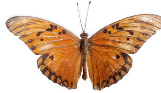
23 Agraulis vanillae (Mariposa Espejito) VD Papilionoidea - Nymphalidae