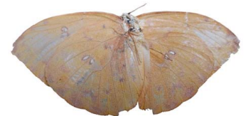
116 Phoebis philea philea (Mariposa Azufre de Bandas Naranja) VV Papilionoidea - Pieridae