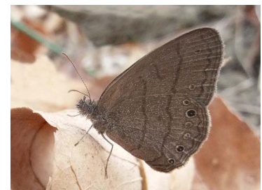
80 sp. Papilionoidea - Nymphalidae