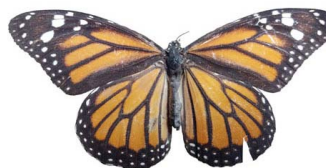
39 Danaus plexippus ♀ (Mariposa Monarca) VD Papilionoidea - Nymphalidae