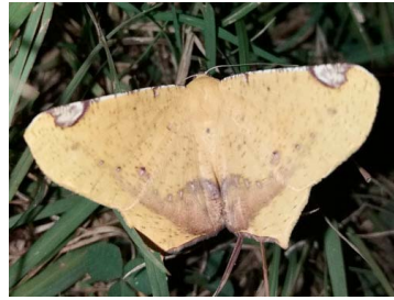
142 Nepheloleuca sp. Geometroidea - Geometridae