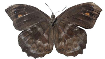
68 Pronophila sp. VV Papilionoidea - Nymphalidae