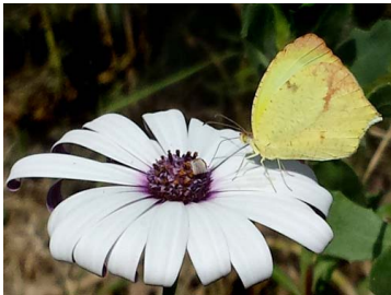
109 Eurema salome ♀ Lib. Papilionoidea - Pieridae