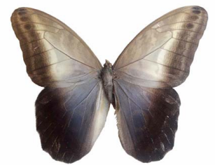
28 Caligo telamonius (Mariposa Búho) VD Papilionoidea - Nymphalidae