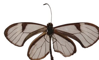
79 sp. Papilionoidea - Nymphalidae