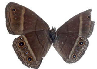
76 sp. Papilionoidea - Nymphalidae