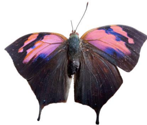
50 Fountainea nessus ♂ (Mariposa hoja) VD Papilionoidea - Nymphalidae