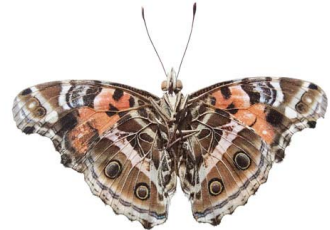
86 Vanessa myrinna VV Papilionoidea - Nymphalidae