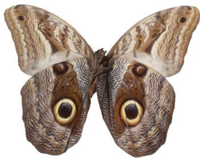
29 Caligo telamonius (Mariposa Búho) VV Papilionoidea - Nymphalidae