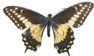
90 Papilio polyxenes americanus VD Papilionoidea - Papilionidae