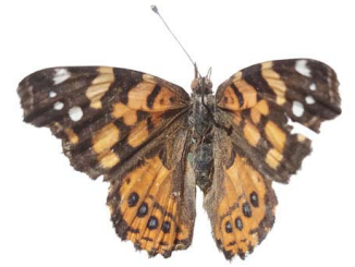
84 Vanessa carye VD Papilionoidea - Nymphalidae