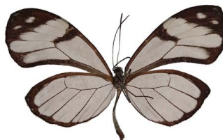
78 sp. Papilionoidea - Nymphalidae