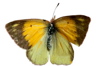
96 Colias dimera ♀ VD Papilionoidea - Pieridae