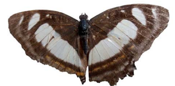
56 Metamorpha elissa VD Papilionoidea - Nymphalidae