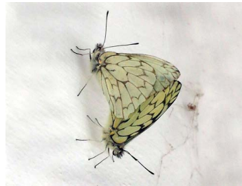
111 Hesperocharis marchalii Cop. Papilionoidea - Pieridae