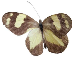
102 Dismorphia medora ♀ VD Papilionoidea - Pieridae