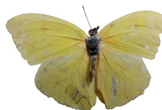
119 Phoebis sennae marcellina ♂ (Mariposa Azufre) VD Papilionoidea - Pieridae