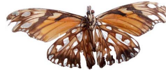
47 Dione junio VV Papilionoidea - Nymphalidae