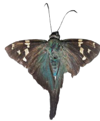
6 Urbanus viterboana VD Hesperioidae - Hesperiiidae