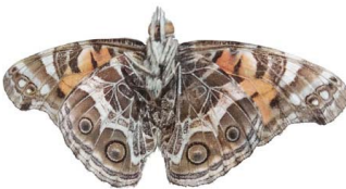
89 Vanessa virginiensis VV Papilionoidea - Nymphalidae