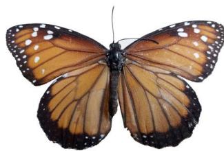
34 Danaus gilippus ♀ (Mariposa Reina) VD Papilionoidea - Nymphalidae