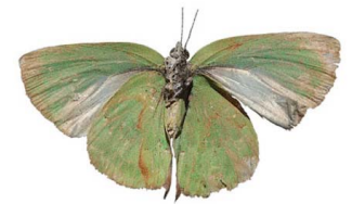
8 Cyanophrys sp. VV Papilionoidea - Lycaenidae