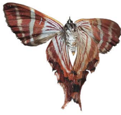
141 Erateina sp. VV Geometroidea - Geometridae

[fieldguides.fieldmuseum.org] [507] versión 1 6/2019