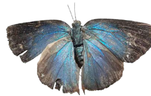
7 Cyanophrys sp. VD Papilionoidea - Lycaenidae