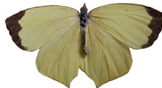
107 Eurema salome ♀ VD Papilionoidea - Pieridae