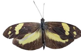
103 Dismorphia medora ♂ VD Papilionoidea - Pieridae