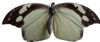
114 Lieinix nemesis nemesis ♀ (Mariposa Conejita) VD Papilionoidea - Pieridae