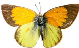
97 Colias dimera ♂ VD Papilionoidea - Pieridae