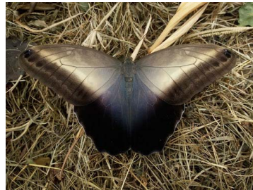
30 Caligo telamonius (Mariposa Búho) Papilionoidea - Nymphalidae