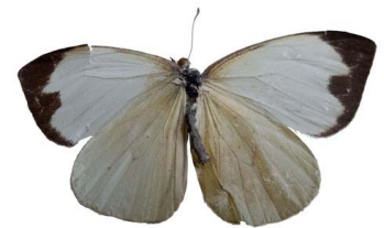
112 Leptophobia aripa (Mariposa Blanca de la Col) VD Papilionoidea - Pieridae