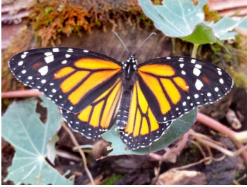
41 Danaus plexippus ♀ (Mariposa Monarca) Papilionoidea - Nymphalidae

[fieldguides.fieldmuseum.org] [507] versión 1 6/2019