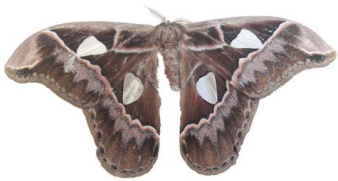
133 Rothschildia sp. VD Bombycoidea - Saturniidae