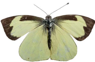
113 Leptophobia eleone VD Papilionoidea - Pieridae