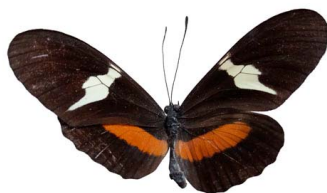
54 Heliconius clysonymus (Amaranta roja) VD Papilionoidea - Nymphalidae