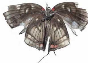
11 Panthiades sp. VV Papilionoidea - Lycaenidae