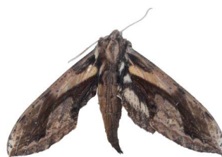
139 sp. Bombycoidea - Sphingidae