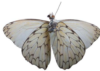
110 Hesperocharis marchalii VV Papilionoidea - Pieridae