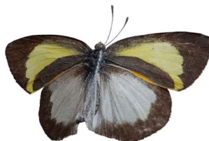
106 Eurema elathea vitellina ♂ VD Papilionoidea - Pieridae