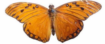
24 Agraulis vanillae (Mariposa Espejito) VD Papilionoidea - Nymphalidae