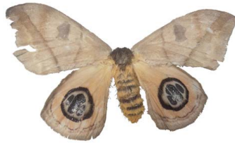
126 Automeris sp. VD Bombycoidea - Saturniidae