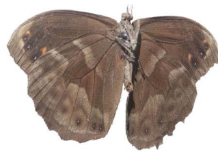
66 Pronophila sp. VV Papilionoidea - Nymphalidae