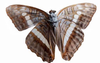
20 Adelpha alala VV Papilionoidea - Nymphalidae