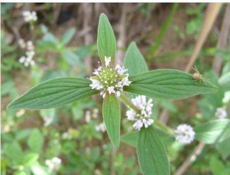
10 Mitracarpus baturitensis Sucre