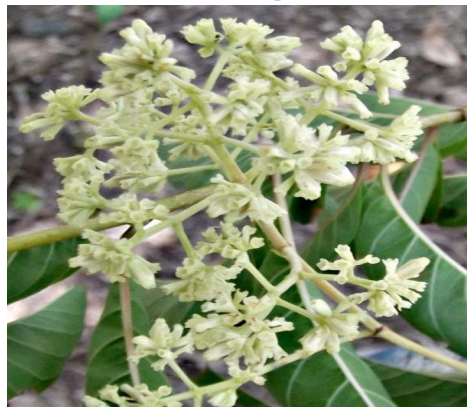
8 Machaonia acuminata Bonpl.