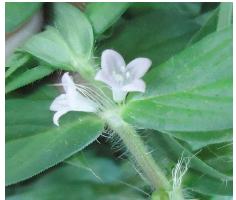
6 Diodella teres (Walt.) Small