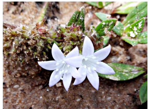
12 Richardia grandiflora (Cham. & Schtdl.) Steud.