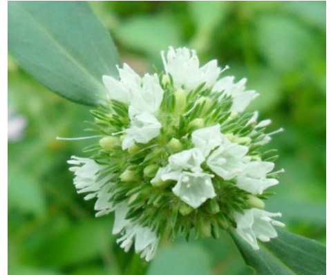
3 Borreria spinosa Cham. & Schtdl.