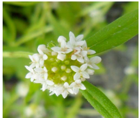
9 Mitracarpus baturitensis Sucre