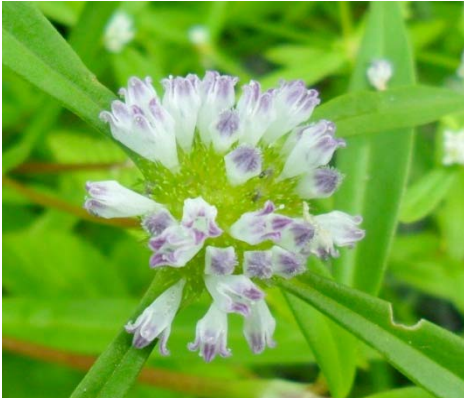
1 Borreria scabiosoides Cham. & Schtdl.

© Produção: M. F. Souza Silva [lenolysilva@hotmail.com] e I. M. de Andrade [ivanilhaandrade@hotmail.com]. [fieldguides.fieldmuseum.org] [632] versão 1 11/2017