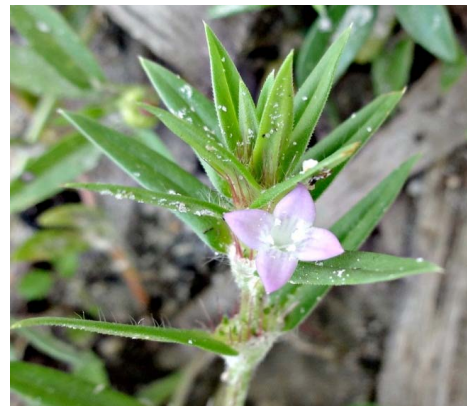
5 Diodella apiculata (Willd. ex Roem. & Schult.) Delprete