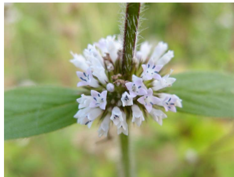
11 Mitracarpus salzmannianus DC.