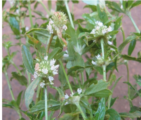
2 Borreria spinosa Cham. & Schtdl.