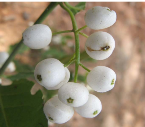
4 Chiococca alba (L.) Hitchc. Fruto