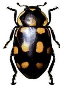
15 Eriopsis opposita