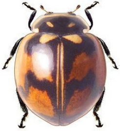
1 Adalia angulifera