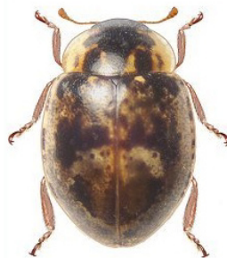
40 Stenadalia nigrodorsata