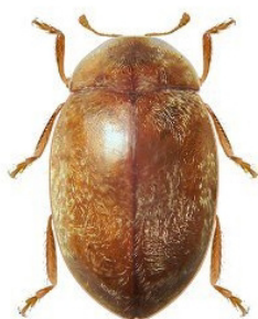
29 Orynipus darwini