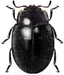
17 Eupaleoides chiloensis