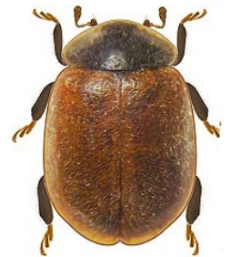
24 Neoryssomus variabilis