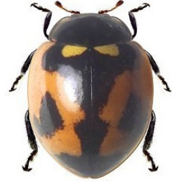
4 Adalia kuscheli