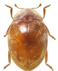
28 Orynipus chilensis