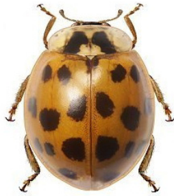
18 Harmonia axyridis