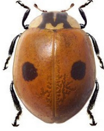
2 Adalia bipunctata