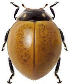
9 Cycloneda limbicollis