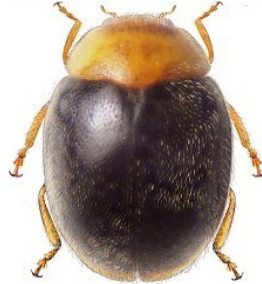
38 Scymnus bicolor