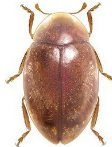
31 Orynipus ultimensis