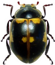
10 Cycloneda patagonica