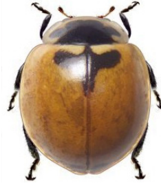
3 Adalia deficiens