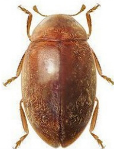
30 Orynipus kuscheli