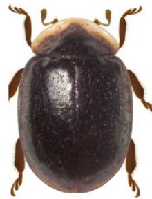
23 Neoryssomus germainii