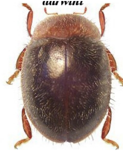
35 Rhyzobius lophanthae