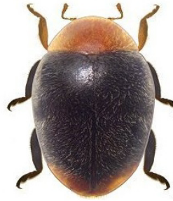
7 Cryptolaemus montrouzieri