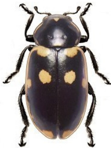
14 Eriopsis magellanica