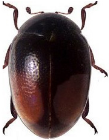
33 Parasidis brethesi