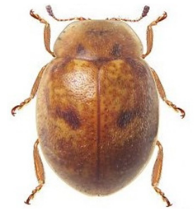
32 Paracranoryssus chilianus