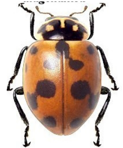
20 Hippodamia variegata