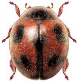
37 Novius cardinalis