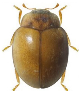
26 Nothocolus sp.