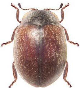
25 Nothocolus sicardi