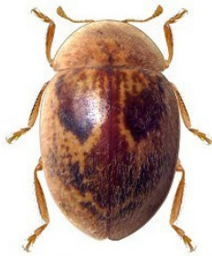
6 Cranoryssus variegatus