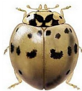
27 Olla v-nigrum