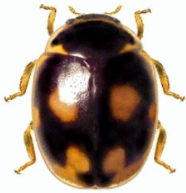
21 Hyperaspis festiva