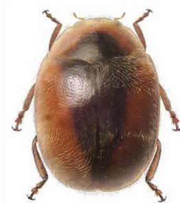
39 Scymnus loewii