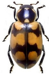
11 Eriopsis chilensis