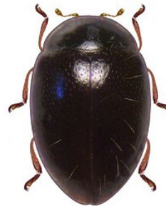
41 Stictospilus darwini