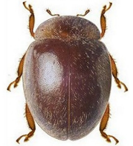
36 Rhyzobius sp.