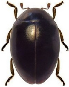
5 Coccidophilus sp.