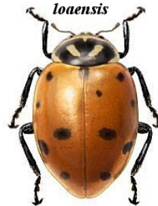
19 Hippodamia convergens