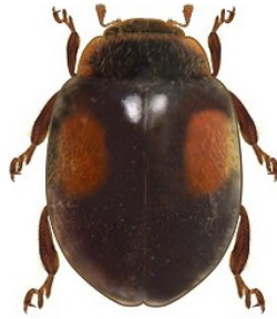
22 Neorhizobius fuegensis