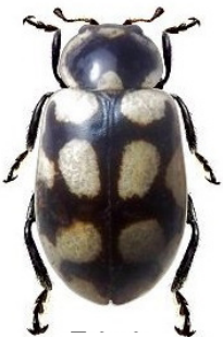
13 Eriopsis loaensis