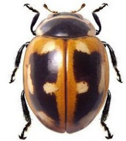
8 Cycloneda germanii