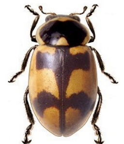
12 Eriopsis eschscholtzii