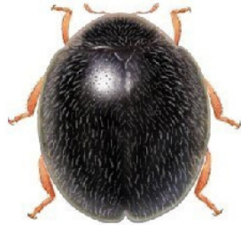
34 Parastethorus histrio