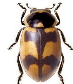
12 Eriopsis eschscholtzii