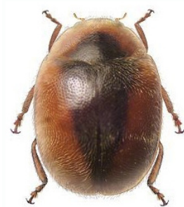
39 Scymnus loewii