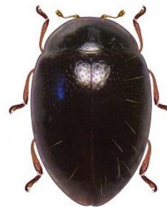
41 Stictospilus darwini