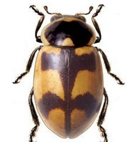
12 Eriopsis eschscholtzii