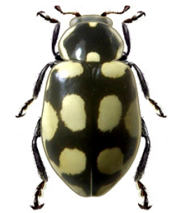
16 Eriopsis sp.