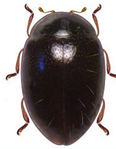
41 Stictospilus darwini